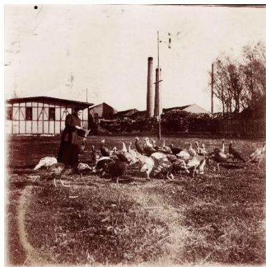
Slika 3. Katarina Hepburn u dvorištu tvornice