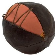
Slika 4. Prva nogometna lopta

Otvaranje Tvornice tanina Županji nije donijelo samo razvoj u vidu novih radnih mjesta, već i novih oblika zabave. Iza zatvorenih vrata tvornice, Englezi su igrali brojne igre, među kojima je bio i nogomet. Domaće stanovništvo, u početku je samo gledalo, no kasnije su zaigrali zajedno s Englezima. „Po iskazu Đ. Nikolića, odjeća u kojoj su igrali nogomet bila je: uske hlače, cipele pravljene specijalno za nogomet, nalik budućim kopačkama, obične košulje sa zavrnutim rukavima.“ (Balentović, 1980: 29). Oni su donijeli i prvu nogometnu loptu (slika 4.) u Hrvatsku koja je sasvim slučajno došla u posjed Županjaca.