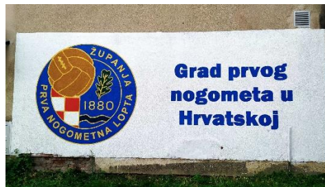
Slika 6. Grafit u Županji

pokazali na koje načine se zabavljati, Englezi su postavili temelje kojima je kasnije Županja postala urbana sredina, a o zahvalnosti Županjaca govori i činjenica da većina udruga nosi izvorno ime s godinom osnutka te brojni članci kojima se nastoji da se ne zaborave njima tako važni migranti. Većina udruga i institucija postoji i danas. Kako je već spomenuto, sport koji su donijeli Englezi upisao je Županju na svjetsku kartu. Teniski klub u Županji jedan je od najstarijih u Hrvatskoj, a nogometni klub danas je jedan od glavnih simbola Županje. Oni koji su živjeli na prijelazu iz 19. u 20. stoljeće, vjerojatno nisu mogli ni sanjati da će nogomet poprimiti tako važno mjesto u životima Županjaca. Grad Županja ukrašen je grafitima posvećenima prvom igranju nogometa (slika 5.) i Nogometnom klubu „Graničar“ tako da se nikada ne bi zaboravilo.