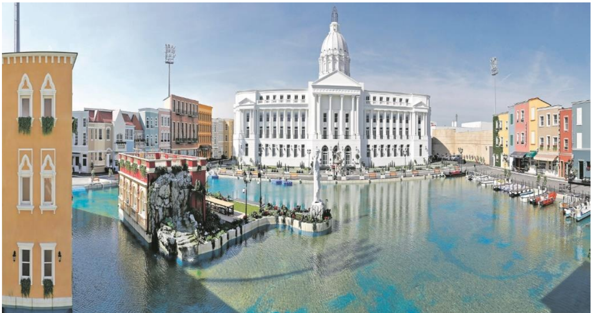
Slika 2. – Bijela kuća

koji se svake emisije izmjenjuju. Program od svojih početaka puni novinske stupce i obara rekorde gledanosti. U rujnu 2022. godine popularni influencer i YouTuber Bogdan Ilić, poznatiji kao Baka Prase, pokrenuo je peticiju za ukidanje Zadruga, zbog nesuglasica i međusobnog javnog serviranja prljavog rublja s vlasnikom televizije Pink. Do sada je emitirano pet sezona u sveukupnom trajanju od 1.514 dana; I. sezona 287 dana (6. rujna 2017. – 20. lipnja 2018.), II. Sezona 303 dana (6. rujna 2018. – 6. srpnja 2019.), III. Sezona 309 dana (6. rujna 2019. – 11. srpnja 2020.), IV. Sezona 307 dana 6. rujna 2020. – 10. srpnja 2021.) i V. sezona 308 dana (5. rujna 2021. – 10. srpnja 2022.).