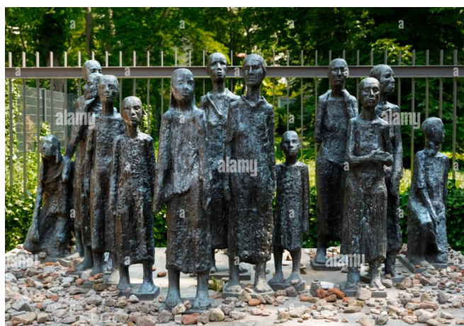
Prilog 4 – Memorijal holokaustu na Berlinskom groblju / / URL: https://www.alamy.com/deportation-memorial-old-jewish-cemetery-grosse-hamburger-strasse-berlin-germany-image212928655.html