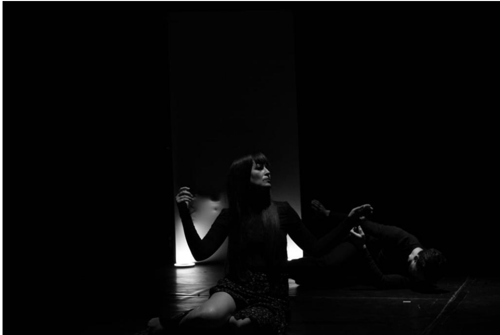
Prilog 8 - Detalj predstave