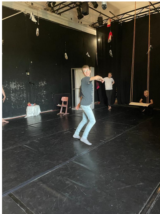
Prilog 3 - Detalj probe

Nakon nekoliko mjeseci prikupljanja materijala vezanih za moju prvotnu ideju prolaznosti i smrti ušla sam u prostor u travnju 2022. Nakon razgovora sa sumentorom došli smo do zaključka da će osnovni koncept predstave biti kolaž. Za vrijeme procesa su se neke stvari mijenjale ovisno o tome kako smo iskoristavali prikupljene materijale. U procesu umjetničkog stvaranja su mi pomogli glumci teatra Inat i moja djeca. Sudjelovali su u probama na kojima sam koristila vježbe Barbare Matijević. Na taj način sam došla do ideja za fizičko ispoljavanje pojedinih riječi unutar glavne koreografske konstrukcije. Sve probe su bile održane u prostorima Dr. Inat teatra i također generalna proba koja je bila otvorena za publiku i premijera. Premijera je bila izvedena 02. 09. 2022.