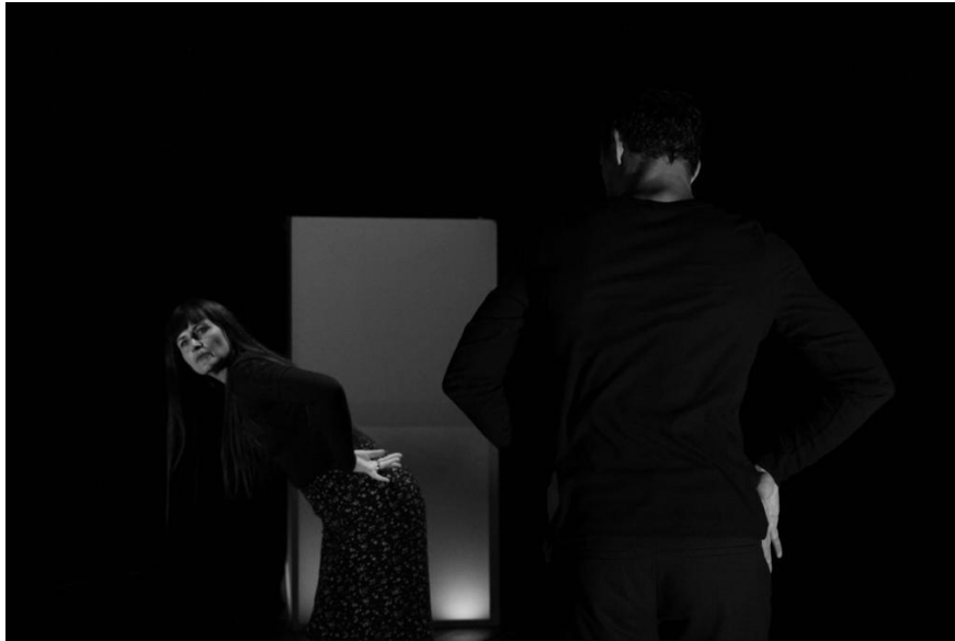
Prilog 5 - Detalj predstave