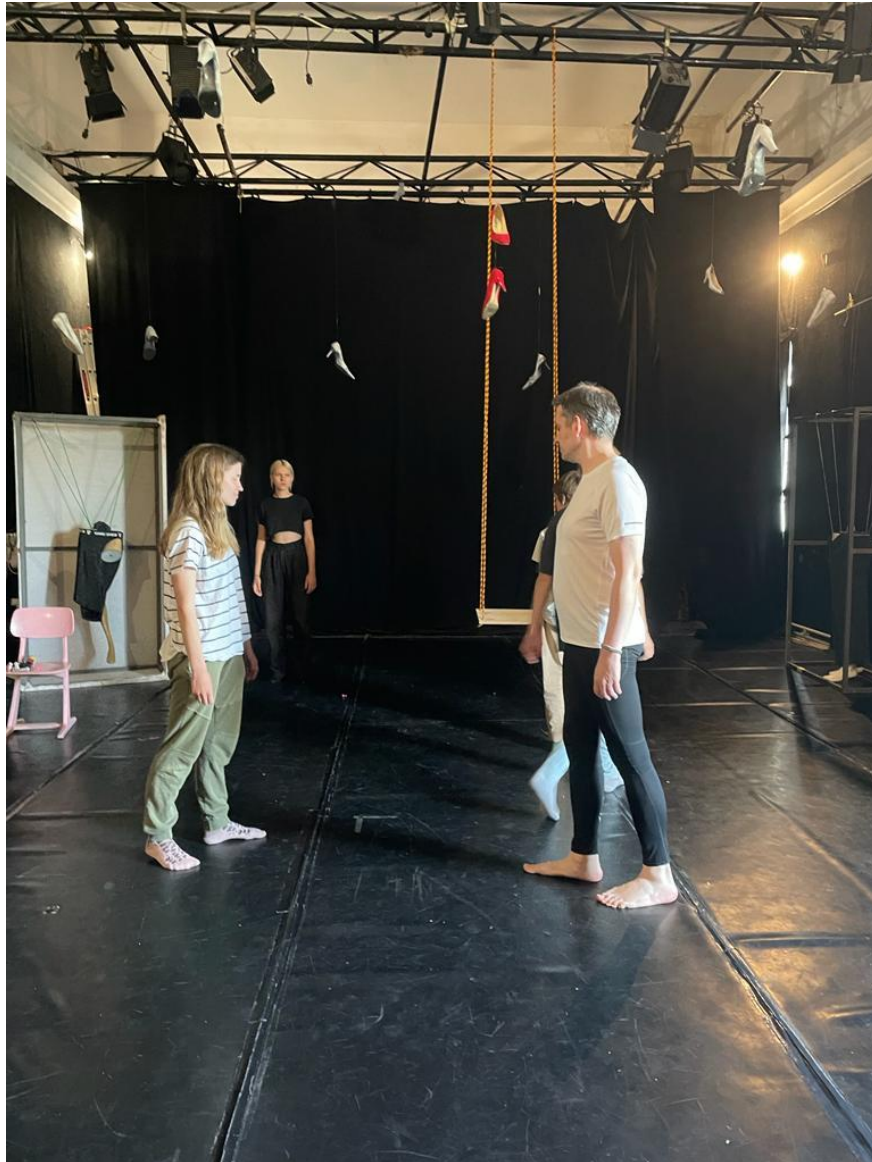
Prilog 7 - Detalj probe