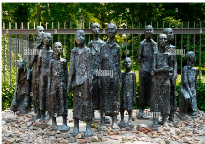
Prilog 4 – Memorijal holokaustu na Berlinskom groblju