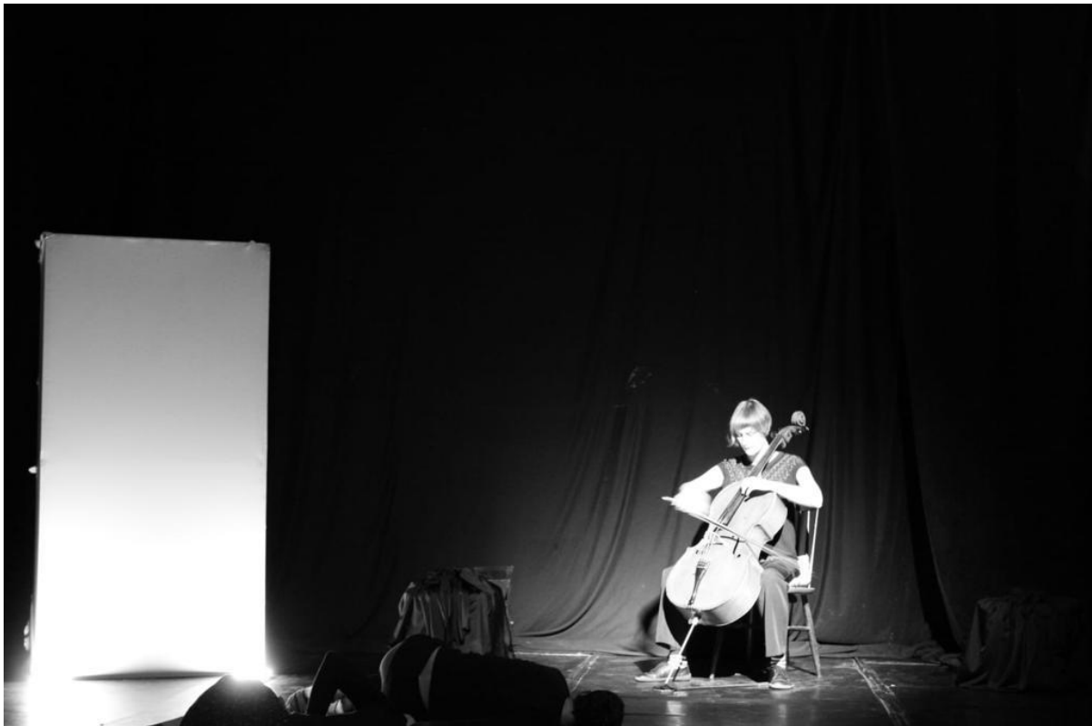
Prilog 2 - Detalj predstave