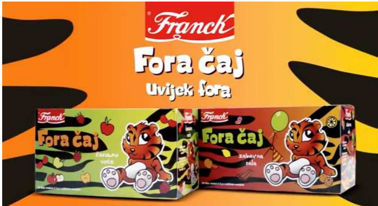
Slika 8. Franck fora čajevi