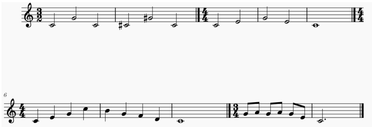
Slika 6. Primjer različitih vježbi rastavljenih intervala, akorada i kombinacija intervala

Učitelja učenicima zadaje vježbu tako da odsvira neki interval, rastavljeni trozvuk, četverozvuk ili kombinaciju intervala. Ove vježbe su bitne za razvijanje opsega glasa, vježba se intonacija, ujednačenost tonova. Kao i u prethodnoj vježbi i u ovoj se mogu prilikom pjevanja izgovarati različiti slogovi te kombinacije slogova.