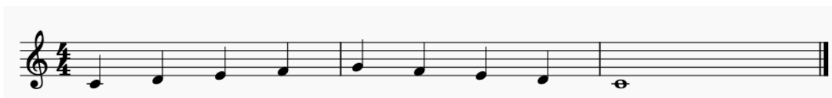
Slika 5. Primjer fraze u uzlazno-silaznoj kombinaciji