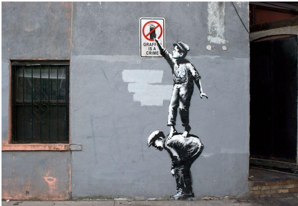
Slika 8. - „Graffiti is a crime“ – Banksy

preživljavanja i dokazan je kroz povijest: piramide u Gizi, Rimsko Carstvo ili praksa pripisivanja bogatstva, da spomenemo samo nekoliko primjera. Nažalost, mladi iz urbanih nižih klasa često su potpuno lišeni bilo kakvih mogućnosti da se popnu na ljestvici i steknu bogatstvo. Umjesto toga, zaključani su u društvenoj situaciji u kojoj rade puno radno vrijeme kako bi spojili kraj s krajem i imaju vrlo malo viška. Što je još gore, stalna borba samo za zadovoljavanje osnovnih potreba potiče ih da svoje slobodno vrijeme (i novac) provode radeći stvari koje su zabavne i ne nužno konstruktivne. Srećom, instinkt za ostankom na životu koji svaka osoba ima ne može se tako lako razbiti. Iako stariji ljudi koji su dugo bili zatvoreni u takvim situacijama mogu postati apatični i smatrati da su takvi oblici izražavanja "besmisleni", mlade tek treba u potpunosti promijeniti njihova okolina, a na njih još uvijek može utjecati njihov nasljedni instinkt preživljavanja. Oni i dalje žele postići ili stvoriti nešto po čemu će ih ljudi pamtiti, nešto što će njihovu poruku održavati živom izvan groba. Uzimajući ovu ideju i prilagođavajući je svom urbanom okruženju i dostupnim resursima, objašnjava se osnovni razlog zašto bi odlučili napisati nešto za javnost.