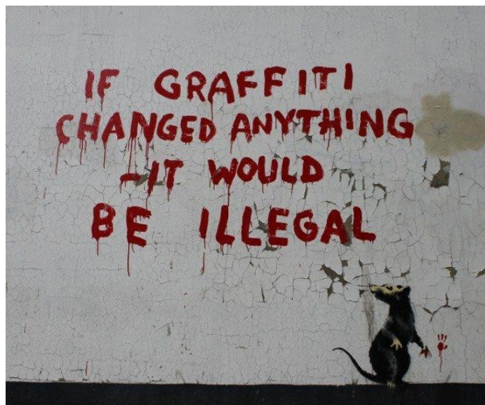
Slika 16. - „If graffiti changed anything it would be illegal“ - Banksy

S obzirom na to, mislim da ukoliko bi nenadzirani prostori bili široko dostupni, čak i u zapadnim zemljama, iz njih bi nastala neka vrlo lijepa i društveno osviještena umjetnička djela. Bez sumnje bi započelo s nasumično napravljenim oznakama i čime već, ali pretpostavljam da bi se polako razvijalo s vremenom. Netko bi došao i napisao nešto, zatim bi netko drugi došao i nacrtao nešto kao odgovor na to, a onda bi možda netko došao i nadogrudio na taj crtež, i tako dalje. Umjesto umjetničkog djela, uokvirenog i obješenog u muzeju nakon završetka, ovo bi bila vrsta ulične umjetnosti koja se stalno razvija. Vrlo živa i uvijek se mijenja prema hirovima i uvjetima okolnih stanovnika. Umjetnička djela koja su živa koliko i gradovi koji ih ugošćuju. To je vrsta ulične umjetnosti kojoj se jako veselim.