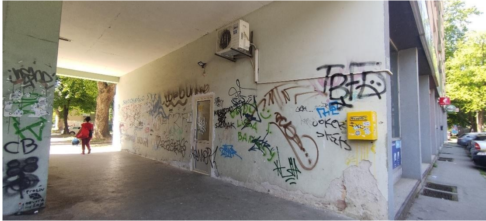
Slika 6. - Grafiti zid, Vukovarska cesta, Osijek

U gradu u kojem su ti mladi marginalizirani, izopćeni i nevidljivi, grafiti su način da postanu vidljivi, osjećaju da je sustav protiv njih, a uzlazna socijalna mobilnost im je ograničena, pa je objavljivanje njihovih imena po gradu način da steknu poštovanje od svojih vršnjaka i potvrde svoje dostojanstvo, a to nije lako s drugih mjesta i institucija u društvu. To nam daje pojašnjenje iz kojeg razloga toliki broj mladih zakoračio u svijet grafita, bilo to društveno neprihvatanje, želja za prepoznatljivošću ili samo bunt protiv sustava koji ih ne razumije.