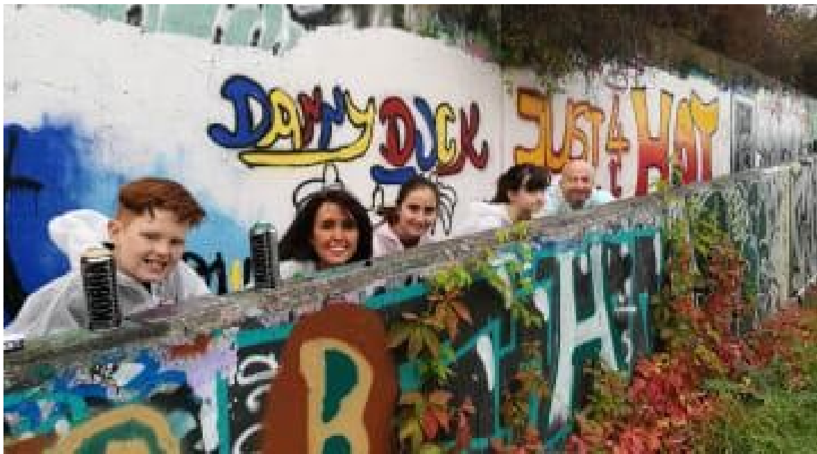
Slika 18. – Grafiti radionica

Prema tomu, možemo reći kako grafiti mogu postati visoka umjetnost s vremenom, i s na to obzirom da su se neka djela grafitnih umjetnika već prodala po visokim cijenama. Iako na to možemo gledati kao na želju za nečim drugačijim u visokom društvu, više nego kao prihvaćanje ove vrste umjetnosti kao revolucije i želje za boljim životom malog čovjeka. No, tu se i dalje može primijetiti kako umjetnici, čija djela su prodavana po galerijama, to nisu imali u planu. Uzmimo za primjer Banksyja i njegovu „Djevojčicu s balonom“ koja je prodana za 25,4 milijuna dolara, te odmah nakon toga uništena rezačem papira koji je bio ugrađen u okvir unutar kojeg se slika nalazila.