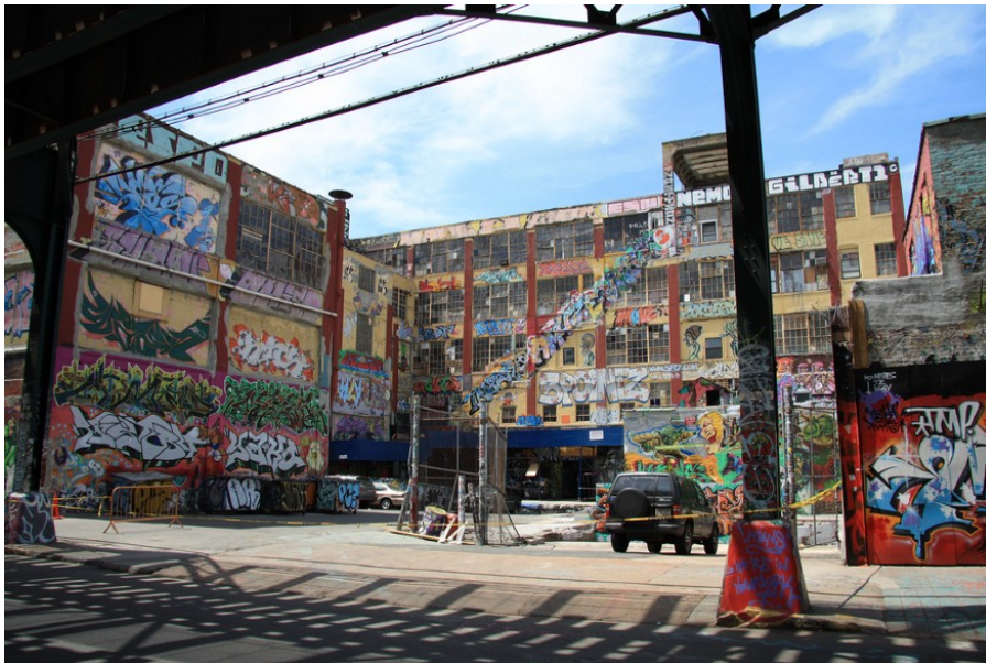
Slika 12. - 5POINTZ, Queens, New York

odmazde. Legalni zidovi za grafite koriste se kao uspješni programi za suzbijanje grafita diljem svijeta. U svijetu postoji 1971 legalni grafitni zid, svaki od njih je dostupan svima koji se žele upustiti u ovu vrstu umjetnosti. Dok ilegalne grafite možemo naći posvuda, odnosno gdje god umjetnik odluči.