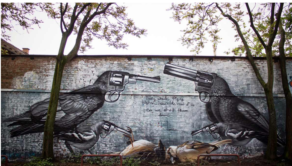
Slika 1. – Zagreb, Street art mural

Kako bi bilo moguće definirati uličnu umjetnost? Moglo bi se tvrditi da je to pitanje za povjesničare umjetnosti ili za teoretičare kulture. No, čini se da prva skupina mislilaca treba vremensku distancu – mora postojati značajno i određeno razdoblje s ishodištem, vrhuncem i budućom perspektivom da bi se definirao pokret ili umjetnička forma. Što se tiče kulturnih teoretičara i sociologa, to je uvijek pitanje koje se odnosi na kulturni kontekst, pitanje promišljanja identiteta ili promišljanja složenih društvenih struktura i semiotičke interpretacije. Ništa od toga ne znači da se ne možemo zapitati što bi to mogla biti ulična umjetnost. Može se reći da je to pokret, svakako umjetnički izričaj, ali sigurno, čak i više od ovoga. Možda je to umjetnička forma za sebe. Jedno je sigurno, ulična umjetnost postala je neizbježan sastavni element suvremene umjetnosti. Možda, dakle, pred nama nije pitanje što je ulična umjetnost, nego zašto je nastala, i što je još važnije, kamo dalje ide? (“Street Art” vs. “Graffiti”: What’s The Difference?, 2020.)