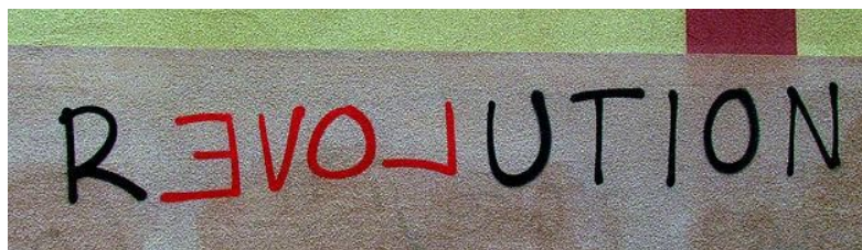
Slika 15. – Revolution, Sweden 2014.

Suvremeni praktičari imaju različite i često suprotstavljene prakse. Neki pojedinci, poput Alexandra Brenera, upotrijebili su medij za politiziranje drugih umjetničkih formi i iskoristili zatvorske kazne koje su nad njima izvršene kao sredstvo daljnjeg prosvjeda. Prakse anonimnih grupa i pojedinaca također se jako razlikuju, a praktičari se nipošto ne slažu uvijek s praksama drugih. Na primjer, antikapitalistička umjetnička skupina Space Hijackers napravila je 2004. djelo o kontradikciji između kapitalističkih elemenata Banksyja i njegove upotrebe političkih slika.