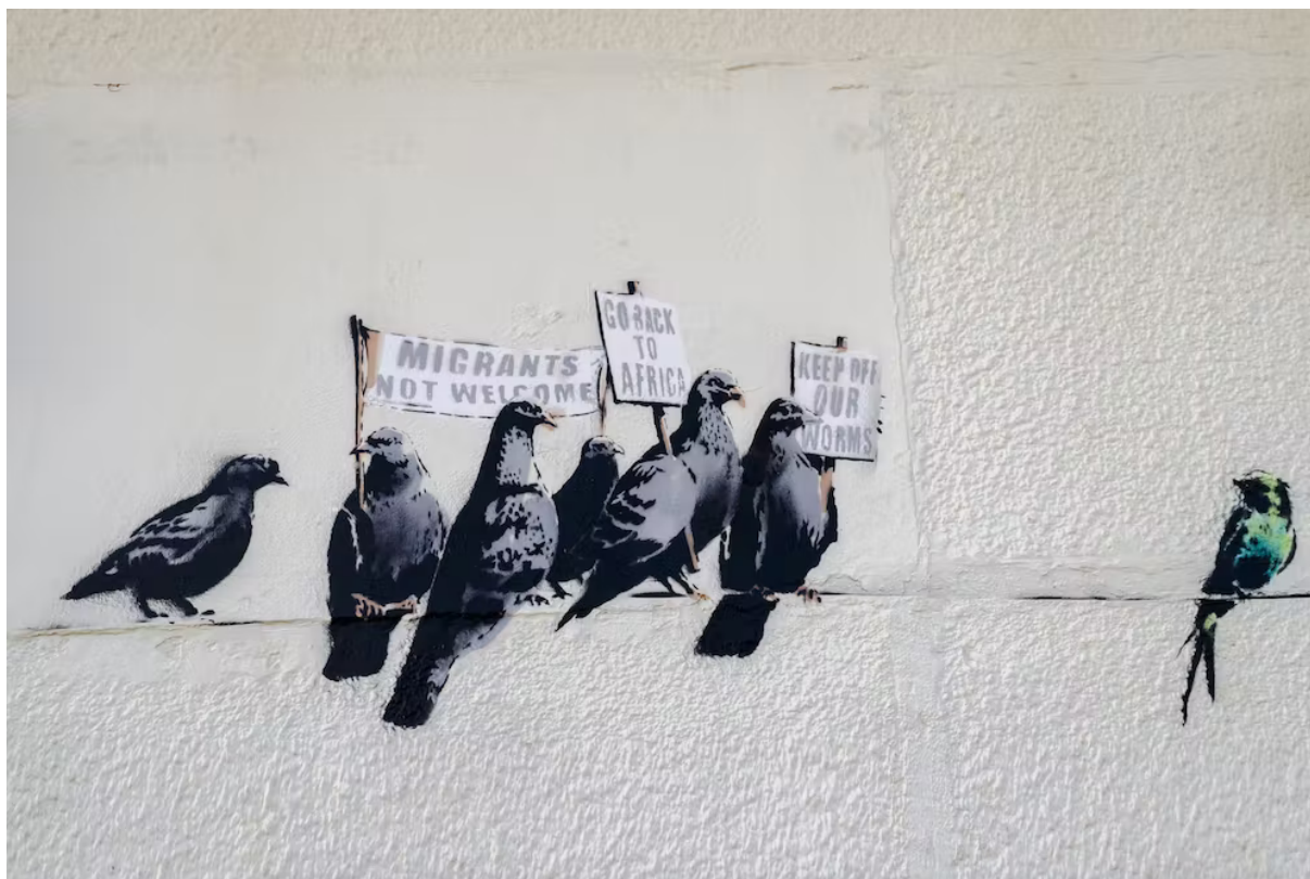
Slika 13. - „Pigeon mural“ - Banksy

Dominantna estetika odbija uličnu umjetnost kao novu formu umjetnosti. Provocira politiku i vladajuće sile, odnosno sve ono što smatraju da nije u redu u državi/gradu. Predstavljaju svoj sustav vrijednosti na način na koji smatraju da ima najviše utjecaja, odnosno na najvišim i najvidljivijim mjestima. Dominantna estetika, iako prihvaća neke umjetnike poput Banksyja, na ostale gleda kao na huligane koji nemaju poštovanja prema javnom prostoru.