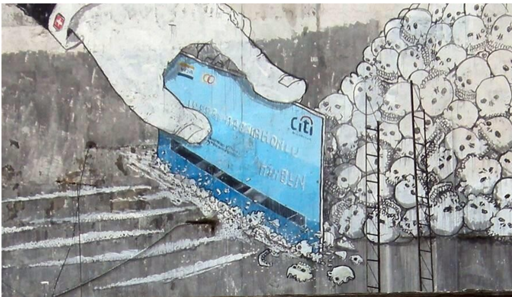
Slika 3. - Novac ubija, BLU

Uz umjetnost izrađivanja grafita vežu se brojne teorije koje ih pokušavaju smjestiti u određene granice. Ono što im je svima zajedničko jest to da, ako ne u potpunosti, onda barem djelomično, grafite povezuju uz neki vid bunta, pobune i djelatnosti na rubu zakona. Tako fotograf Nicolas Ganz tvrdi kako se uz uličnu umjetnost vežu određeni sociološki elementi. On stvara razliku između umjetnika koji stvaraju grafite i onih koji rade u drugim medijima karakterističnim za uličnu umjetnost. Ganz zagovara tezu da su grafiteri vođeni željom za stjecanjem popularnosti kroz "tagove", dok ulični umjetnici (slikari murala, umjetnici koji izrađuju mozaike, skulpture i sl.) nisu ograničeni tako strogim pravilima prilikom kreiranja vlastite ideje i raspolazu većim rasponom stilova i tehnika. Povjesničarka umjetnosti Elizabeth Olson u vezu dovodi grafite i pobunu, tumačeći naglu pojavu "tagova" i ostalih grafita na području svjetskih gradova kao znak internacionalne pobune. (Kelly, 2014, 850)