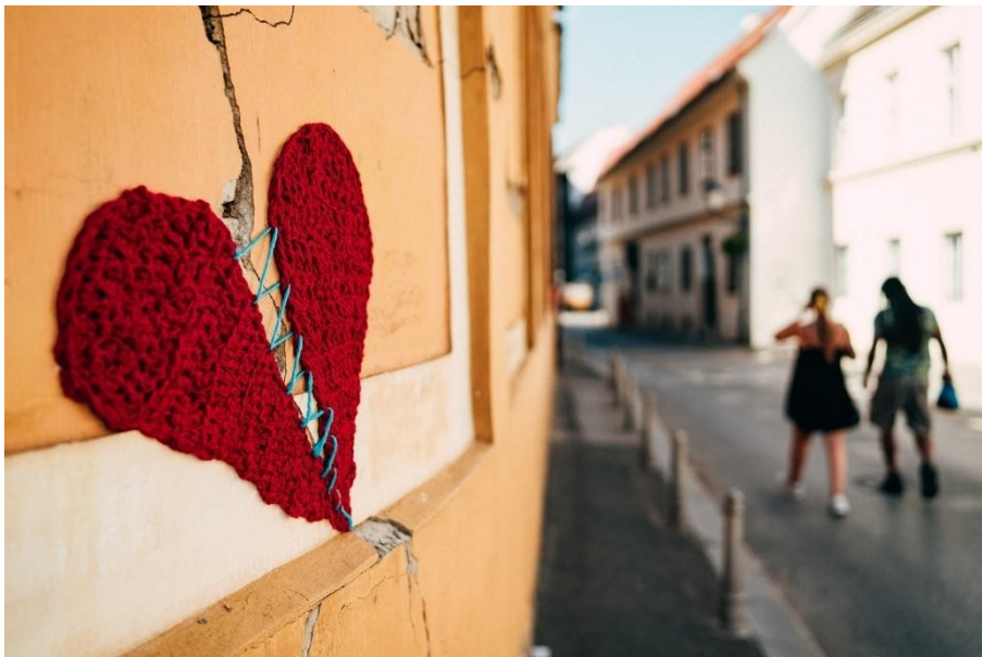
Slika 4. – Projekt „Okolo“, Zagreb

Bombardiranje vunom definira se kao aktivnost prekrivanja dijelova arhitekture, urbane opreme i stabala dekorativnim elementima koji su izrađeni od pletiva. Yarn bombing poznat je i pod nazivima "yarn storming" i "guerilla" ili "urban knitting". Ova grana umjetnosti počela se razvijati u Texasu i to iz potrebe iskorištavanja viška pletiva. Najraniji primjeri bombardiranja vunom mogli su se vidjeti u Nizozemskoj još 2004. godine. Značajke koje bi se mogle primijeniti na fenomen ulične umjetnosti su dekorativnost, ekspresivnost, socijalni ili politički komentari pa i oglašavanje. S obzirom na takvu definiciju, bombardiranje vunom zadržava samo karakteristiku dekorativnosti. Naime, iza ukrašavanja vunom ne stoji namjera za slanjem neke političke ili osobne poruke ili za promocijom. Ono kao cilj ima želju za dekorativnim oplemenjivanjem urbanih površina, a na taj način ujedno izražava i kritiku prema krizi koja vlada u suvremenom gradskom prostoru. Kao i ostale vrste ulične umjetnosti, i bombardiranje vunom smatra se ilegalnom aktivnošću. Usprkos svemu, pozitivna značajka ovakvog kreativnog izražavanja jest u tomu što je u potpunosti neinvazivno. Prilikom postavljanja pletiva na gradske prostore niti jedan segment se ne oštećuje ili je trajno promijenjen. Sve što je postavljeno vrlo se lagano može i ukloniti bez ostavljanja vidljivih posljedica. (September, 2022)