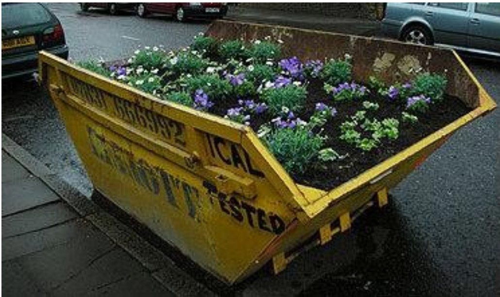
Slika 5. – Cvijeće u kontejneru

Guerilla gardening označava ukrašavanje pojedinih dijelova grada različitim biljkama. S obzirom na to da medij kojim oplemenjuju urbanu sredinu, guerilla gardening ne možemo poistovjetiti s umjetnošću grafita, murala i slično koji u središtu imaju likovne tehnike. S druge strane, ono što je zajedničko ovom aspektu streetarta i svim ostalim je taj što skupine koje sade bilje na prostoru grada taj postupak doživljavaju jednako kao i grafiteri svoj. Naime, jedni i drugi će svojim intervencijama utjecati na vizualni dojam urbanih struktura te će se koncentrirati na izražavanje kreativnosti u svrhu uljepšavanja. Često se koristi mahovina kojom umjetnici izrađuju “žive” grafite na površinama arhitekture. Slično kao i bombardiranje vunom, guerilla gardening ima cilj vizualno i estetski urediti pojedine prostore, šaljući istovremeno i kritiku suvremenom urbanizmu i gradu. Poznat je Međunarodni dan suncokreta. Guerilla vrtlari 1. svibnja svake godine sade suncokrete u svojim četvrtima, najčešće na mjestima koja djeluju zapušteno. Ova akcija traje od 2007. godine te svakom idućom godinom bilježi sve više sudionika. (September, 2022)