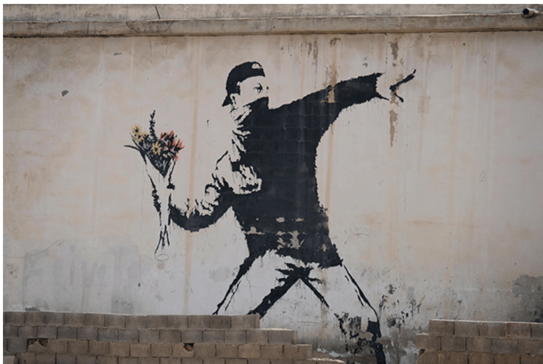
Slika 14. - „Love is in the air“ – Banksy