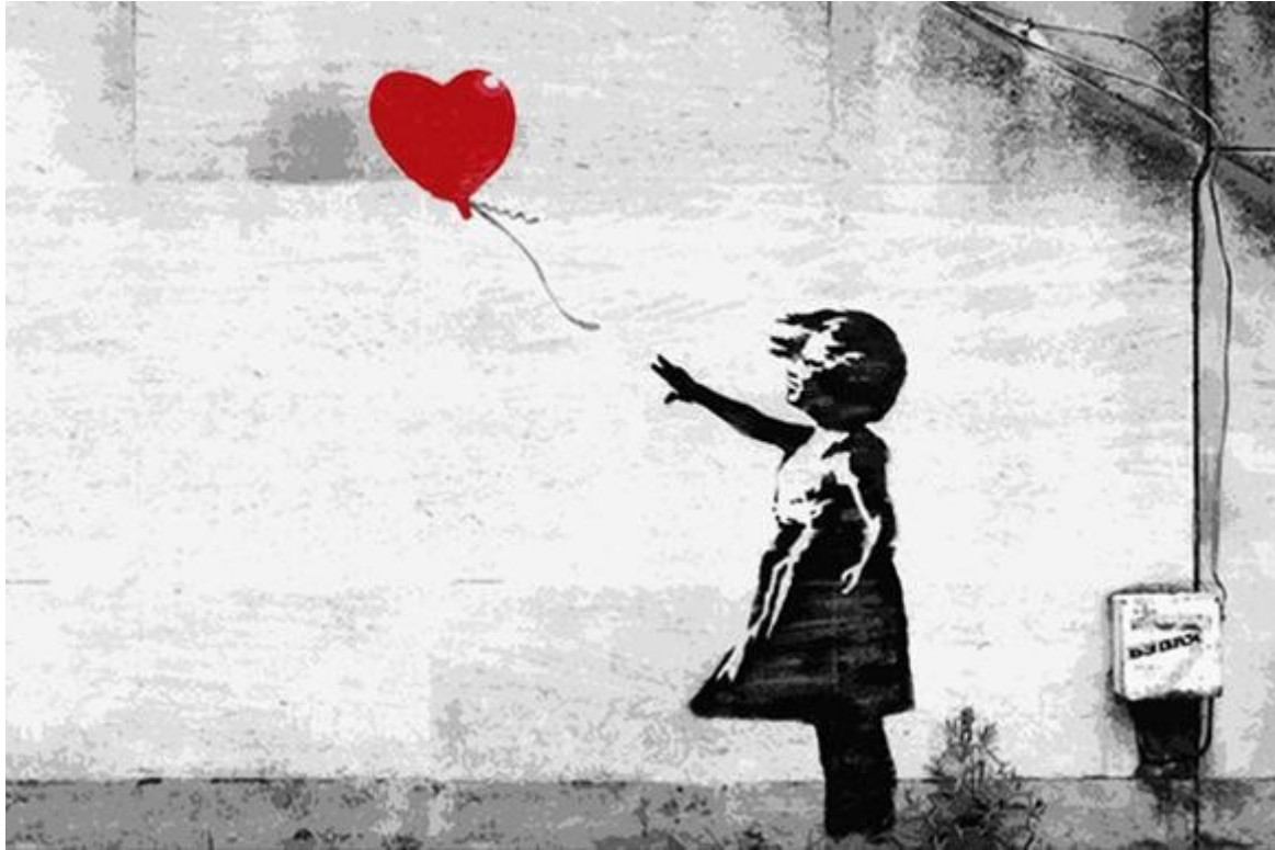
Slika 10. - „Girl with a balloon“ – Banksy

Ulični umjetnici koji dožive komercijalni uspjeh često su kritizirani od svojih kolega da su se "prodali" i postali dio sustava protiv kojeg su se prethodno bunili stvaranjem ilegalnih javnih radova.