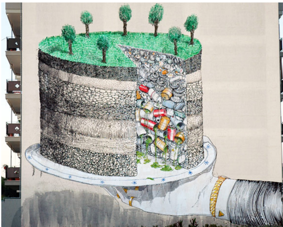
Slika 2. – Mural torte razotkriva gradsko odlagalište otrovnih tvari, BLU

No, na transformaciju ulične umjetnosti nije utjecao samo digitalni prostor. Neki ulični umjetnici, koji su svoj rad započeli sa sprejevima, počeli su istraživati neke inovativne i inspirativne metodološke planove. U umjetnosti BLU-a ulična umjetnost oživljava u kontekstu video-umjetnosti. Nije samo činjenica da krajnji proizvod predstavlja očaravajuću formu umjetničkog izražavanja, to je putovanje koje se događa na ulicama dok umjetnik stvara. Ipak, ne može se ne shvatiti da umjetnost ne nosi video-datoteka, već ulica i zidovi, a umjetnik je spreman na taj korak u nepoznato. Još jedan izvanredan primjer uličnog umjetnika koji je krenuo putem dekonstrukcije i umjetničkog samoistraživanja je Vhils. On je pojmu zida kao predmeta stvaranja dao novo značenje. Dijalog koji ostvaruje s urbanim kontekstom je višerazinski – od intervencije u samu materiju do društvenog komentara suvremenog svijeta komercijalizma. (B. Marić, 2014.)