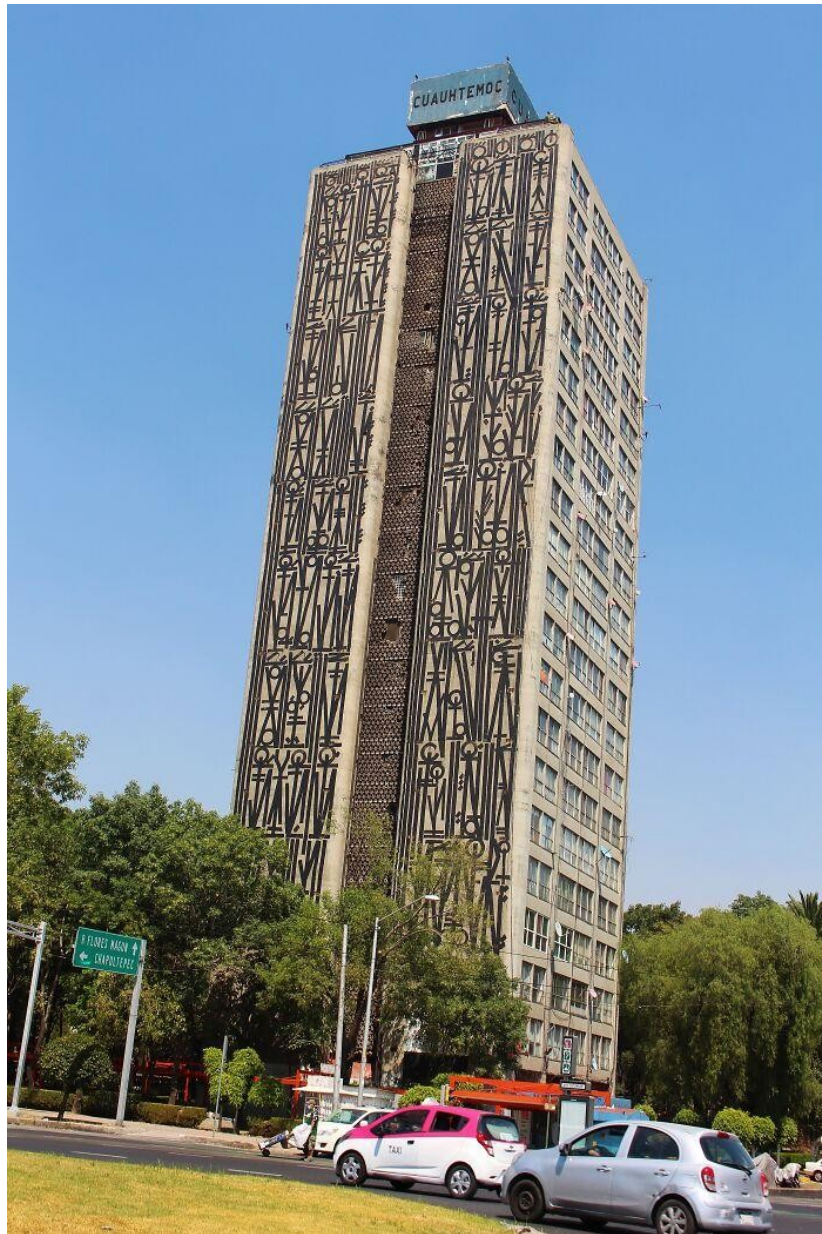
Slika 9. - Tlatelolco zgrade, Retna