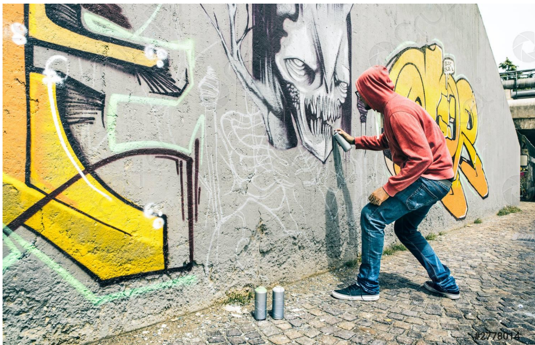
Slika 11. - Grafiti umjetnik

Nekada nevjerojatna partnerstva umjetnika grafita s tradicionalnim muzejima i robnim markama izvela su ove umjetnike iz podzemlja u središte pozornosti. Iako su grafiti povezani s destrukcijom, oni su također medij neograničenog umjetničkog izražavanja. Danas se nastavlja rasprava o granici između nagrđivanja i uljepšavanja. U međuvremenu, umjetnici grafita izazivaju zajednički konsenzus o vrijednosti umjetnosti i stupnju do kojeg se može posjedovati bilo koji prostor. Bilo da se radi o prskanju, šaranju ili grebanju, grafiti na površinu izvlače ova pitanja vlasništva, umjetnosti i prihvatljivosti. (Black, 2018)