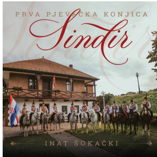
Slika 6: Naslovna slika prvog albuma „Sindira“