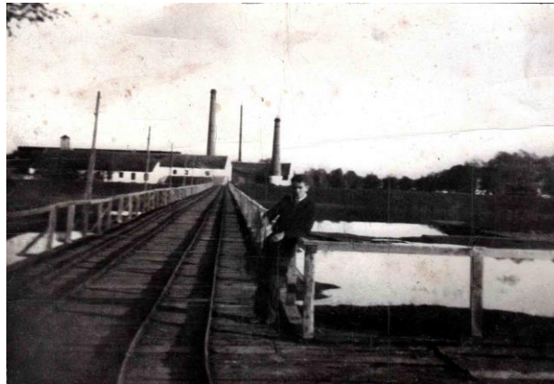
Slika 2: Tvorница tanina u Županji

Oba mjesta drže do svoje tradicije i prošlosti. Gradište ima jedno Kulturno-umjetničko društvo (u nastavku „KUD“), a Županja čak dva koja, uz kulturni centar, neprestano sudjeluju u raznim folklornim manifestacijama da bi pokazali tradiciju svojeg područja. Osim njih, iz Gradišta dolazi i poznati slavonski pjevač Šima Jovanovac, a iz Županje je potekla prva pjevačka konjica Sindir.