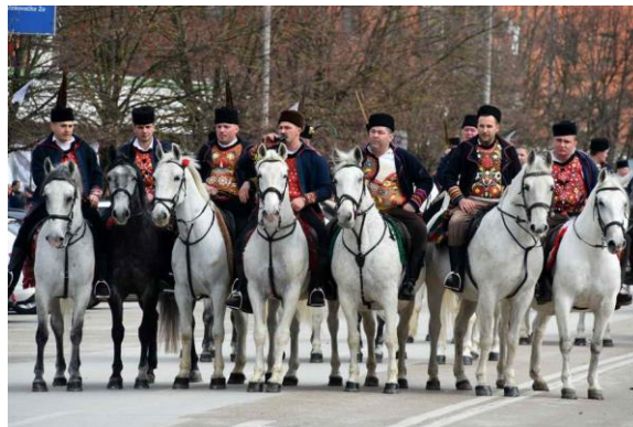
Slika 10: Pokladno jahanje u Županji

Ovaj je običaj bio zabranjen u vremenu nakon Drugog svjetskog rata, a danas je nezamisliv početak Šokačkog sijela bez Pokladne povorke.