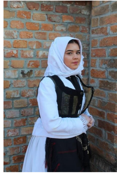
Slika 4: Prikaz ženske narodne nošnje Županje i Gradišća