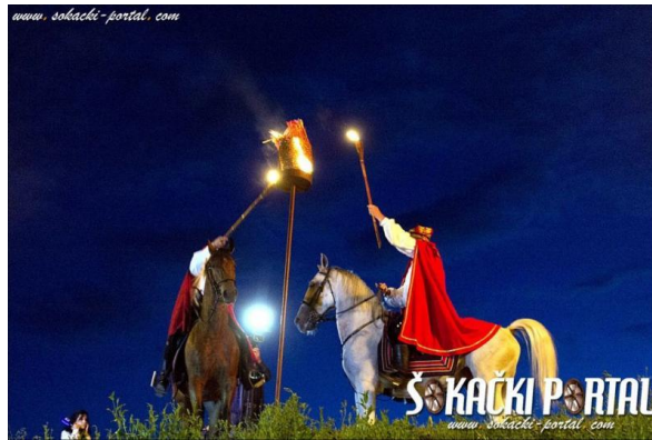
Slika 9: Manifestacija „Kod konjarskih vatri“

kolovozu 2021. godine, u dvorištu Muzeja, premijerno je prikazan i istoimeni dokumentarno-igrani film.