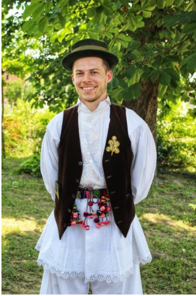
Slika 3: Prikaz muške narodne nošnje Županje i Gradišća