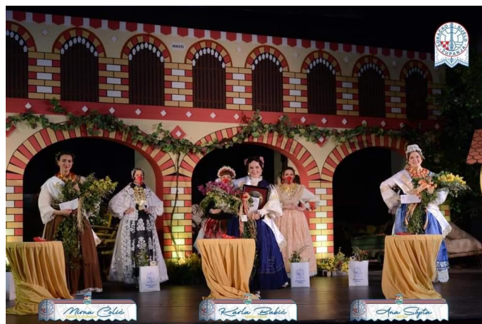
Slika 11: Izbor za „Šokački cvit“