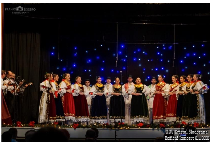
Slika 8: KUU „Kristal-Sladorana“

U današnjem sastavu KUU nalaze se samo dvije sekcije koje su razdvojene na starosnoj osnovi. Iako nema velik broj članova kao u svojoj prošlosti, „Kristal“ i dalje radi na očuvanju svoje tradicije i običaja. Njeguju se izvori oblici pjesme i plesa karakteristični za Županju te ih se nastoji prezentirati gdje god je to moguće da se duga povijest ovog udruge ne bi zaboravila.