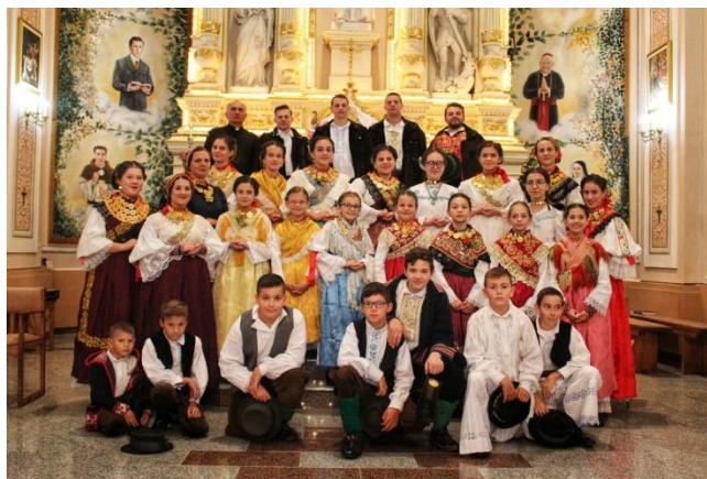
Slika 7: KUD „Seljačka sloga“ Gradište

U 2022. godini, cilj KUD-a ostao je nepromijenjen. I dalje se istražuju i prikupljaju izvorni oblici narodne nošnje te se sudjeluje na svim kulturnim manifestacijama da bi se Gradište prepoznalo kao selo u kojemu se na izrazito vješt način čuva tradicija i običaji naših predaka.