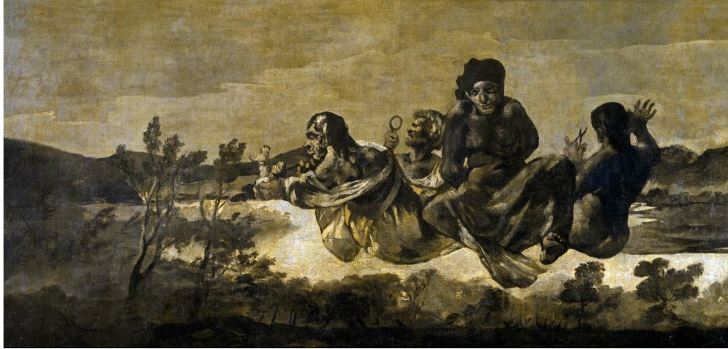
Slika 3 „Atropos“