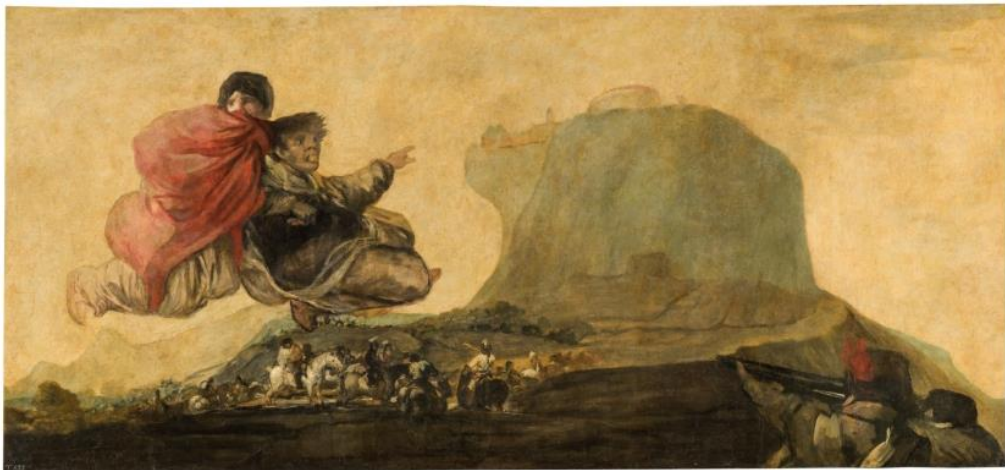
Slika 15 „Asmodea“

„Fantastična vizija“, ili Asmodea . Slika prikazuje stijene u pozadini i dvije figure koje lebde u zraku i izgledaju prestrašeno te pokazuju prema stijeni. Također, prikazani su vojnici koji nemirno trče prema stijeni. Smatra se da je i ova slika prikaz groznog stanja Španjolske u tom vremenu.