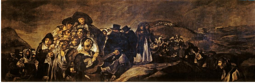
Slika 10 „Hodočašće u San Isidro“