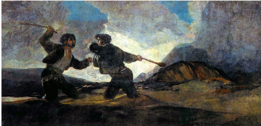
Slika 5 „Borba Toljagama“

Možda su zakopani, ali možda su i u živom pijesku. Nažalost, ne zna se točna pozadina ove slike, ali može se smatrati da je nastala zbog rata i političkog stanja u Španjolskoj i može prikazivati kako se s javnosti može lako manipulirati, da se ljudi okrenu jedan protiv drugog iako imaju većih problema od sukoba.