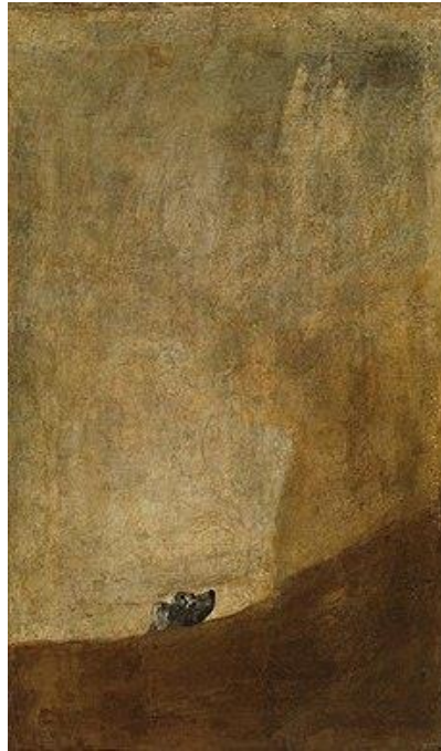
Slika 13 „Pas“