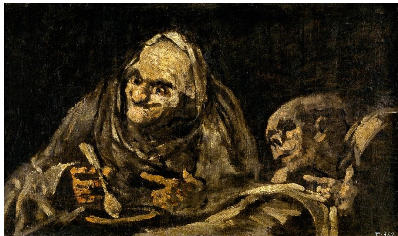
Slika 4 „Dva Starca Jedu Juhu“

„Dva starca jedu juhu“ ili Dos Viejos comiendo sopa . U ovom primjeru, sadržaj bi trebao biti normalan, ali osvjetljenje i izrazi lica svemu ovome daju neku posebnu gnjusnost. Neki ovu sliku nazivaju i „Dvije vještice koje jedu juhu“, jer se ne zna točan spol figura prikazanih na slici. Vrlo je slična slici „Dva starca“, s jednakim uznemirujućim učinkom. Dvije figure imaju stara i izobličena lica, a jedna izgleda kao da nema oči. Te figure imaju poseban kontrast, koji se može odnositi na siromaštvo i gladovanje, ali također može prikazivati Goyin strah od starenja.