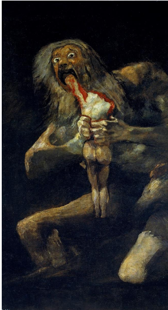
Slika 9 „Saturn Proždire Svog Sina“

ima i malo ljepote, dok ju je Goya u potpunosti zamijenio užasom. Ovom slikom Goya pokazuje da je svjestan svoje paranoje.