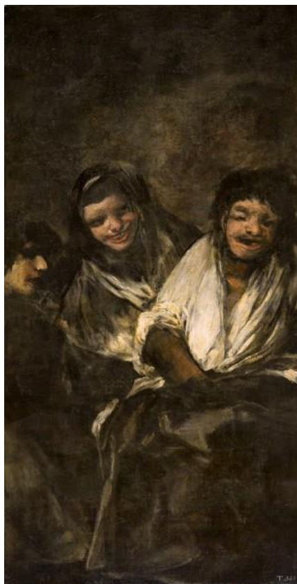
Slika 11 „Žene koje se smiju“

„Žene koje se smiju“, ili Dos Mujeres y un hombre . Opet je prikazana užasna i mračna atmosfera, neprirodnim svjetlom koje prikazuje tri izobličena izraza lica figura. Također ne zna Goyin motiv ovoj slici, ali postoje teorije značenja. Smiješak koji žene nose na licu vrlo je jeziv i strašan i stvara veliku nelagodu gledateljima. Povjesničari vjeruju da slika prikazuje dvije prostitutke koje ismijavaju muškarca s mogućim psihičkim teškoćama. Ova slika imala je drugačiju skicu i plan za izradu. Smatra se da su žene trebale čitati iz knjige koju je muškarac držao.