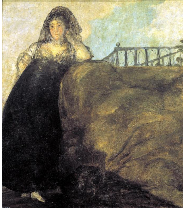
Slika 14 „La Leocadia“