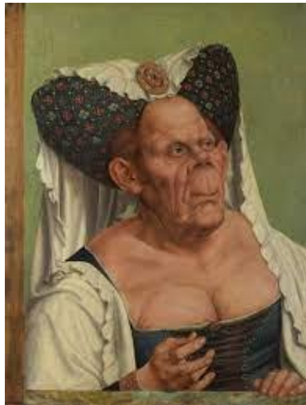
Slika 1 „An Old Woman“

U kasnoj renesansi fenomen groteske daleko je nadilazio zidno slikarstvo, a te su teme bile česte i u drugim umjetničkim medijima. U Parku čudovišta iz Bomarza, visoko alegorijskom vrtu koji je u 16. stoljeću naručio princ Pier Francesco Orsini, a koji se nalazi u Laziju, u Italiji, ti elementi se jasno mogu vidjeti u jednoj od atrakcija parka, Ogra (ogromna struktura nalik maski, čija su vrata zapravo razjapljena usta). Groteska se također proširila na slikarstvo, a dobar primjer za to je renesansna slika „An Old Woman“, Quintena Matsijsa , koja je spajala stvari koje se ne bi trebale spajati - ružno i pogrešno.