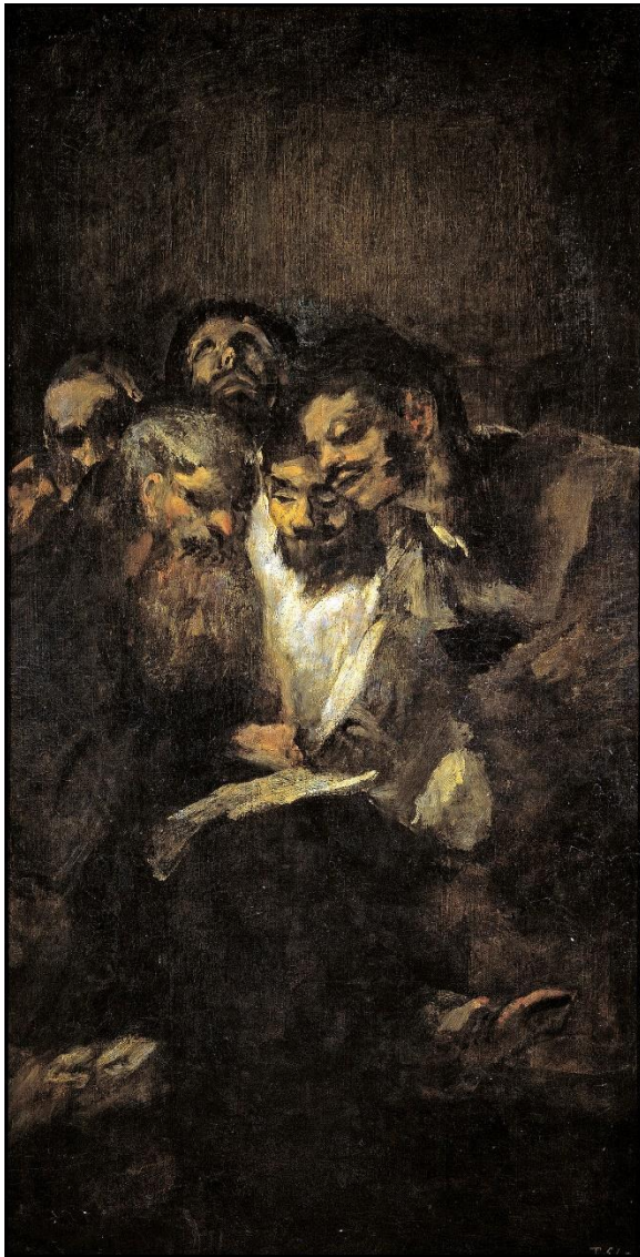
Slika 7 „La Lectura“

prema nebu s izrazom oćaja. Sama tema nije zastrašujuća, ali Goyina upotreba svjetla i cjelokupni prikaz publici izazivaju nelagodu. Smatra se da je želio prikazati beznade koje je osjećao tijekom rasprava o stanju države, u kojima nije mogao sudjelovati već je samo ovisio o krajnjim odlukama. Zanimljivo je da je na istom mjestu prije te slike nacrtao krajolik i ćovjeka s krilima.