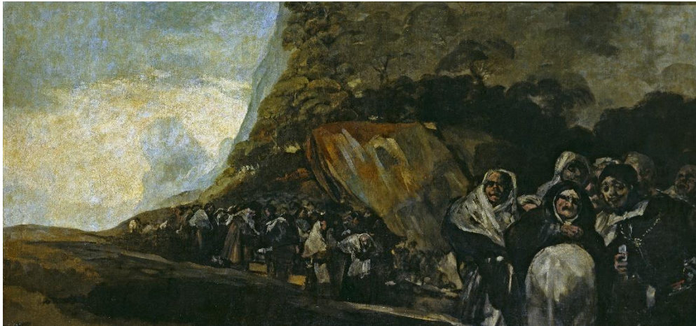
Slika 12 „Procesija svetog oficija“

„Procesija svetog oficija“, ili La romeria de San Isidro . Pozadina slike izgleda lijepo i mirno, dok su izrazi lica ljudi jako uznemirujući i neugodni. Malo se toga zna o ovoj slici. Vjeruje se da je sličnog motiva kao i „Hodočašće u San Isidro“.