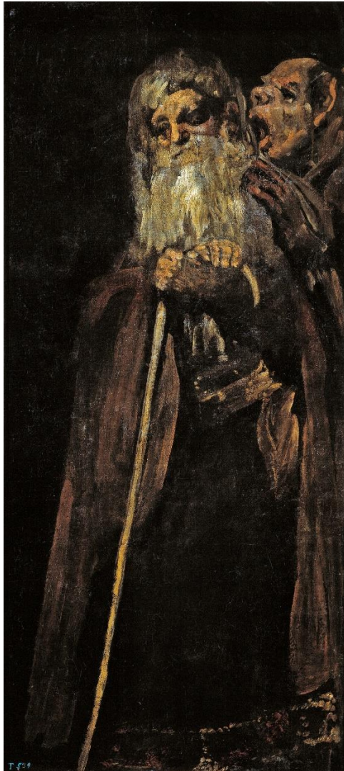
Slika 2 „Dva Starca“