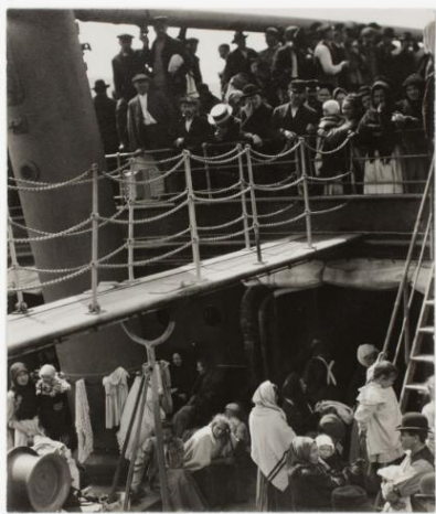
Slika 4. Alfred Stieglitz - The Steerage URL: https://bit.ly/3wVAFxx

Zahvaljujući Alfredu Stieglitzu, čiji je rad odjeknuo vrlo daleko te njegovoj fotografiji The Steerage iz 1907. godine, piktorializam se proširio Amerikom.