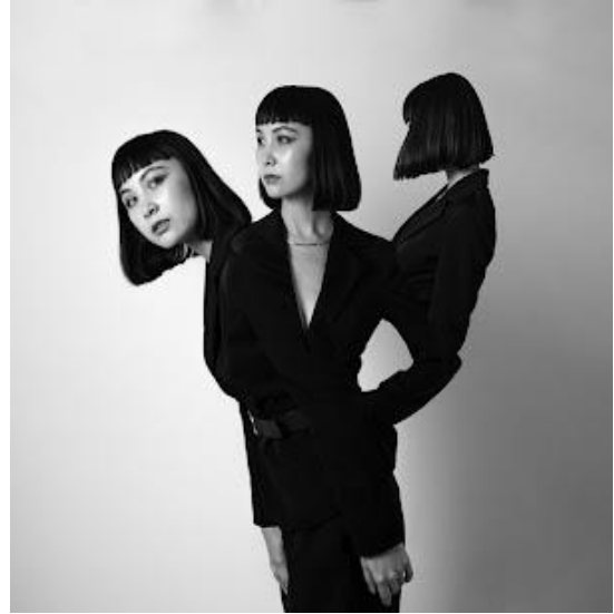
Slika 6. RED Dao „Summer Sun - Gesture 1”