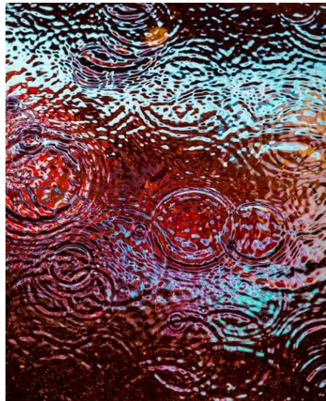
Slika 8. Dave Krugman „DRIP #380”