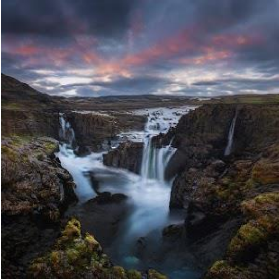
Slika 5. The Metascapes „Metascapes #398”