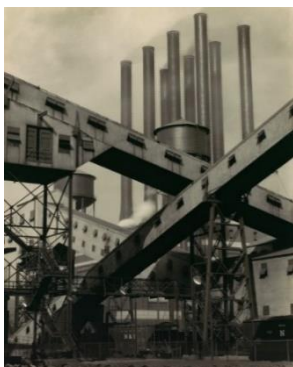
Slika 2. Criss-Crossed Conveyors, River Rouge Plant, Ford Motor Company by Charles Sheeler, 1927 URL: https://bit.ly/3KNsARp

Poznati američki slikar, rođen 1883. godine u Philadelphiji, početkom tridesetih godina svog života odlučio se okrenuti nečemu novome i ozbiljno početi baviti fotografijom. Tijekom 1920-ih godina njegov rad postajao je sve više prepoznatljiv. Primjer toga je njegov rad za tvrtku Ford Motor Company (Ford) koja ga je zaposlila da fotografira njihov River Rouge industrijski kompleks. Sheeler „u prvi plan stavlja formu, liniju, dinamizam i ritam gigantskih presa, dimnjaka, motora ili pokretnih traka.“ 7