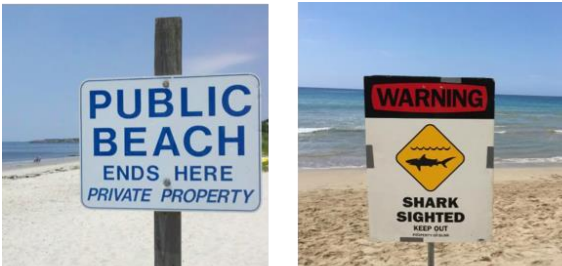
Slika 1. Primjer prenošenja poruke biheviorističkom komunikacijom

Cambridge Analytica u tome je trenutku imala podatke s kojima su mogli doći do velikog broja korisnika Facebooka, ali da bi te podatke iskoristili u korist političke kampanje, bila je potrebna strategija koja je uz analitiku podataka uključivala i biheviorističku znanost te inovativnu oglasnu tehnologiju. Rathi (2019) objašnjava da bihevioristička znanost proučava odnose u ponašanju i djelovanju ljudi ili životinja. Krajnji cilj Cambridge Analytice, pri vođenju političkih kampanja, bio je uvjeriti korisnike Facebooka da glasaju za svog klijenta, što je, objašnjava Rathi (2019), uključivalo prikazivanje oglasa koji bi najvjerojatnije rezultirali promjenom ponašanja kod korisnika. Rathi (2019) je naveo i primjer koji je preuzeo iz prezentacije Alexandra Nixa na Concordia summitu 2016. godine. Primjer na slici br. 1 ilustrira biheviorističku komunikaciju, odnosno važnost vođenja znanosti o ponašanju na um čovjeka prilikom prenošenja poruka. Nix (2016) objašnjava da kada bi čovjek šetajući plažom vidio dva znaka kao na slici 1., znak s lijeve strane bi možda potaknuo čovjeka da se okrene, dok bi znak s desne strane imao daleko jači utjecaj da to učinimo.