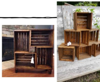
Slika V. Powerpoint prezentacija o scenografiji