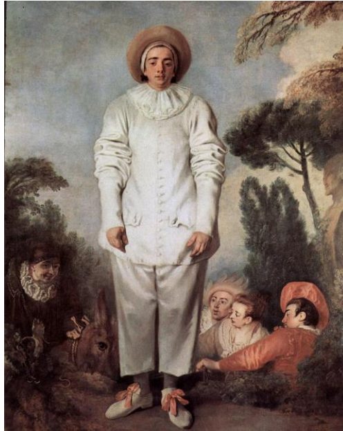
Slika I. Jean-Antoine Watteau: Pierrot, dit autrefois Gilles , 1718. 2