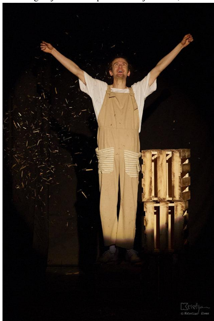
Slika XVI .fotografija s izvedbe predstave Bijeli klaun; Dječak