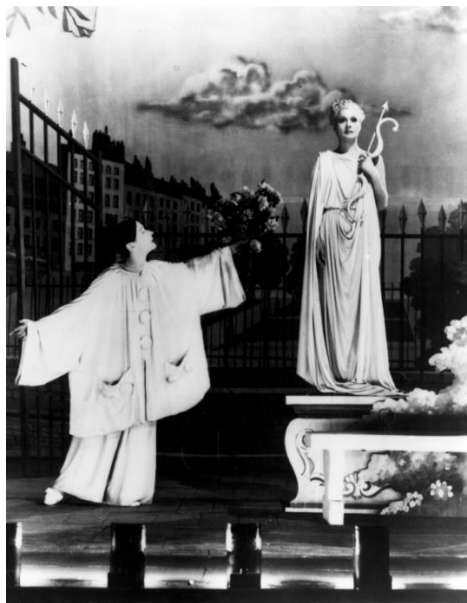
Slika II. Film Les Enfants du paradis , Pierrot, 1945. 3