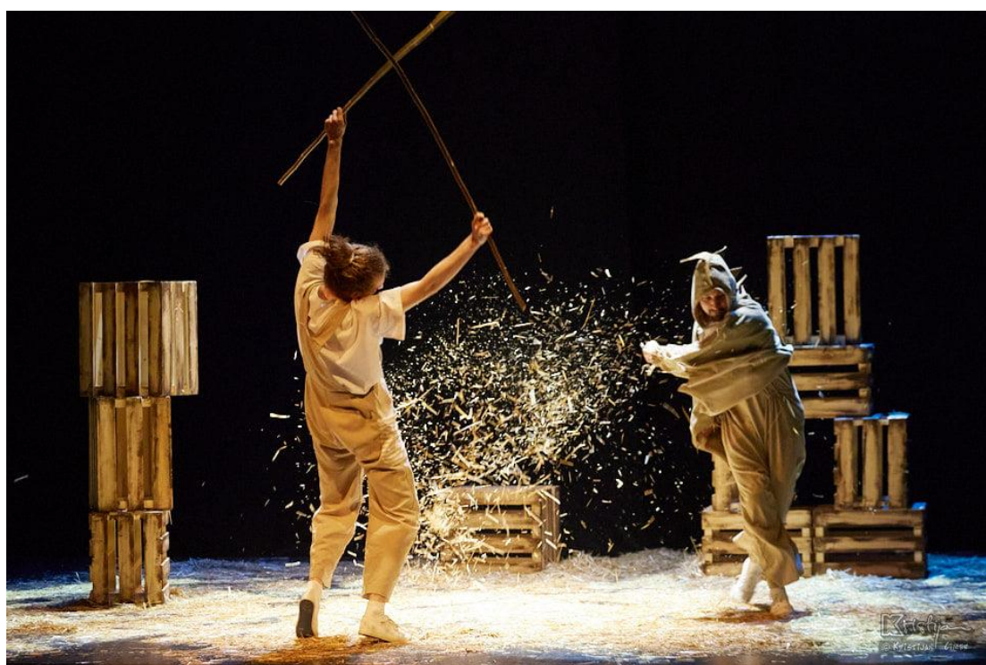
Slika XIII. fotografija s izvedbe predstave Bijeli klaun; Dječak i Zmaj