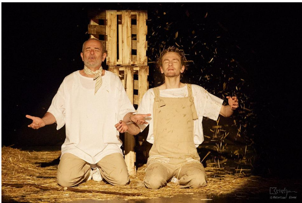
Slika XII. fotografija s izvedbe predstave Bijeli klaun; Starac i Dječak