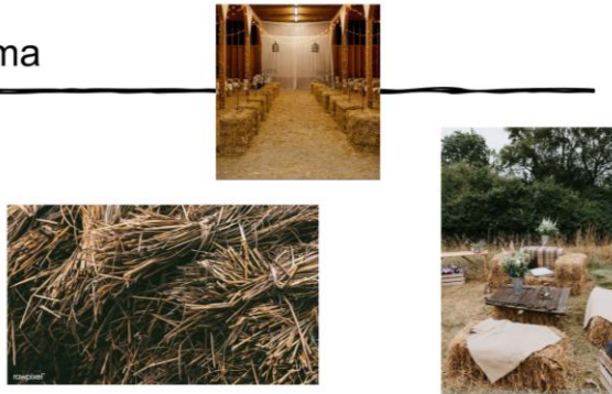
Slika VI. Powerpoint prezentacija o scenografiji

Što se kostima tiče, Lorna je prepuštena potpuna sloboda za prvo istraživanje, a jedina uputa bila je se ne služimo bojama, odnosno da se služimo monokromnim bojama kako bismo najbliže dočarale Dječakovu drugačijost . S toga se Lorna dobro dosjetila lana kao prirodnog materijala za kostime i predložila forme koje su svojim oblikom podsjećale na cirkuske kostime. Svi likovi osim Zmaja imali su kombinaciju s bijelom tkaninom (ili u obliku majice, ili u obliku volana), čime je on suptilno odvojen od „stvarnog svijeta”. Također, kao obuća korištene su tenisice Startas u sličnim nijansama, kako bi glumcima omogućivale vješt i brz pokret. Lorna je također obratila pažnju na važne i interesantne detalje kao što su gumice za kosu, čarape, marame i slično. Cijela likovnost predstave, iako naizgled u sličnim nijansama, odiše upravo jedinstvenošću i uviđamo njezinu drugačijost .