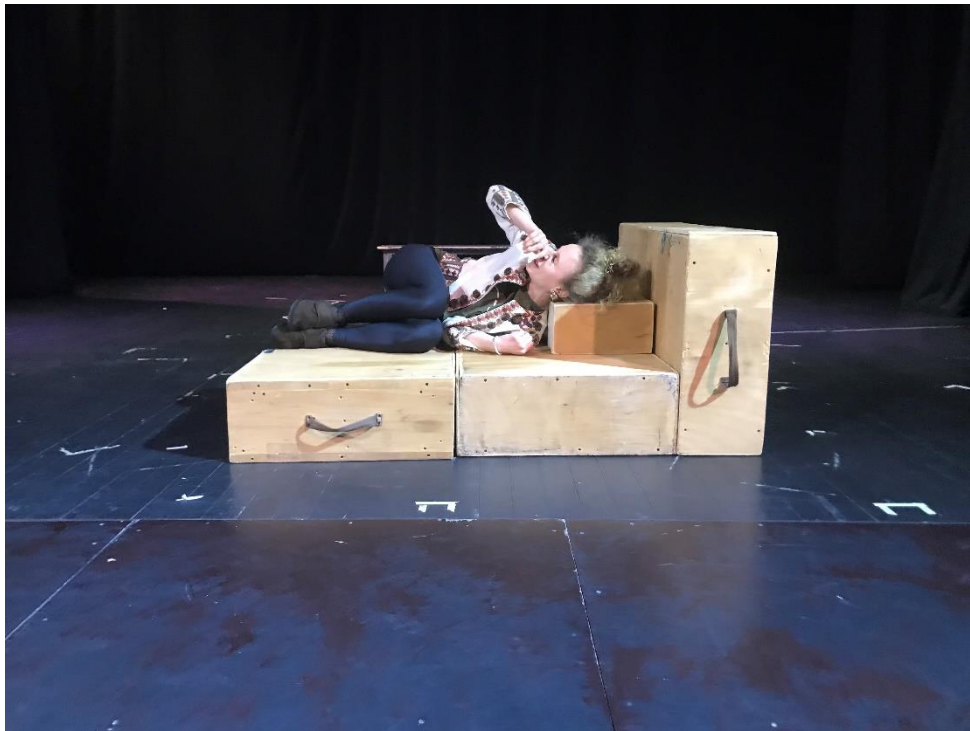
Slika VIII. improvizacija s kutijama