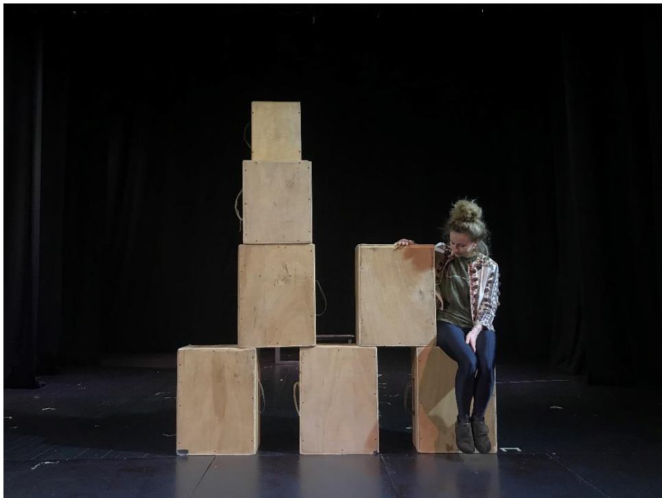
Slika VII. improvizacija s kutijama

Nadalje, na samom kraju predstave svaki lik u svojoj zadnjoj sceni uzima svoje dvije kutije (dva kofera) kada odlazi iz dječakovog života jer ti tereti i ti negativni osjećaji nisu njegovi i nisu dio njegove drugačijosti , već mu ih je nametnulo društvo. Njegov prostor je čist, prepun slame (pozitive), očišćen od teških kutija i negativnih konotacija vezanih uz njegovu drugačijost .