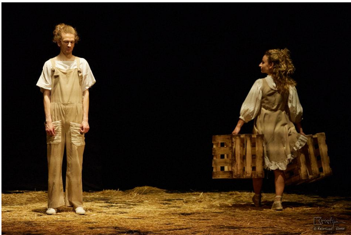
Slika XVII. fotografija s izvedbe predstave Bijeli klaun, Dječak i Gita