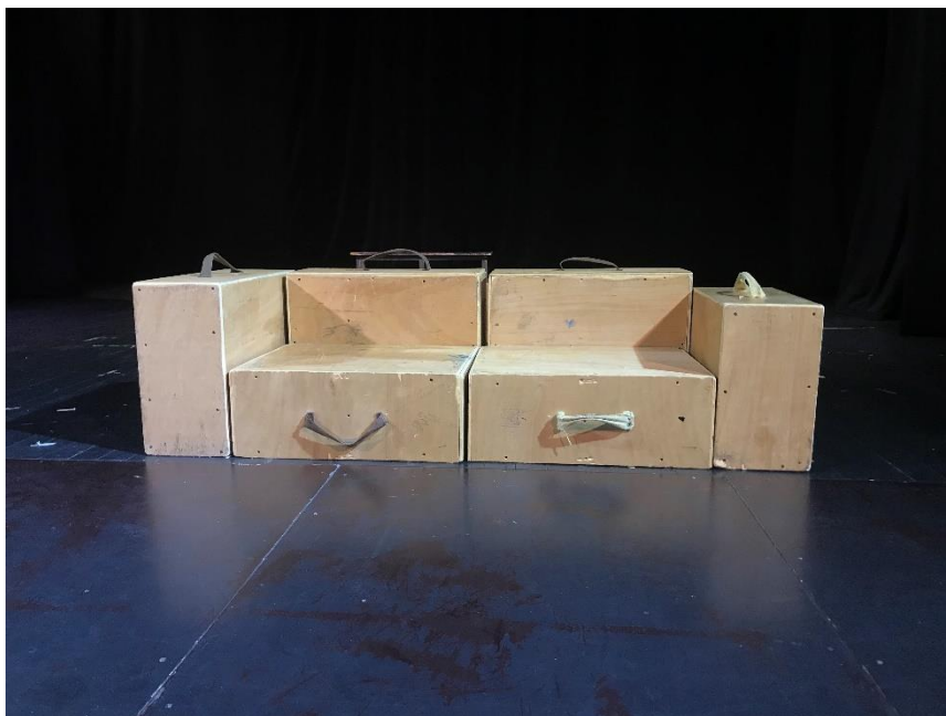
Slika IX. improvizacija s kutijama