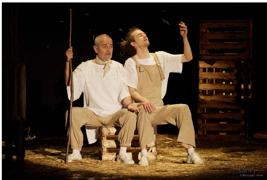
Slika XV. fotografija s izvedbe predstave Bijeli klaun, Starac i Dječak