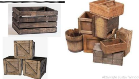
Slika IV. Slide iz powerpoint prezentacije o scenografiji