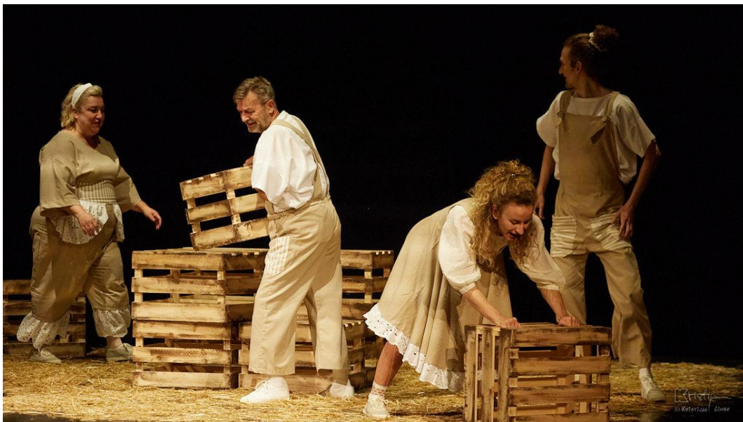
Slika XI. fotografija s izvedbe predstave Bijeli klaun; Mama, Tata, Gita i Dječak

svijeta, kao što se to događalo Dječaku, unutar toga važno je pronaći snagu. Upravo s kutijama pokušala sam dočarati koliko zastrašujuće i teško to može biti, a slama je služila kao taj trenutak prihvaćanja svoje drugáčijosti i koliko to može zapravo biti lijepo. Shvatila sam ljepotu drugáčijosti , ljepotu jedinstvenosti i da jedino iz nje kao takve možemo iskreno stvarati i raditi. Iako kroz proces u nekim trenutcima nisam bila sigurna što dalje, nisam znala što raditi, bila sam iskrena prema glumcima te smo zajedno došli do rješenja. Osim prihvaćanja vlastite jedinstvenosti i drugáčijosti shvatila sam važnost timskog rada, shvatila sam koliko jedno ide uz drugo, a isto tako i to da se međusobno ne umanjuju. Iako trebamo težiti prihvaćanju i spoznaji vlastite drugáčijosti , vlastite individualnosti, jer nas čini jedinstvenima, kroz ovaj proces shvatila sam da ona poprima posebnu nijansu kada se ujedini s tuđim drugáčijostima . Iako Dječak na samom kraju predstave ostaje sam sa sobom i na takav način spoznaje svoju drugáčijost , jedinstvenost, boju, ja na kraju procesa za razliku od njega nisam ostala sama, već sam obogatila svoju paletu boja upravo nijansama ljudi s kojima sam radila.