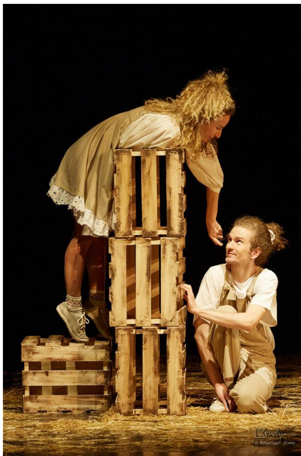
Slika XVI. fotografija s izvedbe predstave Bijeli klaun; Dječak i Gita