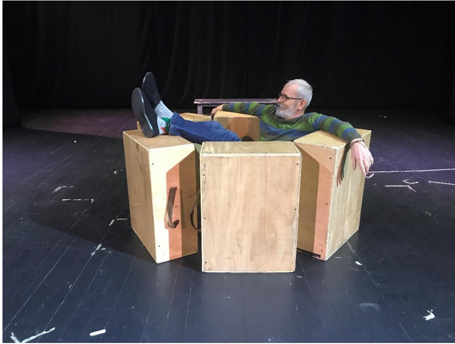
Slika X. improvizacija s kutijama

Nadalje, jedan od problema koji se javio kroz proces bio je i lik Zmaja i njegov značaj za predstavu. Iako je u ideji Zmaj Dječakova podsvijest, a s obzirom na to da se Dječak direktno obraća publici kada ima unutarnje monologe, Zmajeva se važnost umanjuje. Na taj problem naišli smo pred kraj samog procesa, kada je sve krenulo poprimati oblik smislene cjeline. U razgovoru i razmatranju različitih opcija, odlučili smo ostaviti Zmaja u predstavi, ali izmijeniti njegovo prvobitno značenje, zbog čega smo ujedno malo promijenili scene u kojima on sudjeluje. Zmaj više nije bio Dječakova podsvijest kao takva, već je više bio u službi negiranja njegova napretka, kao i njegovo sigurno mjesto unutar kojeg se Dječak mogao sakriti noć prije nastupa. Zmaj mu zapravo daje hrabrost da se suoči s nastupom te mu otkriva da ne mora biti veseli klaun kao njegovi roditelji, nego da prigrli svoju drugačijost . Zmaj je tako i surova realnost unutar snova i mašte, što je još jedan paradoks. Zmaj prvi uzima kutije i odlazi iz Dječakova života, što je simbol Dječakova rasta jer mu više ne treba to sigurno mjesto unutar snova i mašte, već ga kreće graditi u realnom svijetu.