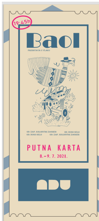
Slika 2: Karta za predstavu

Iako smo predstavu osmišljavali zajedno, projekt je inicijalno osmislila kolegica Katarina Krešić. Baol joj je bio završni ispit produkcije na trećoj godini na Akademiji dramske umjetnosti u Zagrebu. Maštala je o Baolu koji svoje pustolovine doživljava u Hrvatskoj, u vlaku za Dugo Selo. Poslala je pismo Hrvatskim željeznicama: „Baol. je autorski izvedbeni projekt koji će se izvoditi u putničkom vlaku, za redovne putnike u prigradskom prijevozu. Ovdijat će se na relaciji Zapadni kolodvor (Zagreb) – Dugo Selo – Glavni kolodvor (Zagreb). Projekt je motiviran romanom Baol. Mirna noć režimska autora Stefano Bennija, a razvija se autorskim i izvođačkim timom sa željom istraživanja vlastitog izričaja u komunikaciji sa specifičnom publikom.