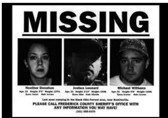
Izvor 3. www.thefilmagazine.com

se ‘dobar se glas daleko čuje’ . Format poruke koja se šalje metodom viralnog marketinga obično je prilagođen neformalnoj komunikaciji na online mjestima masovnog okupljanja korisnika.