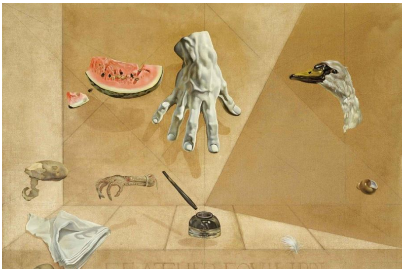
Prilog 11. Salvador Dali/ Internet.

Salvador Dali, španjolski slikar, jedan od najpoznatijih predstavnika nadrealizma u slikarstvu, autor poznat po svojim snažnim, bizarnim slikama, inspiracija je za prostorno uređenje i scenografiju. Prvobitno zamišljena scenografija bila je slična slici u prilogu; glave lutke koje vise i sa stropa, kao i drugi rekviziti potrebni u izvedbi predstave (šlag, ruž za usne, ručnik, voda, kapica za bogomoljku, haljina balerine). Scenografija je na kraju jednostavnije postavljena, s obzirom na mogućnosti prostora u kojem smo isprobavali, a imajući na umu i prostor izvedbe diplomske predstave.