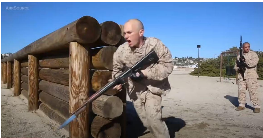
Prilog 5. Making Marines – 12 Weeks of United States Marine Corps Recruit Training , YOUTUBE.

Naslov pjesme „Your body is a battleground” inspiriran je radom Barbare Kruger 14 , a inspiracija za glazbenu podlogu je popularna melodija koju je Discovery Channel izbacio 2008. (kasnije ju je obradio 2020. op.a) „The World Is Just Awesome (Boom De Yada)” 15 .