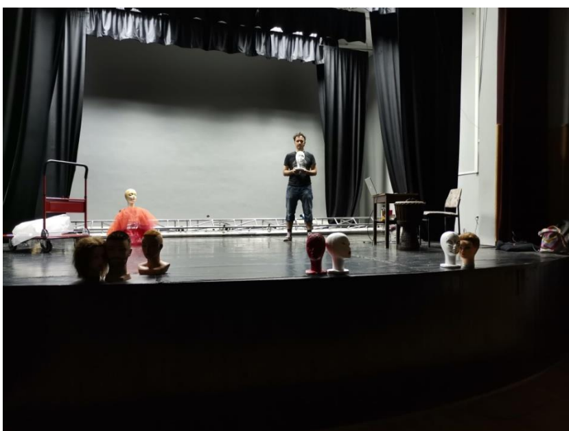
Prilog 15. Detalj s probe, scenografsko rješenje

Inspiraciju za scenografiju potražili smo u slici Salvadora Dalija (vidi prilog 11.), a njihovim pozicioniranjem na različita mjesta u prostoru pokušava se dočarati nadrealnost i začudnost prostora u kojem se izvođači nalaze, a to je prostor snova.