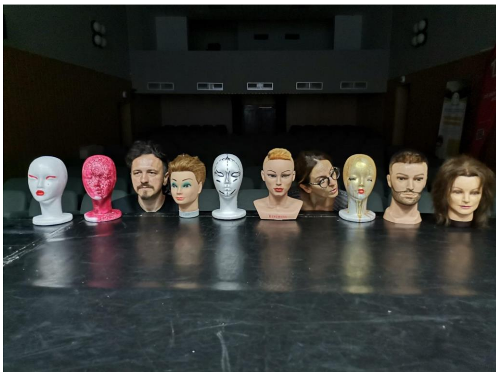
Prilog 16. Detalj s probe

Lik Programera je izrežiran, njegov je zadatak programirati. Na sceni smo odlučili zadržati prijateljski odnos, igru dvaju likova, bez ulaska u njihov dublji emotivni ili psihološki razvoj, iako se u čitanju scena ponegdje može naslutiti potencijalni razvoj odnosa. Ana i Bojan i u stvarnom i izvedbenom životu su prijatelji i tu ostajemo vjerni interpretaciji svakodnevice (zbilje), vjerno je prenoseći u umjetničku izvedbu, ništa ne dodajući.