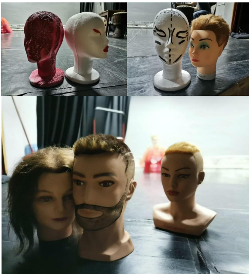
Prilog 12., 13., 14. Glave/ detalji s probe/ Foto: privatna arhiva

Inspiraciju za scenografiju potražili smo u slici Salvadora Dalija (vidi prilog 11.), a njihovim pozicioniranjem na različita mjesta u prostoru pokušava se dočarati nadrealnost i začudnost prostora u kojem se izvođači nalaze, a to je prostor snova.