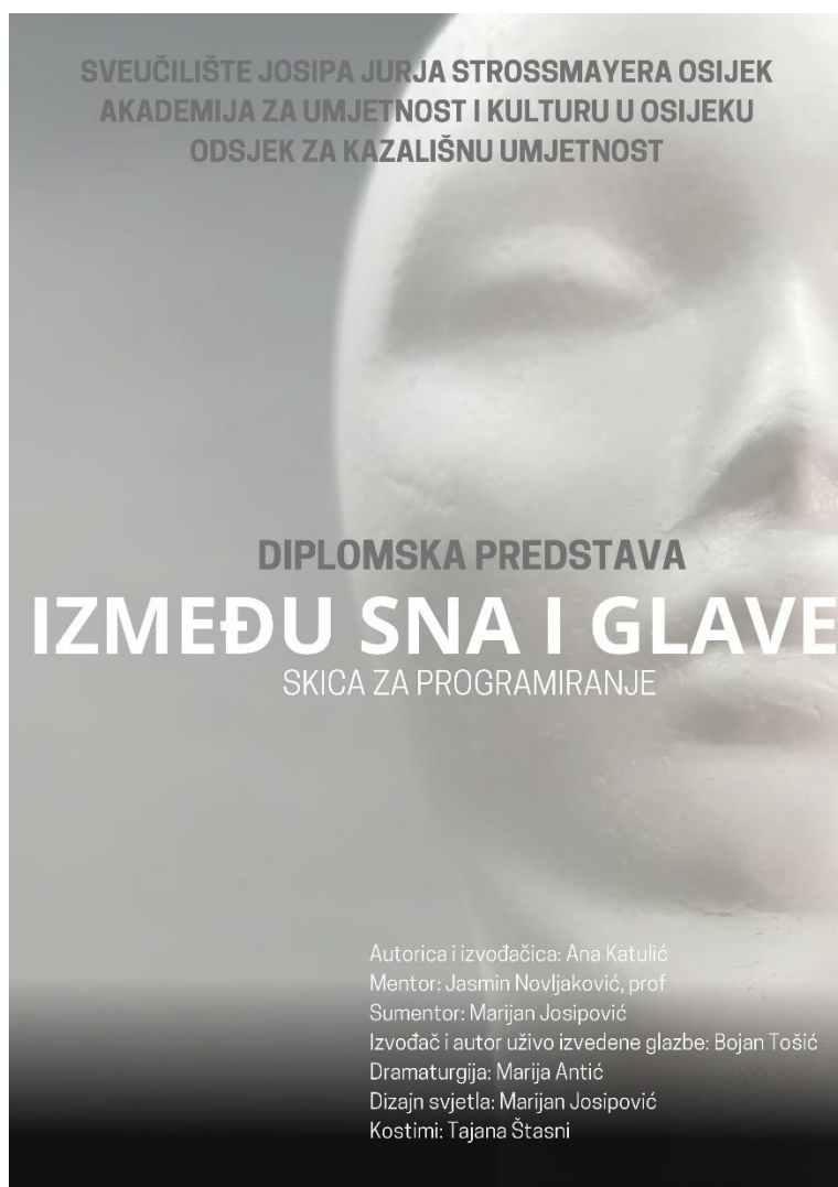
Prilog 17. Vizual predstave/ Izradila: Ana Katulić.

Pripremni rad na predstavi započeo je početkom godine, prvim promišljanjima i prikupljanjem materijala. Konkretni kreativni rad, s materijalom u prostoru i na sceni, ukupno je trajao oko mjesec i pol dana. Održano je 20-tak pripremnih proba i sastanaka za rad na materijalu, skriptiranje, stavljanje materijala u prostor. U dva intenzivna tjedna zajedničkog rada uvježbana je predstava.