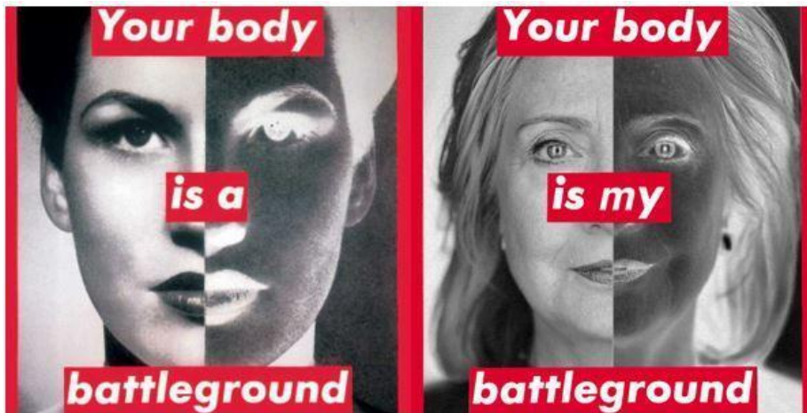
Prilog 6. https://www.artsy.net/artist/barbara-kruger