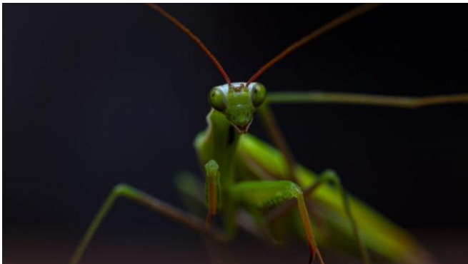
Prilog 7. Fotografija bogomoljke.

Scena dekapitacije scena je prije samog kraja predstave, napravljena u koreografiji afričkog ritualnog plesa, a o čemu više pišem u poglavlju „Transkulturalni elementi izvedbe”(vidi str. 25.).