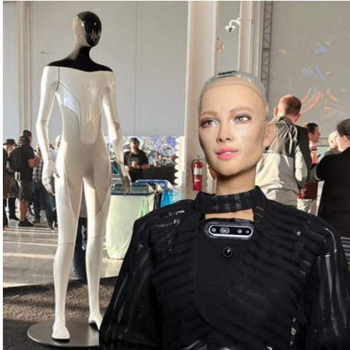
Prilog 8. i 9. Sophia the Robot

Ono što Sophia još nije dosegla je da njen procesor u potpunosti simulira ljudski mozak, naše mentalne procese, što je cilj umjetne inteligencije (AI). Iako smo u procesu istraživanja prikupili materijal koji je ona proizvela (misli, rečenice, umjetnička djela, slike, fotografije), navedeni materijal nije postao dio izvedbe, već je lik Sophie u konačnici služio samo kao inspiracija.