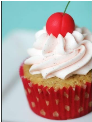
Prilog 3. Vizual slatkog užitka, kolačića

Jezik užitka ispitujemo u nekoliko segmenata, a najpoznatiji među njima je „slatki” užitak;slastice, kolači, čokolada, šećer. Šećer je i seksualni drive 13 , libido, energija koja nas podiže ili pokreće. Od nekolicine slatkiša koje promišljam, u konačni scenarij predstave uvrštavam palačinke i šlag.