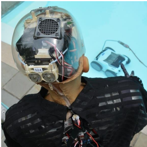
Prilog 9. Isto.

Ono što Sophia još nije dosegla je da njen procesor u potpunosti simulira ljudski mozak, naše mentalne procese, što je cilj umjetne inteligencije (AI). Iako smo u procesu istraživanja prikupili materijal koji je ona proizvela (misli, rečenice, umjetnička djela, slike, fotografije), navedeni materijal nije postao dio izvedbe, već je lik Sophie u konačnici služio samo kao inspiracija.