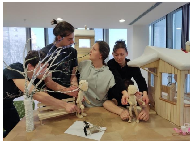
Slika 2. Prvo postavljanje scena

Sljedeći korak u radu je bio „upoznavanje“ s lutkom. „Na lutkarskoj sceni se susreću dva tvorca scenskog lika, glumac i kipar, predstavnik kazališne i predstavnik likovne umjetnosti, dinamika glumačke i statika likovne umjetnosti, s jedne strane biće koje se ne može očitovati izvan vremena, s druge strane biće na koje vrijeme ne utječe.“ 8 Zanimljiv mi se učinio navedeni citat za početak opisa svog rada s lutkom jer me je navodio na preispitivanje odnosa u suradnji: