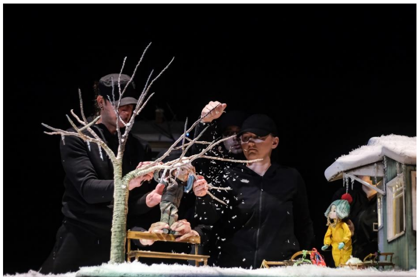
Slika 4. Petrovo divljanje po prostoru

Vrlo lijepo je ovaj monolog napisan, ali...već pri prvim čitanjima teksta zapitao sam se kako ćemo to prikazati. Kako dočarati taj divljački ples nečega što je unutar osobe, zime i proljeća. U početku mi je bilo nejasno što su uopće ta zima i proljeće u čovjeku na koje autorica