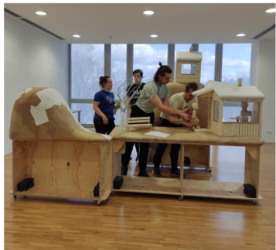
Slika 1. Prve probe

Sva tri navedena scenografska elementa upotpunjuju doživljaj brdovitog zimskog zavičaja, idealnog za zimske radosti i time su nam uvelike pomogli u dočaravanju tog bajkovitog krajolika. Scenografija je pametno osmišljena i funkcionalna te smo ju uspješno u potpunosti iskoristiti u scenamapa je, uz to opisivanje i oponašanje ambijenta, kako govori Mrkšić, dobila i još jednu funkciju. Najviše nam je koristila u animaciji lika Zime. Njenu potragu za proljećem napravili smo kroz animaciju prostora i scenografije. Kako je Zima lik koji je stalno prisutan, a