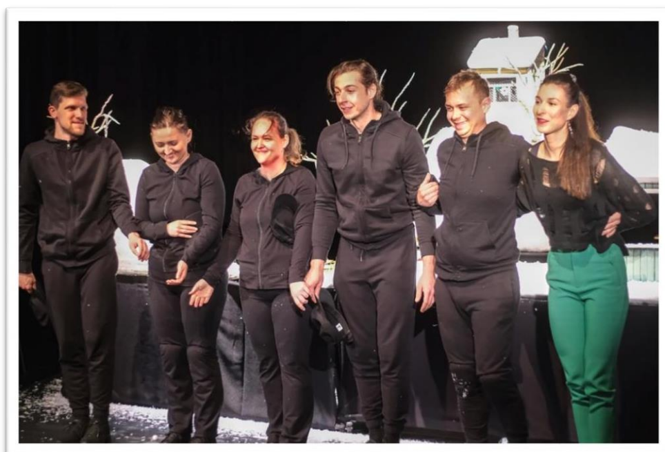
Slika 2 Glumci i redateljica nakon premijere