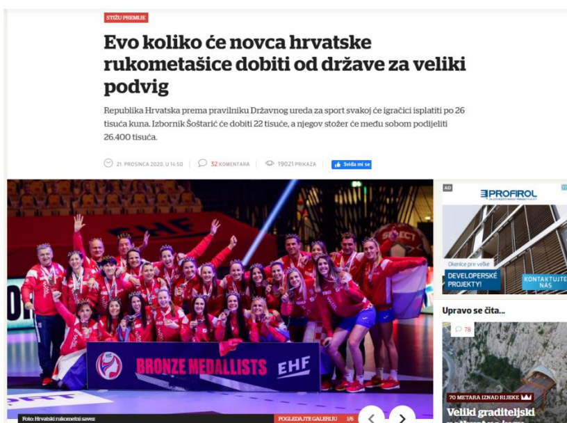
Slika 4. Primjer naslova u medijima