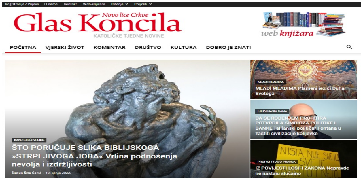
Slika 1. Naslovnica internetskog portala Glasa Koncila

Hrvata te neslužbeno iz evanđeoskih i crkveno-povijesnih nadahnuća komentira tekuća pitanja crkvenog, nacionalnog i društvenog života” ( Glas Koncila , 2022). Naslovnica njegova internetskog portala prikazana je na slici 1.