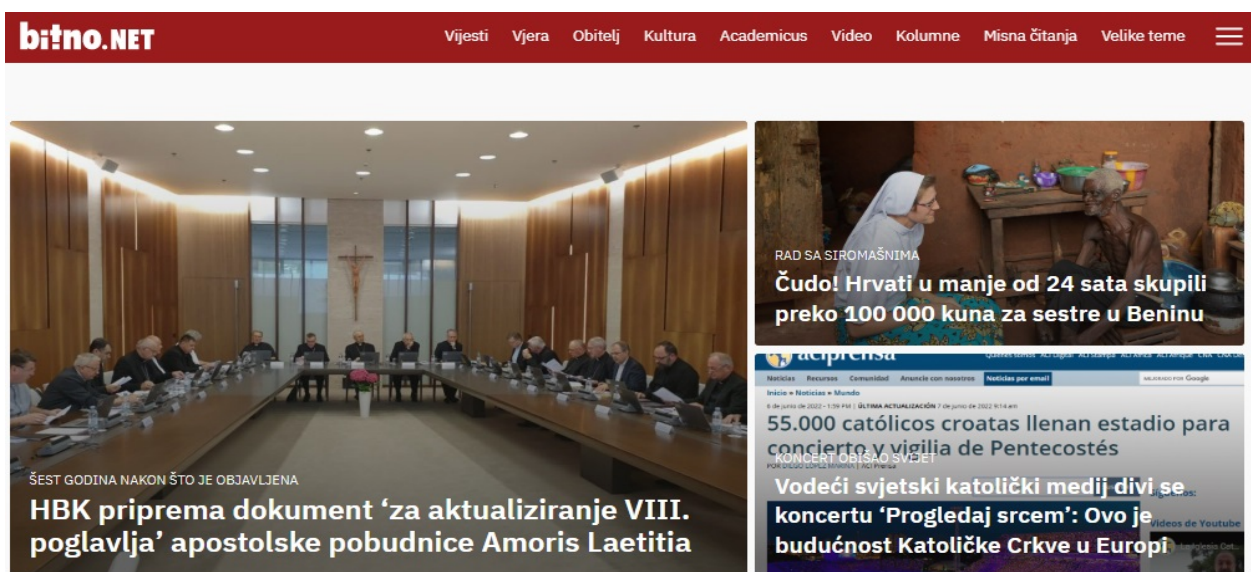
Slika 3. Naslovnica internetskog portala Bitno.net

U konačnici, kršćanska medijska platforma koja svoje sadržaje objavljuje isključivo digitalnim putem internetski je portal naziva Bitno.net . Radalj (2018: 150) navodi kako je riječ o jedinstvenom mediju širih i raznolikijih sadržaja od uobičajenih vjerskih portala, ali ujedno ispunjenom i dubljim i usmjerenijim informiranjem čak i u odnosu na opće informativne portale. Navedeni je medij primarno osnovan u svrhu svakodnevnog ostvarivanja internetskog izvorišta aktualnih informacija vezanih uz kršćansku religiju, pa tako na njemu rade ne samo novinari, žž nego i priznati domaći te inozemni znanstvenici i stručnjaci. Sadržaj je portala konačno temeljen na brojnim rubrikama kao što su Vijesti , Vjera , Obitelj , Kultura , Academicus , Video , Kolumne , Misna čitanja i Velike teme , stoga svaki čitatelj može pronaći svoje interese u pojedinoj kategoriji, odnosno u onoj rubrici koja ga je najviše privukla, čak i ako nije nužno katolik. Njegova je naslovnica prikazana na slici 3.