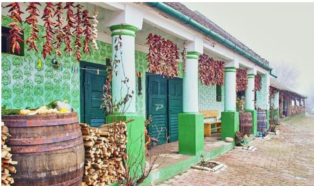
Slika 7. Arhitektura u Karancu

Španjolske, no ustvari se radi o tradicionalnim panonskim kućama koje su se gradile u razdoblju Austro-Ugarske Monarhije. Uzduž ovakve građevina nalazi se karakteristični trijem koji je u prošlosti omogućio nesmetane radove bez obzira na vremenske neprilike, a uz to su trijemski lukovi pružali zaštitu od sunca (putovnica.net/Karanac). Na slici 7. je moguće vidjeti prikaz arhitekture.