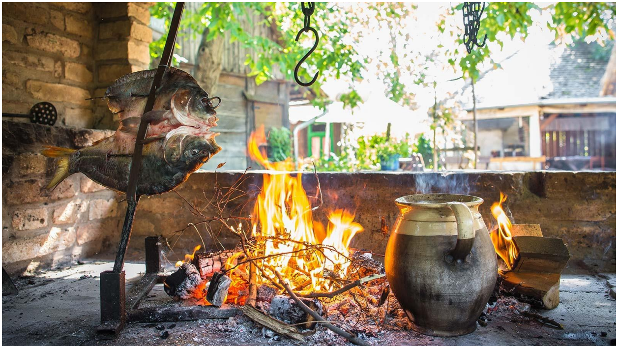
Slika 8. Gastronomija Karanca

Najpopularnije mjesto za isprobati autentičnu hranu Baranjska je kuća ( topdestinacije.hr / Etnoselo Karanac turistička destinacija u srcu Baranje). Etnorestoran Baranjska kuća obiteljski je restoran koji nudi autentične recepte poput puževa u umaku od kopriava i pečenog bagremovog cvijeta, grah gulaš u zemljanom loncu te klasični baranjski specijaliteti kao što su čobanac, šaran na rašljama i sl. Godine 2013. restoran je izabran za najbolji restoran Osječko-baranjske županije, a 2013. je dobio je svoje mjesto na listi top 100 restorana u Hrvatskoj ( baranjska-kuca.com / Restoran). Primjer gastronomije prikazuje slika 8.