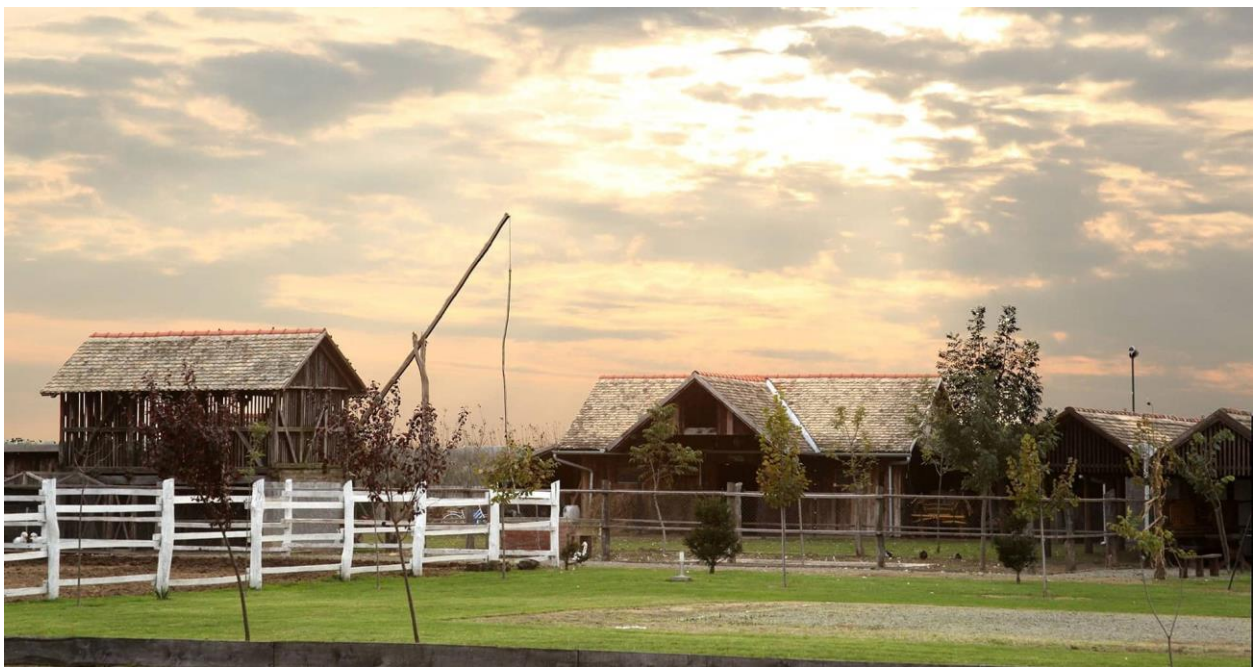
Slika 1. Acin Salaš