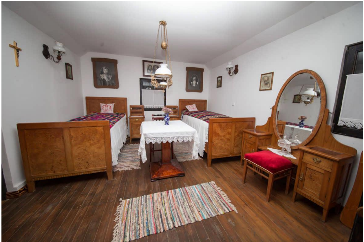
Slika 6. Bakina soba

Posebna soba koja se ističe naziva se „Bakina soba“. Sve sobe imaju poseban ulaz, kupaonicu i besplatni WiFi (Acin Salaš - službena stranica / Sobe). Bakinu sobu prikazuje slika broj 6.