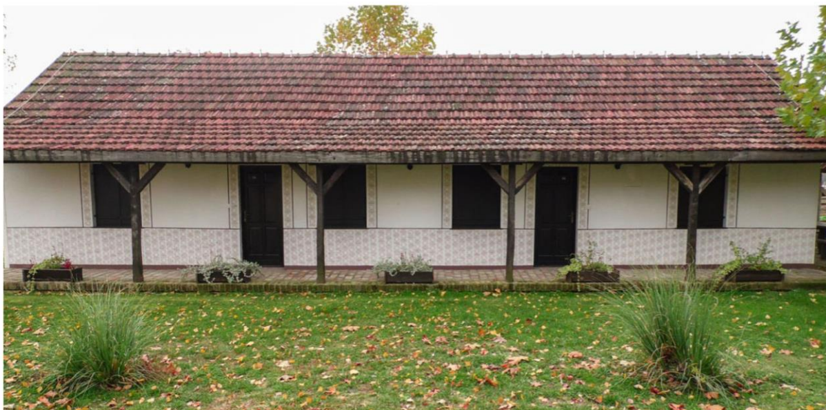
Slika 5. Primjer četverokrevetne sobe