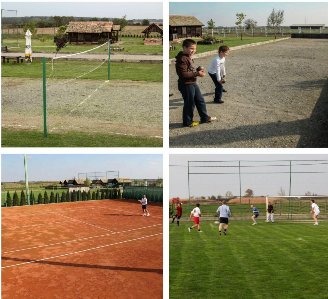
Slika 3. Aktivnosti na salašu_sport

U sklopu salaša moguće je vidjeti čardake, ambare, svinjce, konjske štale, ovčarnik, đeram i pušnice. Na salašu se također nalaze tereni za različite sportove poput tenisa, nogometa, odbojke i boćanje što prikazuje slika broj tri.