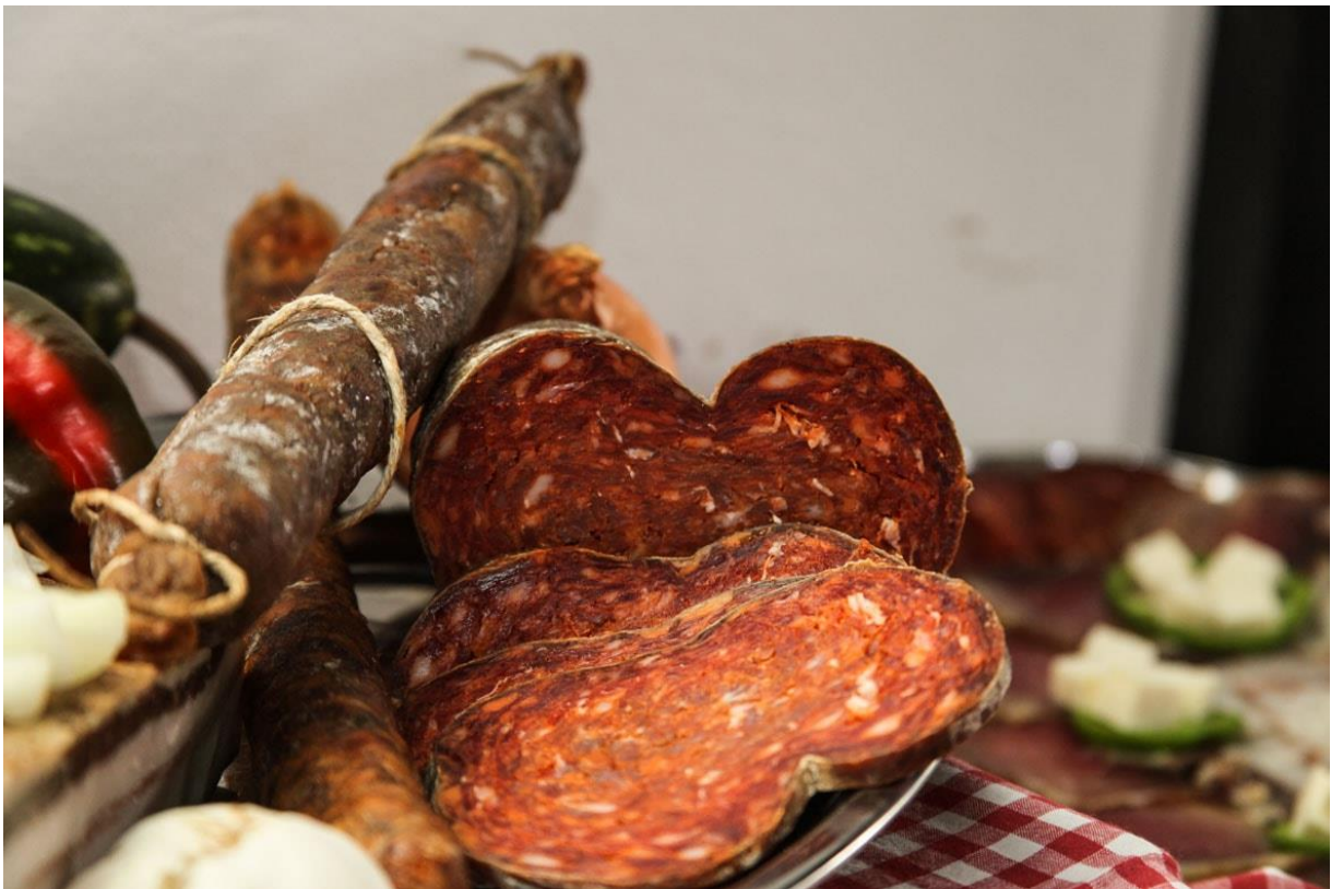
Slika 2. Gastronomija Acinog Salaša

Posjetitelji Acinog Salaša mogu se okušati u tradicionalnim aktivnostima poput svinjokolje, pečenja rakije i sl. Salaš također ima restoran koji u svojoj unutrašnjosti prima 70-ero ljudi, a uz terasu restorana broj ljudi koji se može primiti je 250. Jela se pripremaju u starim krušnim pećicama na tradicionalan način, a moguće je okusiti vina te rakiju šljivovicu. Ono što se izdvaja iz tradicionalne gastronomije masni je kruh, čvarnjače, kiflice, švargl, krvavica, čvarci, kulen, kobasica, šunka, slanina od domaće crne slavnoske svinje, šokačka kokošja juha, juha od rajčice, kisela čorba, čobanac te fiš paprikaš (topdestinacije.hr / Acin Salaš tradicionalno šokačko imanje u Tordincima). Slika 2. prikazuje gastronomiju Acinog Salaša.