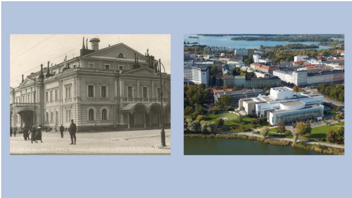
Slika 2. Kazalište Alexander i nova zgrada Finske nacionalne Opere i Baleta u Helsinkiju

Fotografija prikazuje staro kazalište Finske opere i baleta Alexander 1919. te novu zgradu u koju je preselila 1993. godine.