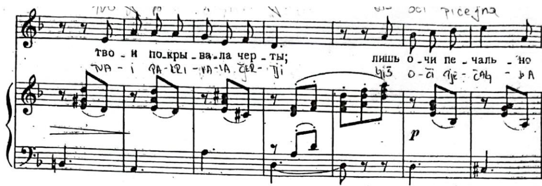
Primjer 25: Taktovi 21–27