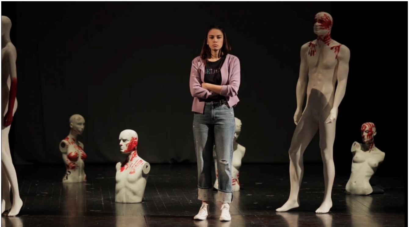
Slika 5. Lutke