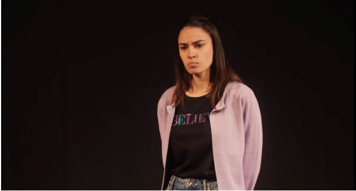
Slika 8. Believe majica

bile su mi ili predječe ili preodrasle. Shvatila sam koliko sam ostarila jer nisam znala što današnja djeca, odnosno mladi ljudi nose. Odlučila sam se za crnu majicu s ljubičastim printom na kojoj piše Believe , činilo se prikladno, savršena doza tinejdžerske dubokoumnosti.