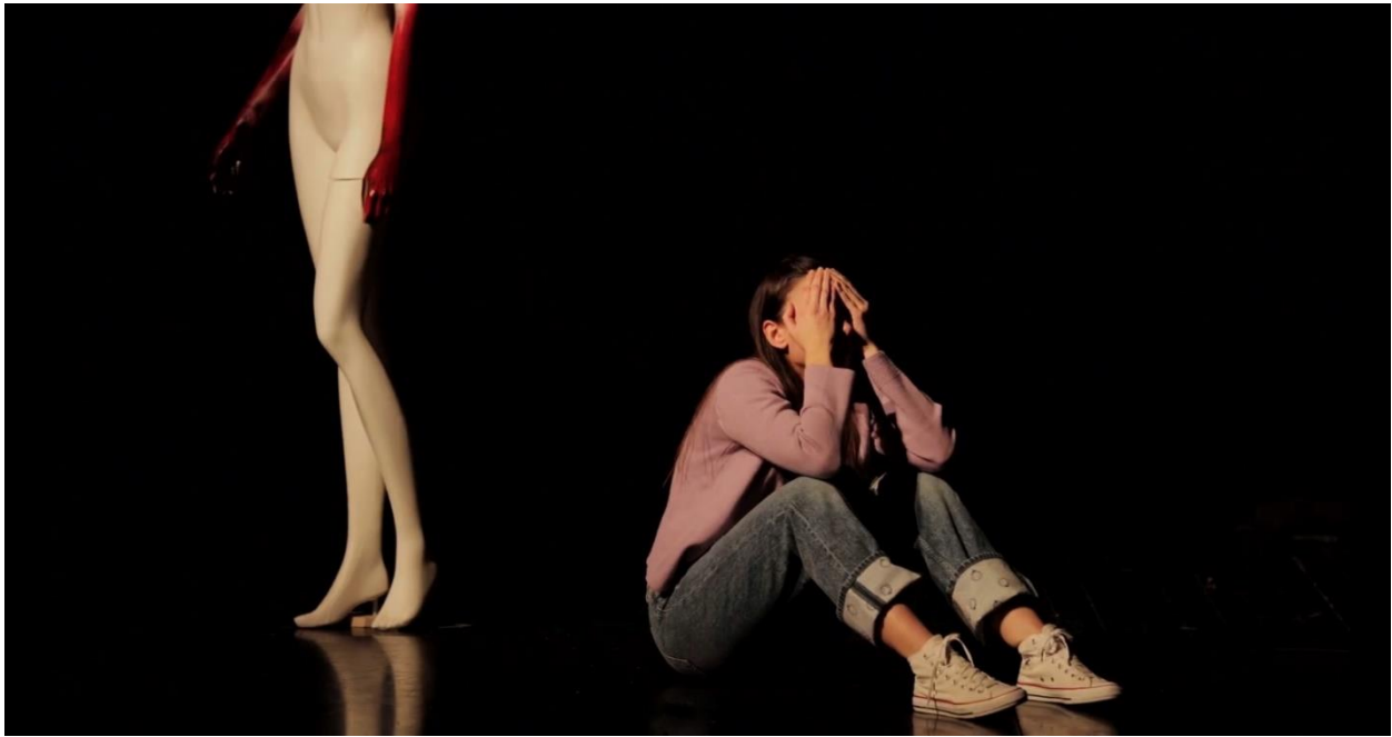
Slika 2. Mučnina

U ovakvim je komadima lako otići u patetiku što nipošto nisam htjela. Lako je izdramatizirati sve što se Luciji događa i to tako igrati. To zapravo ne bi bilo ni točno jer bi to bilo viđenje nekoga sa strane tko gleda Lucijin život, ona te stvari sigurno više ne doživljava tako. Postale su joj toliko normalne da ih priča kao nešto sasvim uobičajeno. To se često događa sa žrtvama nasilja koje svoje priče pričaju s nevjerojatnim odmakom koji ledi krv u žilama. Lucijin slučaj nije toliko