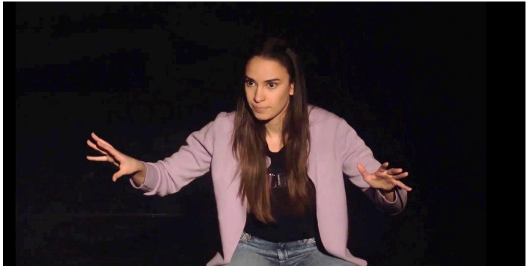
Slika 4. Plan

Kako bih bolje razumjela arhetip štreberice potražila sam neke druge likove koji dijele slične osobine i karakteristike.