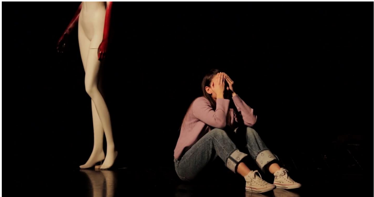
Slika 2. Mučnina