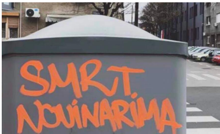
35. Grafit „Smrt novinarima“