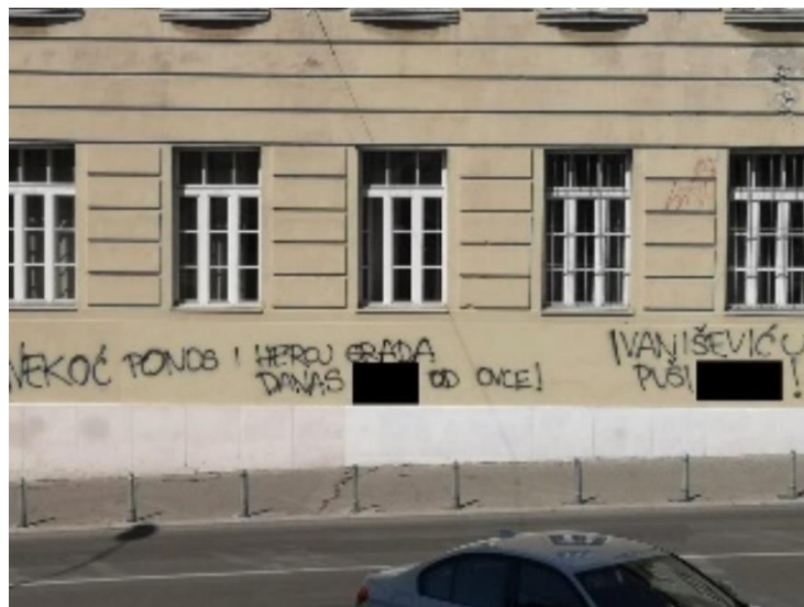
18. Grafit u Splitu