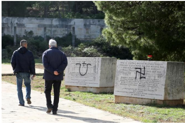
5. Simboli govora mržnje u Večernjem listu

Na prvoj fotografiji (vidi fotografiju 5.) iz Večernjeg lista prikazani su nacistički i ustaški znak na spomenicima. Simboli mogu biti pozitivni ili negativni, mogu karakterizirati sreću ili podsjećati na nastalu štetu na račun čovječanstva. Navedeni znakovi zakonom su zabranjeni jer je utvrđeno kako oni promiču segmente mržnje te je nedopustivo promicati iste, a pogotovo ih crtati na javnim mjestima i na spomenicima. Prošlost treba ostaviti u povijesti i okrenuti se budućnosti kako bi svima nam bilo bolje. Na portalima u ovome slučaju, Večernjeg lista često možemo vidjeti primjere kršenja diskriminacije i govora mržnje koji su postali jedan od najvećih problema današnjice. O takvim temama potrebna je javna debata i konstantno naglašavanje kako se diskriminacijom i u ovom slučaju, simbolima mržnje nikada ništa nije dobro donijelo čovječanstvu i da nikada neće.