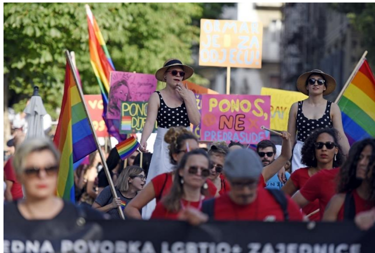
29. Gay pride