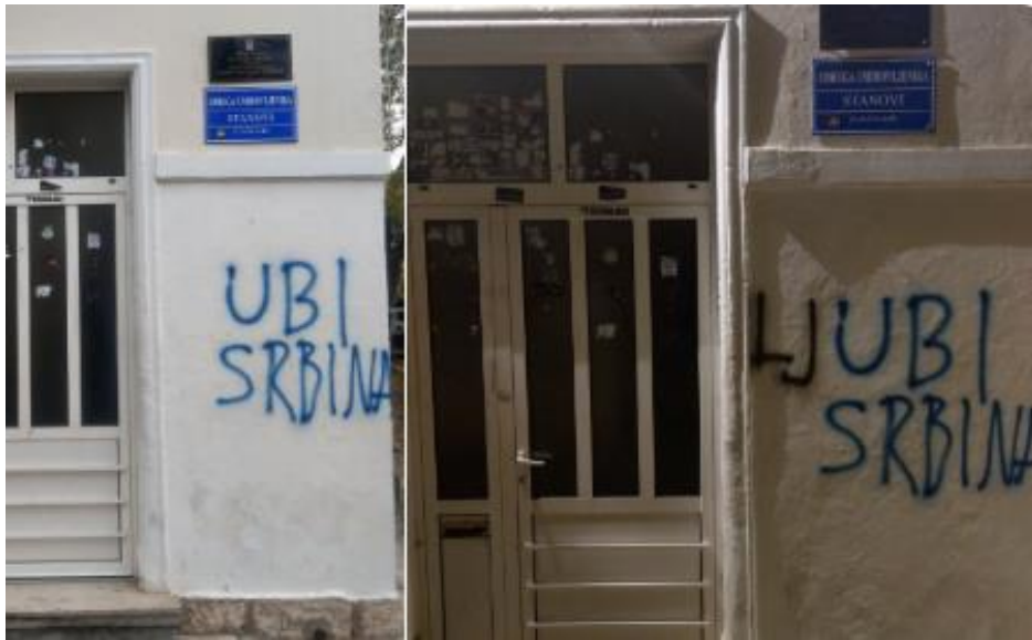
23. Grafit iz „Ubi srbina“ u „Ljubi srbina“