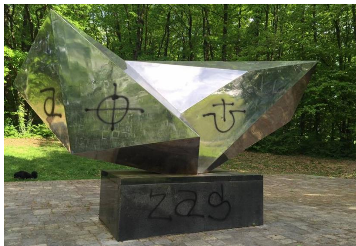
30. Išarani spomenik žrtava fašizma

Prva fotografija ( vidi fotografiju 29.) iz tjednika Nacional prikazuje LGBT zajednicu koje su česta meta diskriminacije i govora mržnja. Zbog niza stereotipa i predrasuda javnost o prikazanima razvija negativan stav bez ikakvih osnova. Mediji su također oni koji, često, upotrebljavaju krivu terminologiju u vezi LGBT zajednica. Terminologija je jasno određena te se nikako ne tolerira upotrebljavanje podrugljivih riječi koji šire segmente stereotipa, predrasuda, diskriminacija i govora mržnje.