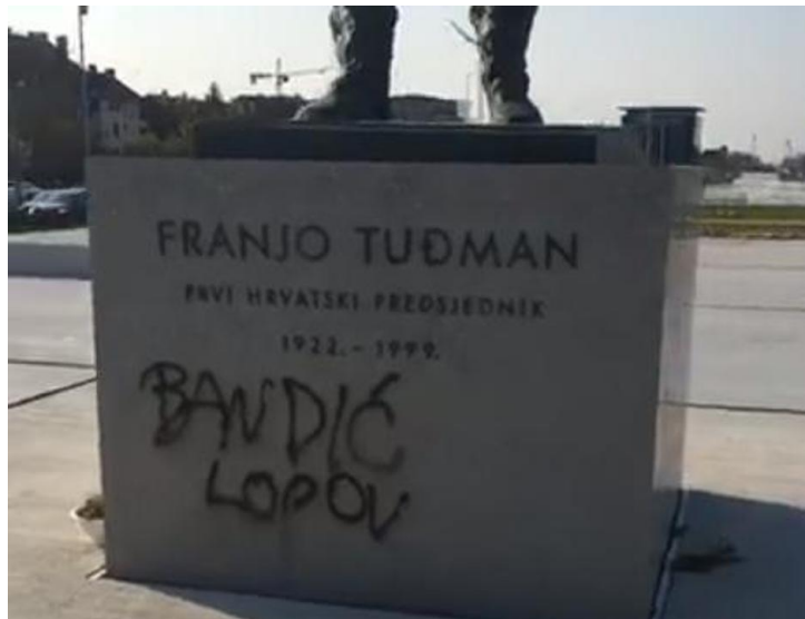
17. Grafit „Bandić lopov“