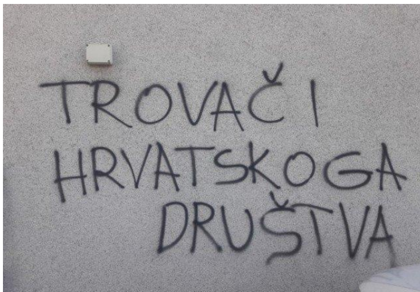
42. Grafit „Trovači hrvatskoga društva“

Prikazani grafiti (vidi fotografije 41. i 42) pojavili su se u Rijeci (R.A/Index.hr, 2019) i odnose se na novinare i novinarsku profesiju. Ovakvi grafiti promiču segmente govora mržnje jer svojim sadržajem ne aludiraju na ništa dobro. Pomalo je žalosno koliko se često u današnjem društvu osuđuju novinari, a ne razmišlja se o tome s čime su novinari uistinu