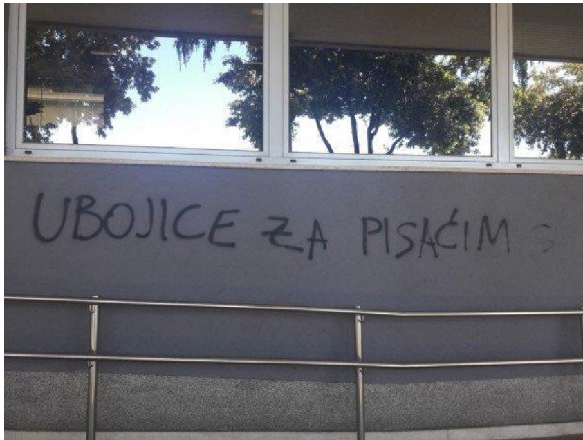
41. Grafit u Rijeci „Ubojice za pisaćim strojem“