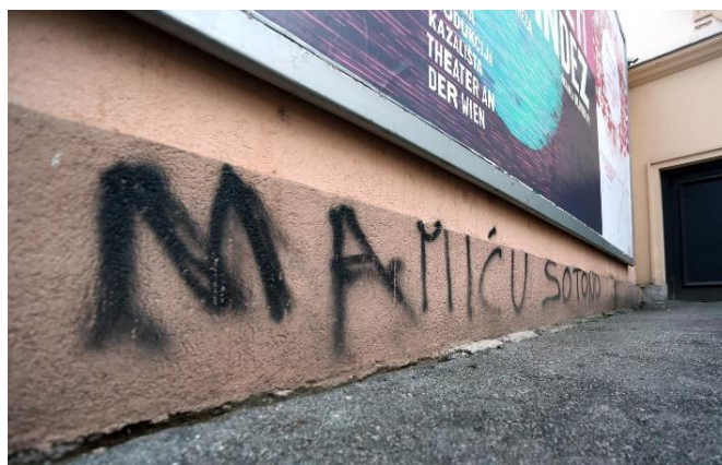
6. Grafit „Mamiću sotonu“

Na prvoj fotografiji (vidi fotografiju 5.) iz Večernjeg lista prikazani su nacistički i ustaški znak na spomenicima. Simboli mogu biti pozitivni ili negativni, mogu karakterizirati sreću ili podsjećati na nastalu štetu na račun čovječanstva. Navedeni znakovi zakonom su zabranjeni jer je utvrđeno kako oni promiču segmente mržnje te je nedopustivo promicati iste, a pogotovo ih crtati na javnim mjestima i na spomenicima. Prošlost treba ostaviti u povijesti i okrenuti se budućnosti kako bi svima nam bilo bolje. Na portalima u ovome slučaju, Večernjeg lista često možemo vidjeti primjere kršenja diskriminacije i govora mržnje koji su postali jedan od najvećih problema današnjice. O takvim temama potrebna je javna debata i konstantno naglašavanje kako se diskriminacijom i u ovom slučaju, simbolima mržnje nikada ništa nije dobro donijelo čovječanstvu i da nikada neće.