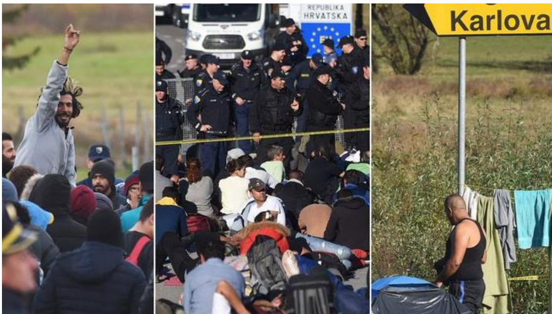
11. Prikaz migranata