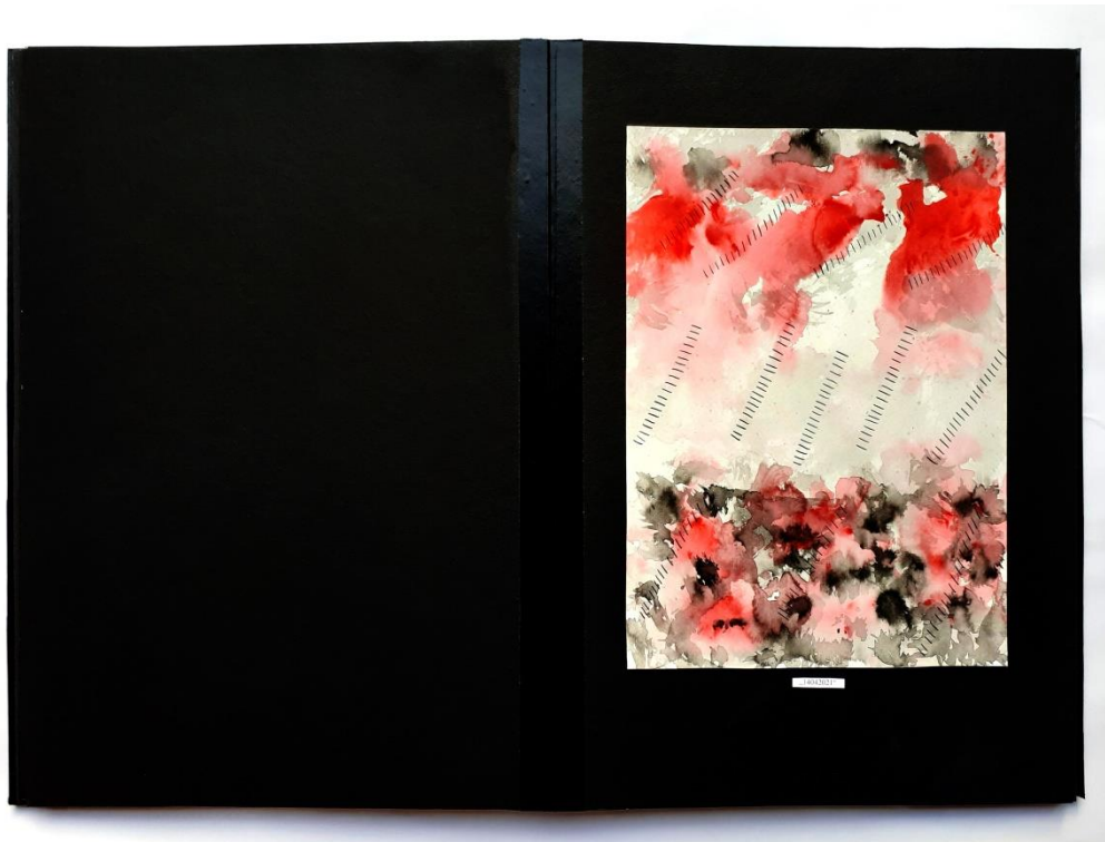
Slika 30. Četvrti prikaz drugog djela rada