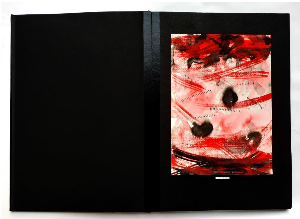
Slika 41. Petnaesti prikaz drugog djela rada