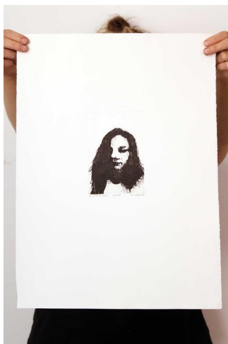
Slika 5. Prvi autoportret prvog djela rada

Svaka ploča je otisnuta u tri primjera na Fabriano Rosaspina papiru debljine 220g, dimenzija 35x50 cm. Izrađene grafike se postavljaju vodoravno na zidu, tako da između grafika bude razmak od 4 cm, a između svake sedme ( koja bi predstavljala protok jednog tjedna) , razmak bi bio 8 cm (vidjeti slike 5.-25.).