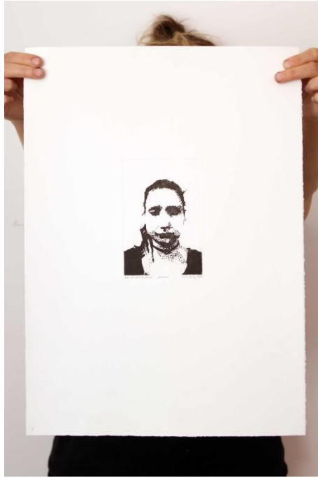
Slika 10. Šesti autoportret prvog djela rada