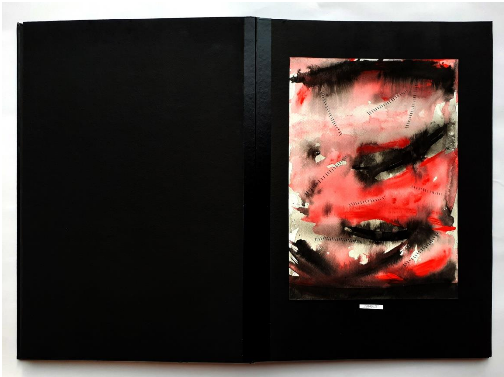
Slika 44. Osamnaesti prikaz drugog djela rada