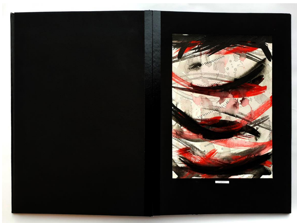
Slika 43. Sedamnaesti prikaz drugog djela rada