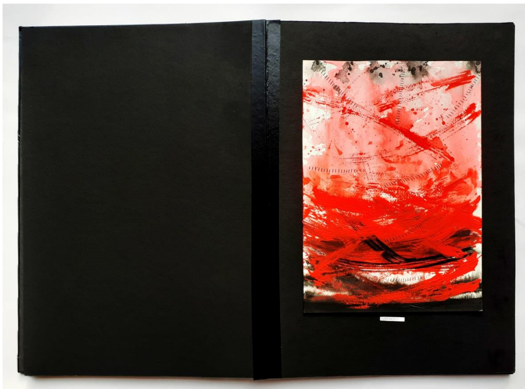
Slika 37. Jedanaesti prikaz drugog djela rada