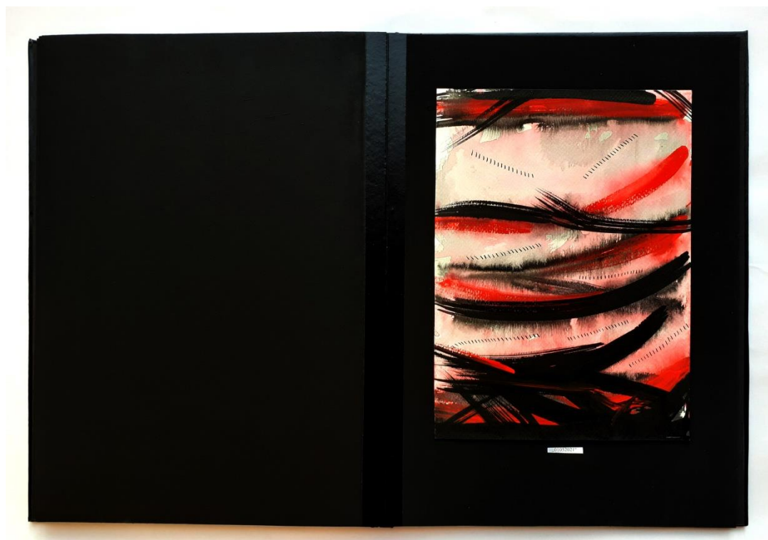
Slika 47. Dvadeset i prvi prikaz drugog djela rada