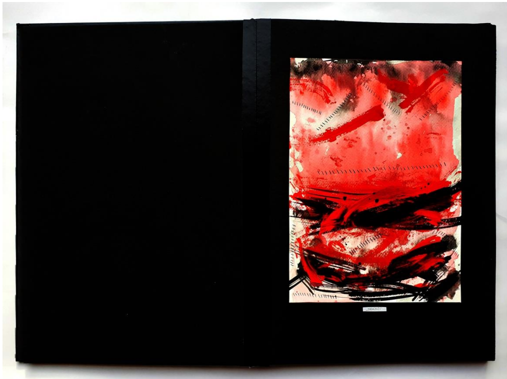
Slika 36. Deseti prikaz drugog djela rada