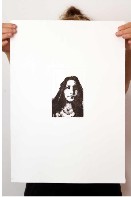
Slika 8. Četvrti autoportret prvog djela rada