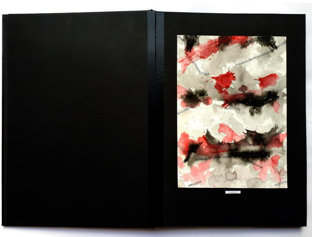
Slika 27. Prvi prikaz drugog djela rada