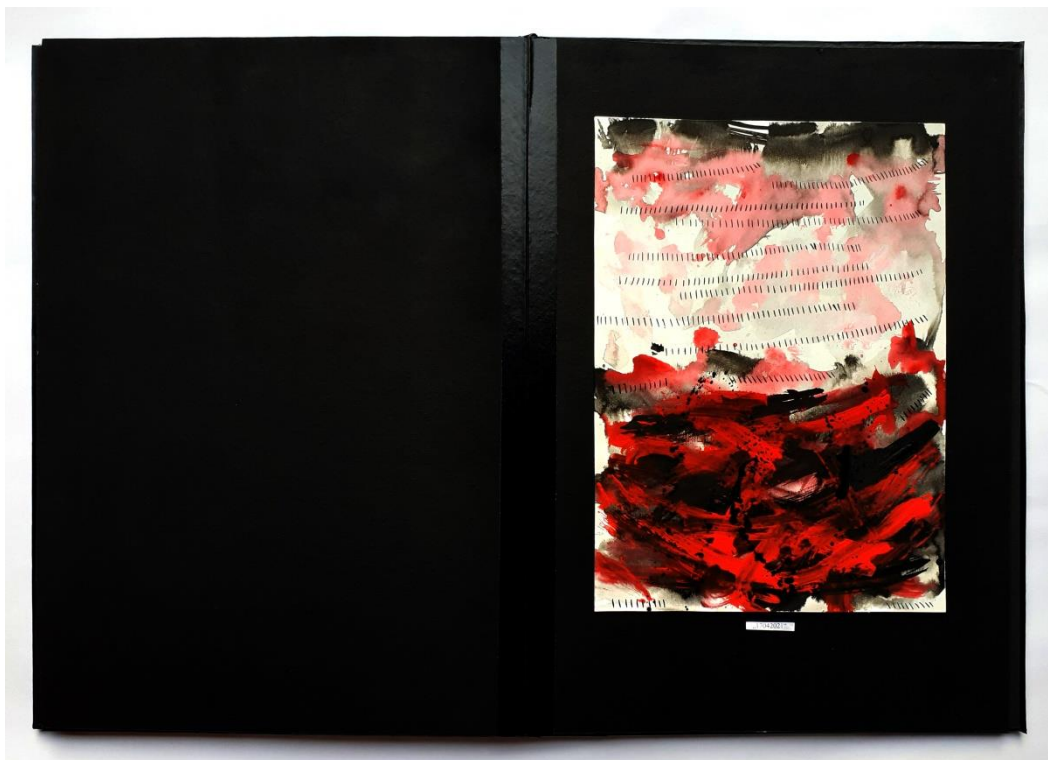
Slika 33. Sedmi prikaz drugog djela rada