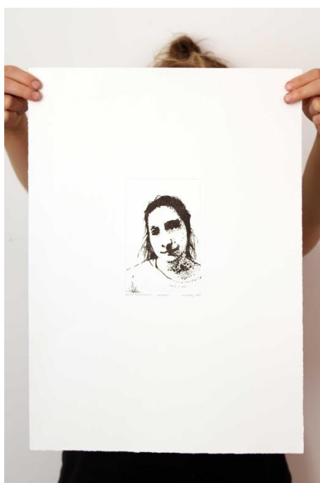
Slika 7. Treći autoportret prvog djela rada