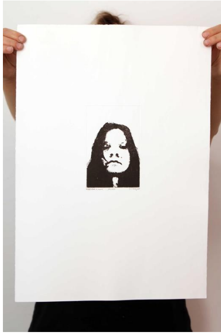
Slika 20. Šesnaesti autoportret prvog djela rada