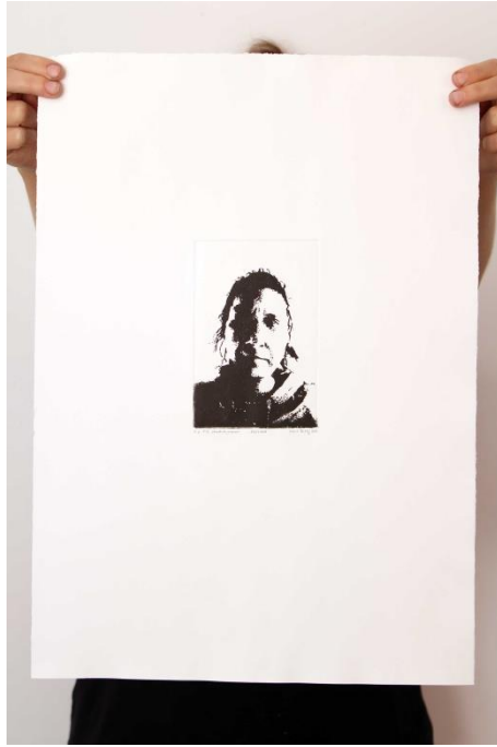
Slika 24. Dvadeseti autoportret prvog djela rada