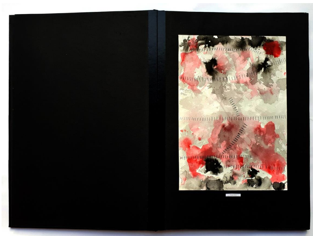
Slika 29. Treći prikaz drugog djela rada