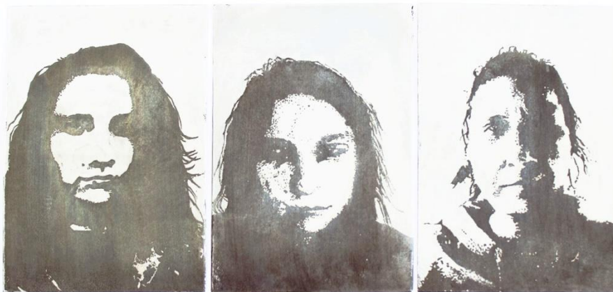
Slika 4. Dio autoportreta prvog djela rada nakon jetkanja ploče

Svaka ploča je otisnuta u tri primjera na Fabriano Rosaspina papiru debljine 220g, dimenzija 35x50 cm. Izrađene grafike se postavljaju vodoravno na zidu, tako da između grafika bude razmak od 4 cm, a između svake sedme ( koja bi predstavljala protok jednog tjedna) , razmak bi bio 8 cm (vidjeti slike 5.-25.).