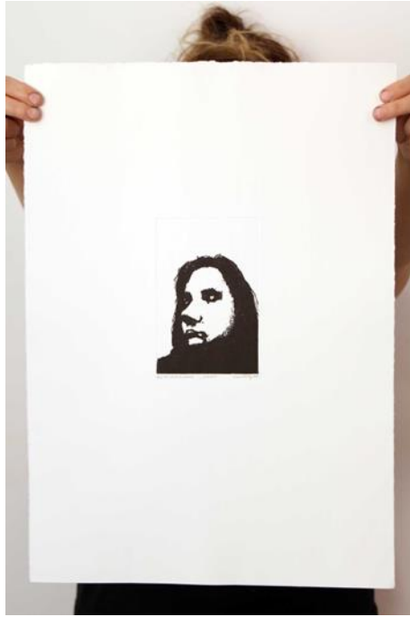
Slika 22. Osamnaesti autoportret prvog djela rada