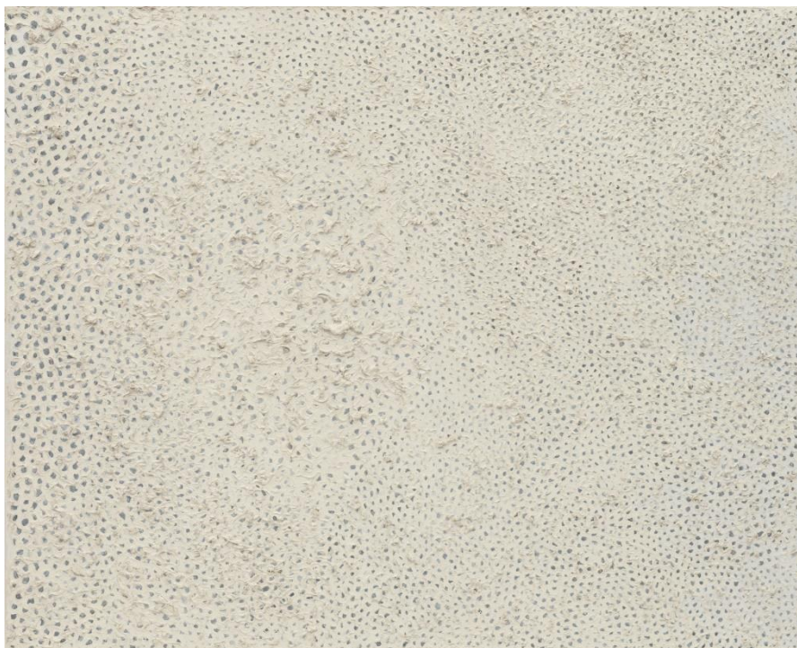
Slika 1. Yayoi Kusama, No. F (Infinity Nets serija), 1959.

Seriya „Infinity Nets“ (vidjeti primjer iz serije na slici 1.) prva ju je uspjela istaknuti nad ostalim umjetnicima. Ovdje se jednobojni potezi kistom u obliku polumjeseca spajaju sa pozadinom tvoreći mreže. Izazivaju se granice platna i istražuje ideja beskonačnosti prisutna kroz opus. Radley, J. (2019). Yayoi Kusama's Radical Work Goes Far beyond Her Infinity Rooms . Artsy. URL: https://www.artsy.net/article/artsy-editorial-yayoi-kusamas-radical-work-infinity-rooms [pristup: 20.08.2021.] Opsesije, repeticije, zaokupljenost djelom te terapijski učinak povezujem i sa radom na seriji „21 dan“.