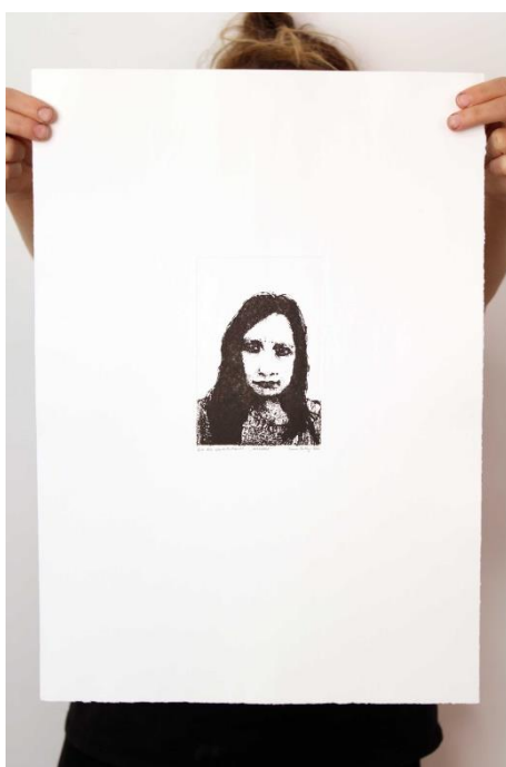
Slika 15. Jedanaesti autoportret prvog djela rada