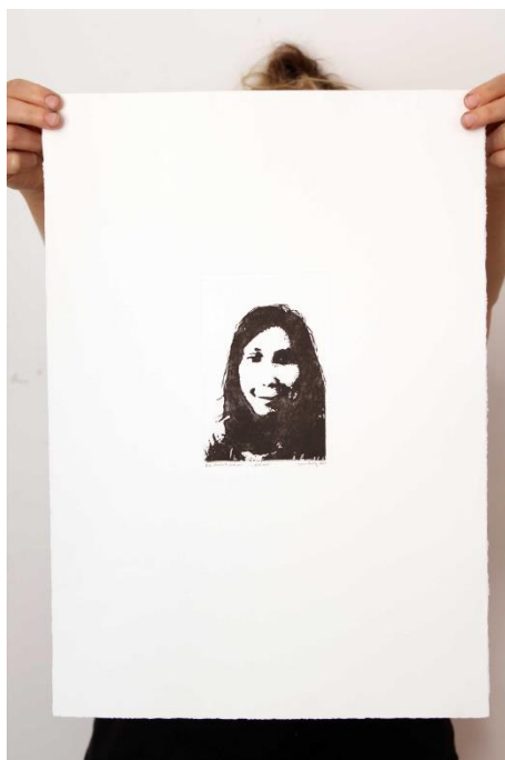
Slika 18. Četrnaesti autoportret prvog djela rada