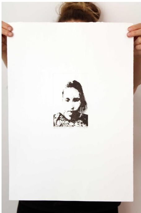
Slika 17. Trinaesti autoportret prvog djela rada