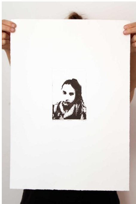
Slika 23. Devetnaesti autoportret prvog djela rada