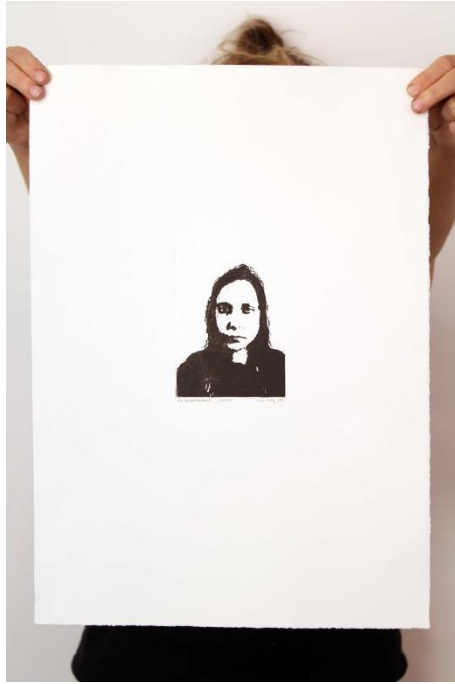
Slika 12. Osmi autoportret prvog djela rada