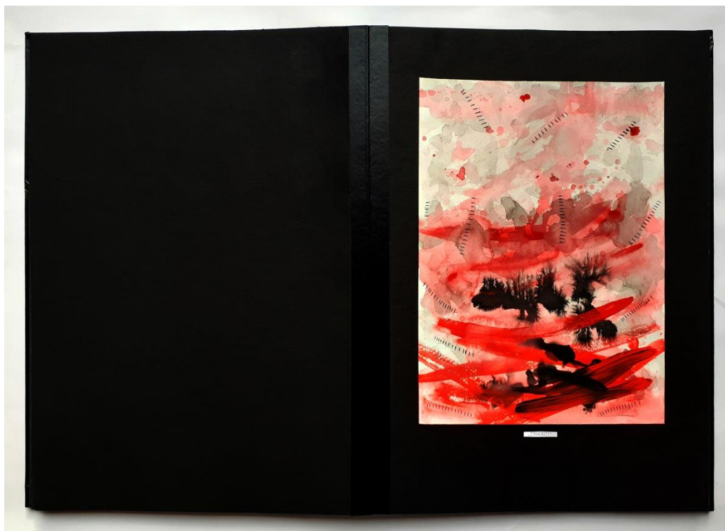
Slika 38. Dvanaesti prikaz drugog djela rada