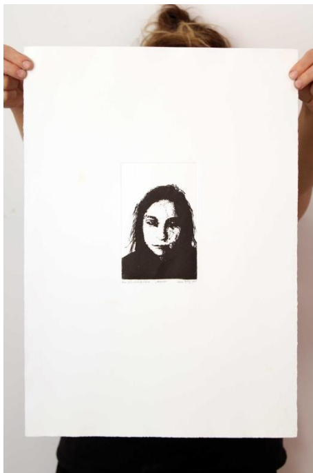
Slika 13. Deveti autoportret prvog djela rada