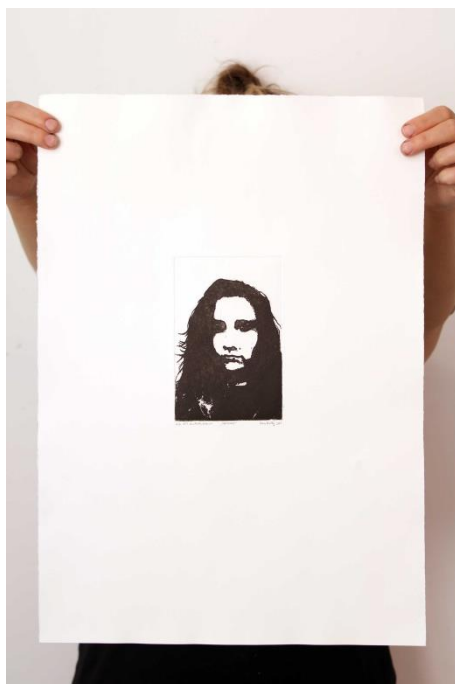
Slika 6. Drugi autoportret prvog djela rada