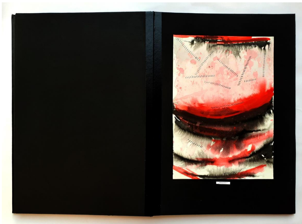
Slika 45. Devetnaesti prikaz drugog djela rada