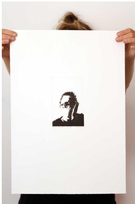
Slika 9. Peti autoportret prvog djela rada