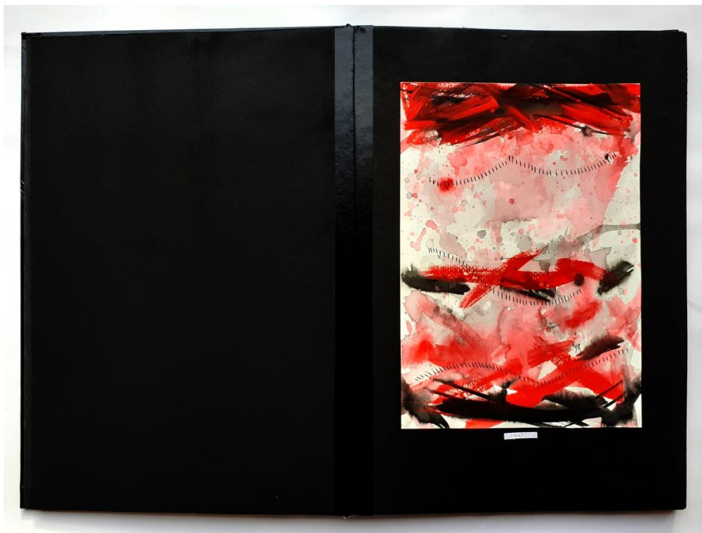
Slika 35. Deveti prikaz drugog djela rada