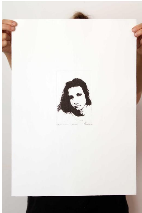
Slika 21. Sedamnaesti autoportret prvog djela rada