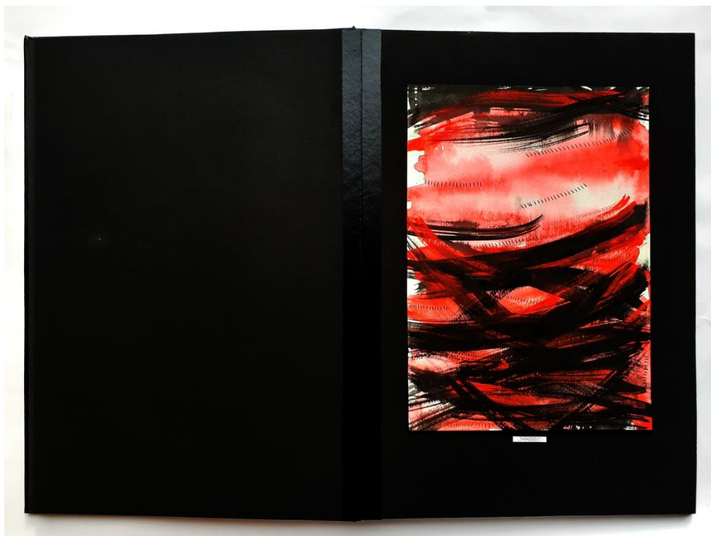
Slika 42. Šesnaesti prikaz drugog djela rada