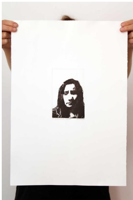
Slika 25. Dvadeset i prvi autoportret prvog djela rada