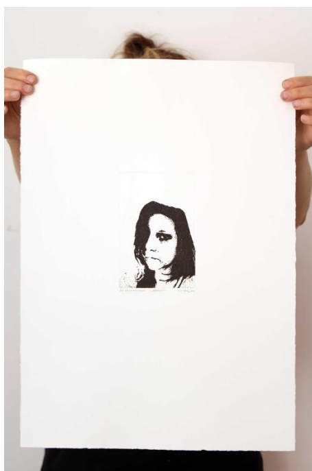
Slika 19. Petnaesti autoportret prvog djela rada