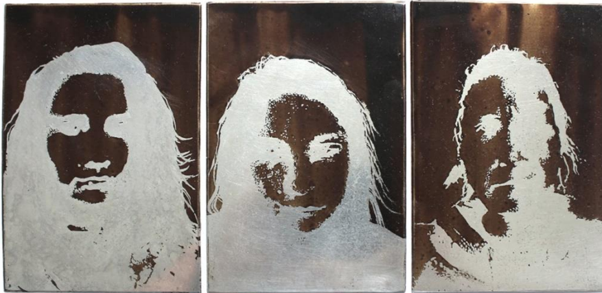
Slika 3. Dio autoportreta prvog djela rada nakon skidanja réservagea

Zatim upotrebljavamo aquatintu. Paro (2002: n.p. ) iznosi da je aquatinta grafička tehnika dubokog tiska koja se upotrebljava za dobivanje tonova (polutonova) jetkanjem bez prethodnog crtanja kao u bakropisu. Hozo (1988: 335-340) kaže kako se metalnu ploču napraši prahom smole (asfalta ili kolofonija) koja se podvrgne topljenju i izlaže djelovanju jetke. U radu je korištena inačica akvatintne površine. Navodi kako su suvremeni aerografi u obliku spreja pa se može koristiti i auto-lak spray. Ovdje treba voditi računa o distanci auto-laka i ploče i (nitroceluloznom) vezivu koje prije tiskanja obvezno odstranjujemo. Ako se koristi auto-lak povećanu pažnju treba posvetiti veoma finom, sitnom zrnu na koje jača jetka djeluje razorno podrivajući fundament veoma sitne metalne površine o koju se drži. Prednost postupka je ekonomičnost jer se auto-lak neposredno nanosi na ploču, čime rastaljivanje nije potrebno.