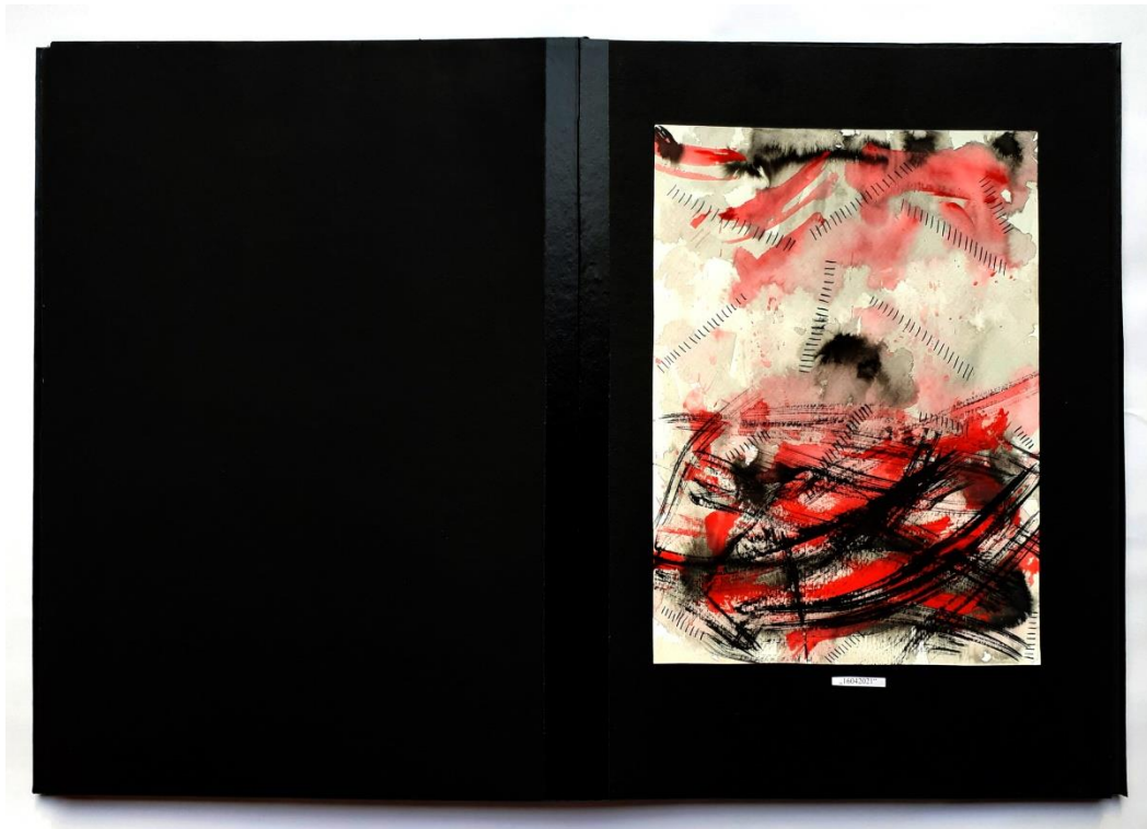
Slika 32. Šesti prikaz drugog djela rada