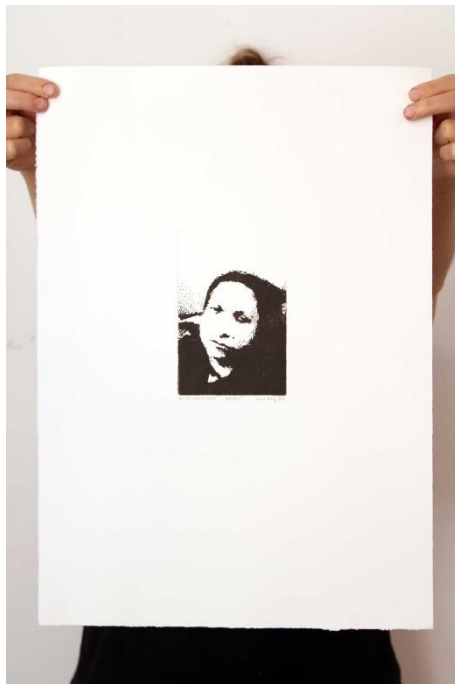
Slika 11. Sedmi autoportret prvog djela rada