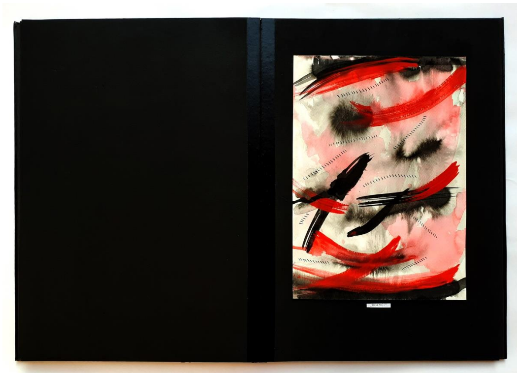
Slika 46. Dvadeseti prikaz drugog djela rada