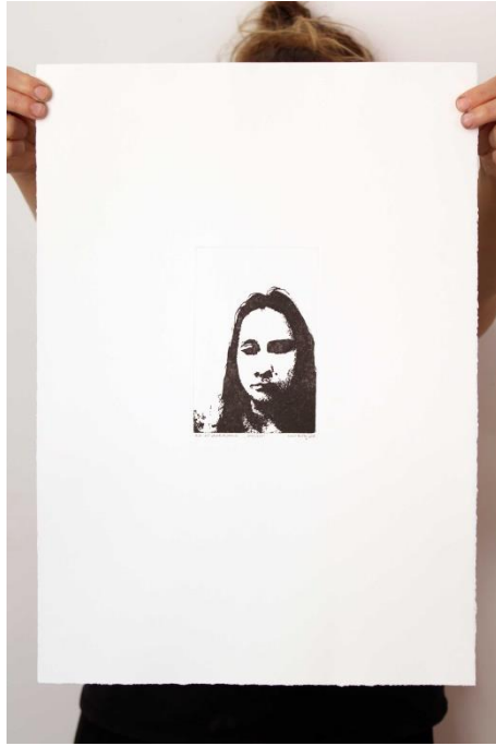
Slika 16. Dvanaesti autoportret prvog djela rada