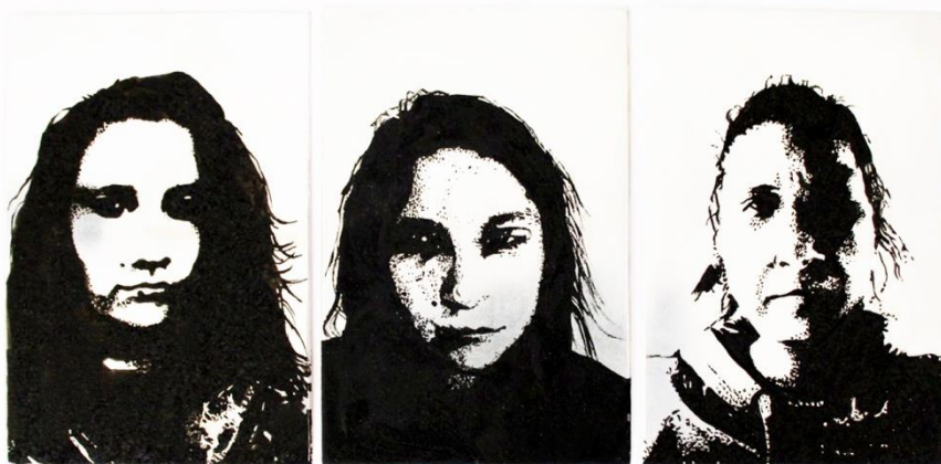
Slika 2. Dio autoportreta prvog djela rada nakon nanošenja réservage a

Čaušić (2020: 49-51) o tehnici réservage iznosi kako njena prednost leži u tome što na ploči jetkamo one dijelove na koje smo nanijeli smjesu, dakle jasno se vide tiskovne površine. Mogućnosti nanošenja su raznolike, a može se i dodatno intervenirati na već osušeni réservage . Receptura koja se pokazala zadovoljavajuća u nastavnoj i umjetničkoj praksi sadržava dvije mjere vode i dvije mjere kristal šećera koji se kuhaju dok voda ne prokuha i dok se šećer ne rastopi. U ohlađenu smjesu dodajemo 1 mjeru tempere (po mogućnosti školske koja se lako topi u vodi), te ½ mjere tekućeg deterdženta za pranje posuđa (bez dodatka balzama i sl.). Pripravak omogućuje fin crtež, preciznih linija koje se ne skupljaju. Nanijeti réservage ostavlja se preko noći da se osuši i nakon toga ploču premažemo tankim slojem razrijeđenog tekućeg bitumena, koji se također treba osušiti. Ploču tada polažemo u mlaku vodu i nakon nekog vremena finim kistom odvajamo réservage od ploče, nakon čega je spremna za daljnju obradu.(vidjeti sliku 2. i 3.)