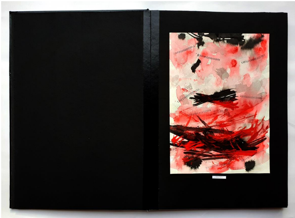
Slika 34. Osmi prikaz drugog djela rada