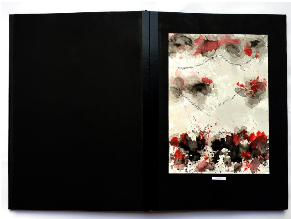
Slika 28. Drugi prikaz drugog djela rada