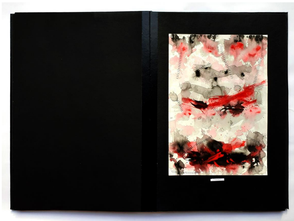
Slika 31. Peti prikaz drugog djela rada