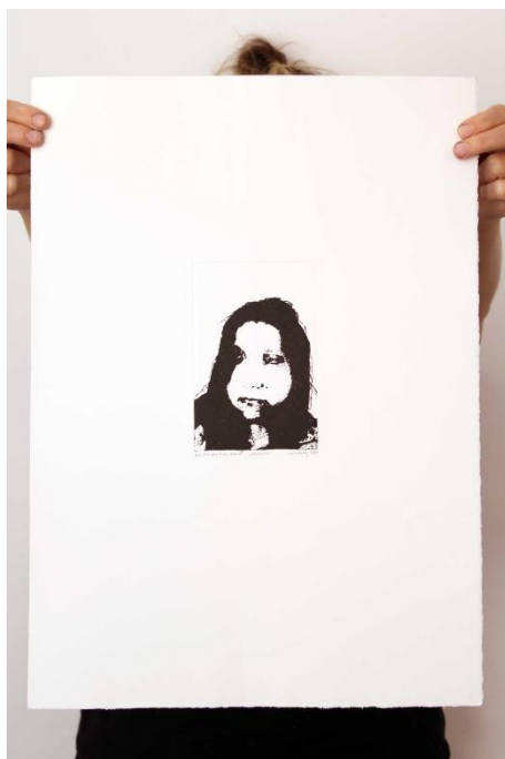
Slika 14. Deseti autoportret prvog djela rada