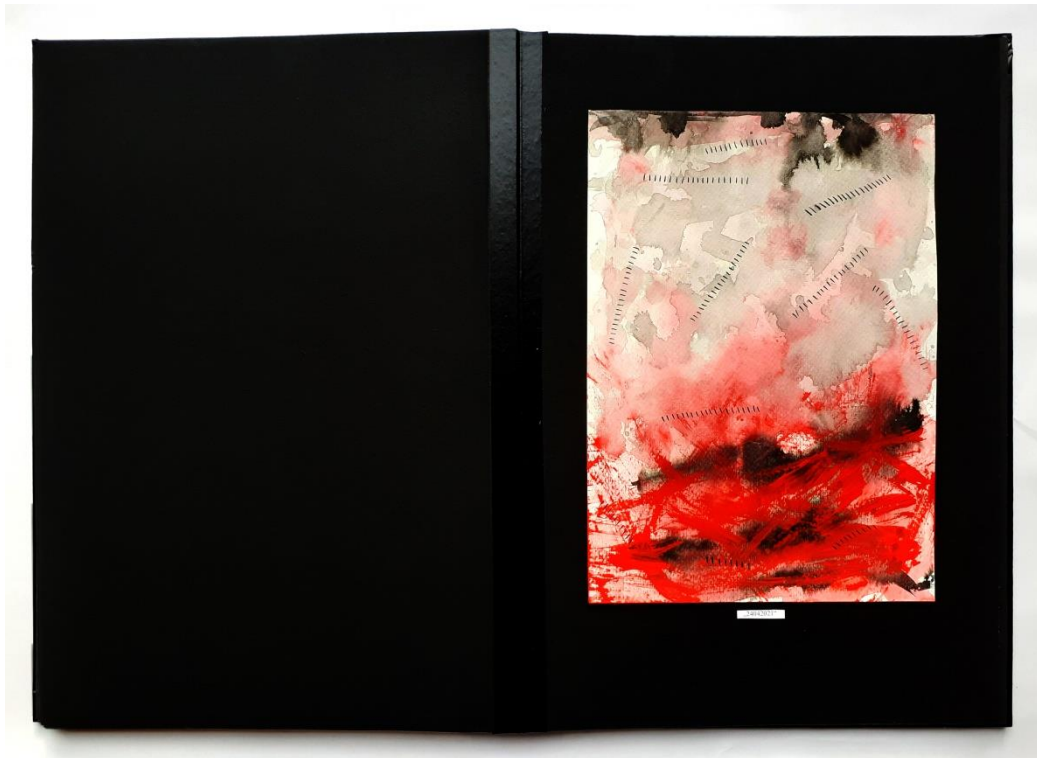
Slika 40. Četrnaesti prikaz drugog djela rada