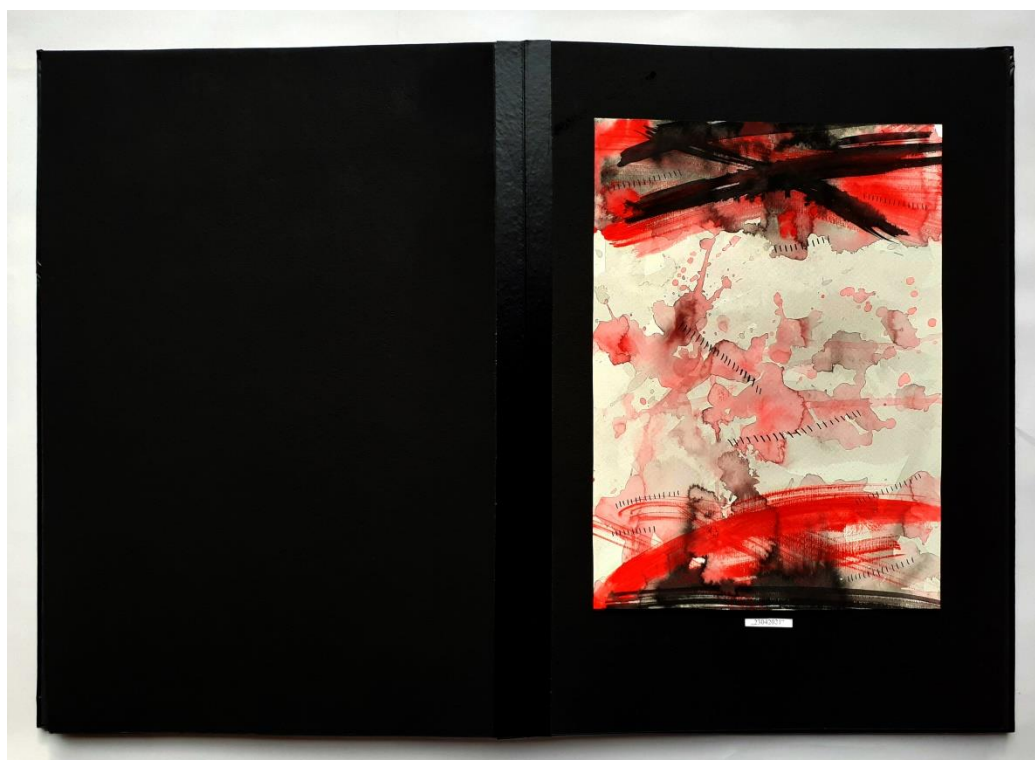
Slika 39. Trinaesti prikaz drugog djela rada