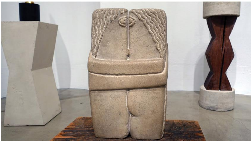
Slika 4: Constantin Brancusi , Poljubac , 1926.

kroz oblike. Od tada je apstraktna skulptura postala plodno tlo za eksperimentiranje u proporcijama, tehnicama i oblicima, prihvaćala je i netradicionalne kiparske metode poput industrijskih proizvodnih procesa i materijala. „U prvom desetljeću 20. stoljeća rumunjski umjetnik Constantin Brancusi (slika 4) postavio je osnovno pitanje što apstraktna skulptura trebala prenijeti: sliku subjekta ili njegovu bit? U sljedećem desetljeću Pablo je Picasso dokazao da skulpturu nije potrebno klesati, oblikovati ili lijevati: ona se može sastaviti, a u desetljeću nakon toga, Alexander Calder pokazao je da se skulptura može kretati.“ (Barcio, 2016) Primjer je rane apstraktne skulpture rad Poljubac (slika 4) rumunjskog kipara Constantina Brancussija. Ovo je jedna od mnogih inačica Poljupca , a u svakoj je težio pojednostaviti geometrijske i zakrivljene oblike prema apstrakciji. Prikazane su dvije osobe koje su toliko blizu da se spajaju u jedan blok.