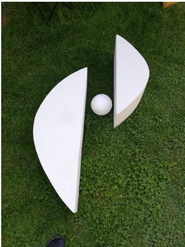
Slika 14: Tri elementa skulpture