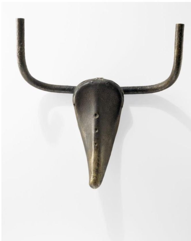
Slika 2: Pablo Picasso, Glava bika , 1942.

objekt je prihvaćen kao jedan od oblika kiparskog izražavanja, čime je proširen sam pojam skulpture. Karakterističan primjer je rad Glava bika španjolskog umjetnika Pabla Picassa (slika 2) koji transformacijom volana bicikla asocijativnim ostvarenjem realizira kiparski rad, odnosno postiže umjetnički rad u duhu ready-madea .