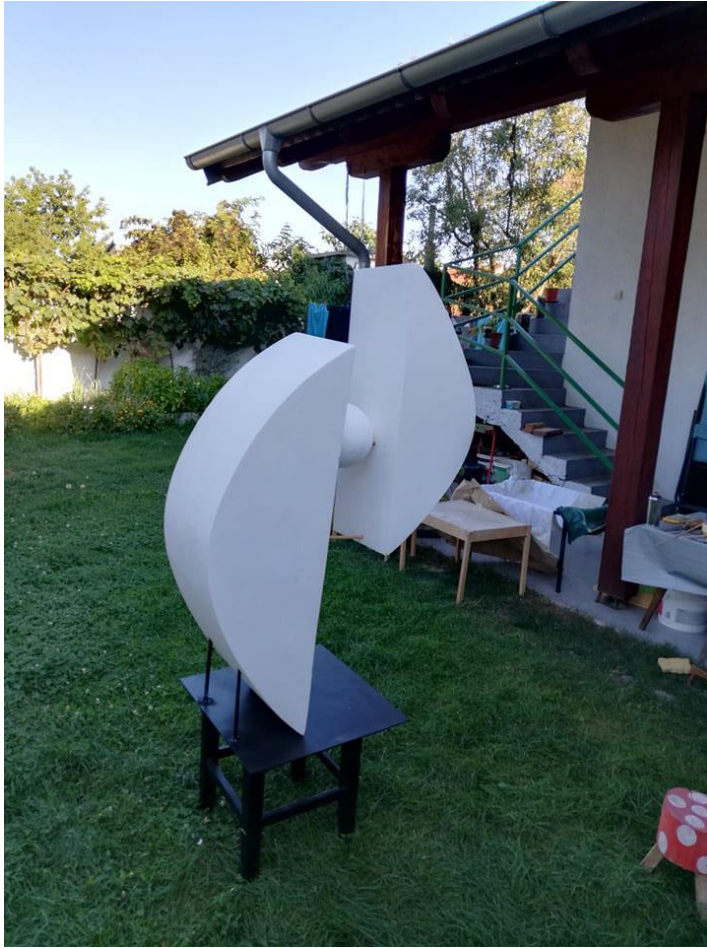
Slika 11. Završen rad