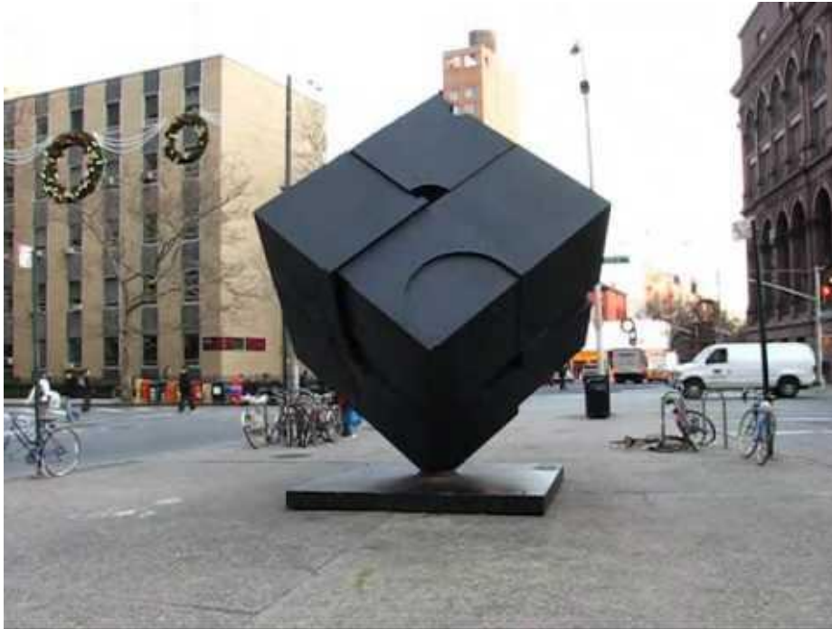
Slika 7. Richard Serra, Kocka, 1967.

Primjer asimetričnog balansa stvorenog u prirodi prikazuje kanadski umjetnik specijaliziran za balansiranje kamenja Michael Grab (slika 8). Vođen svojom intuicijom, znanjem i iskustvom koje je stekao u balansiranju kamenja u prirodi, stvara naizgled nemoguće balanse. Ovakav rad, koji zahtjeva puno strpljenja- i iskustva, ima i terapijska svojstva u kojima se umjetnik spaja s prirodom i svoje misli umiri kako bi uspio pronaći balans u sebi i kamenju.