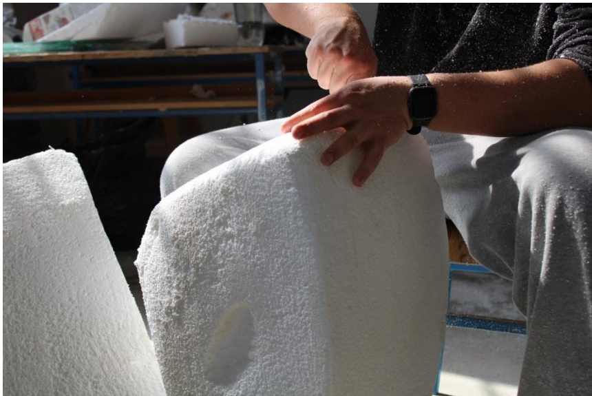
Slika 12. Obradivanje stiropora

Izradu likovnog dijela završnog rada započeo sam oblikovanjem dvaju komada stiropora. U početnoj su fazi komadi stiropora bili kvadratnog oblika. Izrezao sam ih ručnom pilom u dva približno polukružna trodimenzionalna oblika, te sam ih dalje usavršavao sa žičanom četkom i brusnim papirom (slika 8 i 9). Zatim sam, također od stiropora, metalnom četkom i brusnim papirom oblikovao kuglu (slika 7). Sve neravnine i veće rupe na stiroporu popunjavao sam poliuretanskom pjenom kako bih postigao da površina bude u potpunosti ugađena. U sljedećoj je fazi na dva komada stiropora nanesa glet masa, prvo u debelom sloju, zatim tanjem kako bi se ispravile eventualne neravnine i nepravilnosti te postigla ravna i napeta površina. Potom sam s drvenim tiplovima probio dvije rupe kroz kuglu te polukružne elementa skulpture učvrstio na nju pri čemu je jedan dio izdignut od površine tla. Postolje skulpture izrađeno je od željezne ploče kvadratnog oblika na koje su zavarene dvije željezne šipke (slika 11). Postolje je obojano crnom bojom kako bi se stvorio kontrast između njega i bijele boje skulpture.