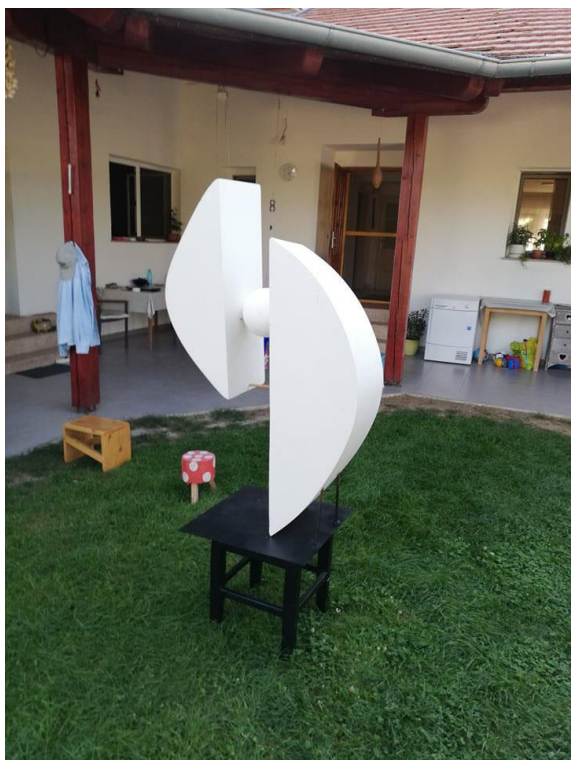
Slika 10. Završen rad