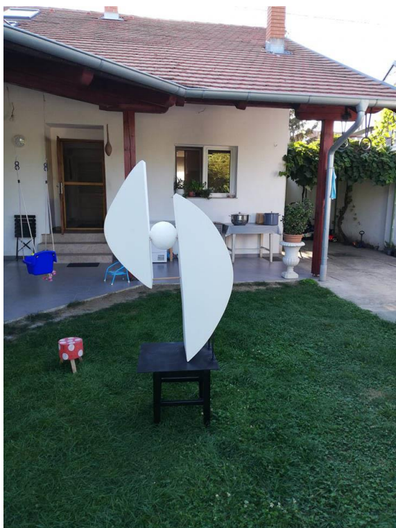
Slika 9. Završen rad u prostoru

„Bez obzira o tehnikama o kojima govorimo, ravnoteža je važna jer unosi likovni rad u vizualni sklad, ritam i koherentnost te potvrđuje njegovu cjelovitost.“ (Bradley, 2013)