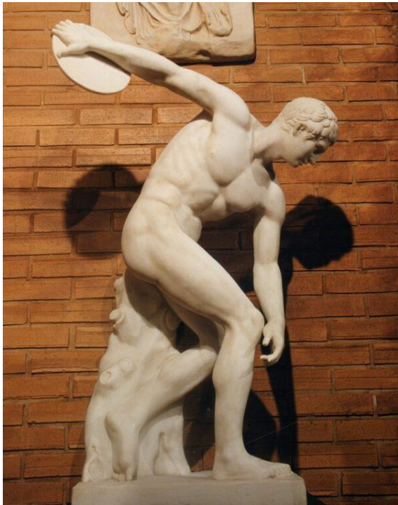
Slika 1: Myron, Diskobol bacač diska , 460. – 450. pr. Kr.

ne skulpture, odnosno odlukom umjetnika da ga tretira kao skulpturu.“ (Šuvaković, 2005) Skulptura u užem smislu rabi tradicionalne materijale poput kamena, metala, gline, keramike ili drveta, dok skulptura u širem smislu, odnosno, suvremena skulptura, može biti izrađena od bilo koje vrste materijala poput kamena, metala, zvuka, svjetla, raznih predmeta, ljudi ili ne mora sadržavati materijale. (Ellegood, 2007) Dakle, definicija skulpture je otvoreni koncept koji uključuje, osim tradicionalnog poimanja definicije skulpture, objekte i instalacije, tj. prostorne umjetničke radove, koji su se formirali preobrazbom likovnog pojma skulpture ili eksperimentima.