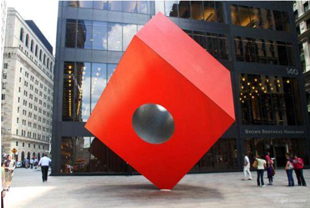
Slika 6. Isamu Noguchi, Crvena kocka , 1968.