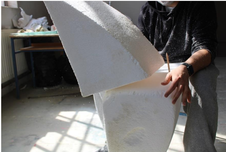
Slika 13. Spajanje stiropora