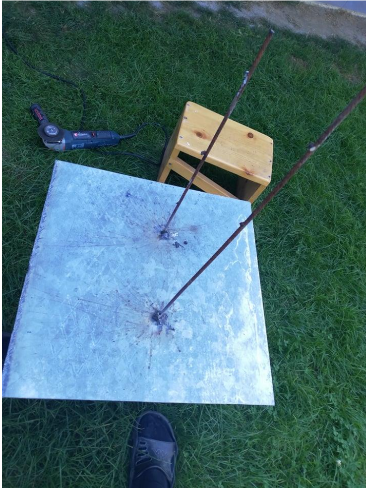
Slika 15. Izrada postamenta