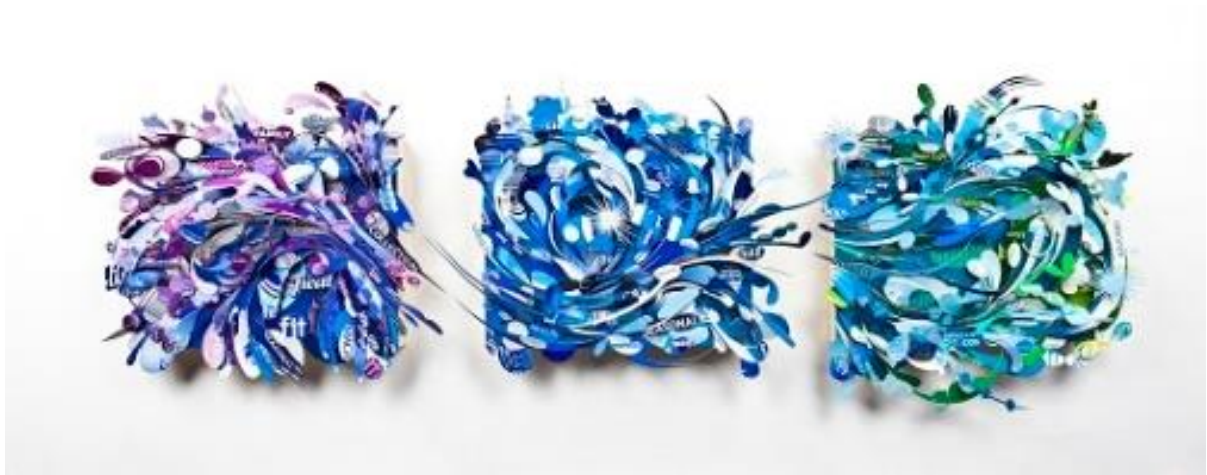
Slika 2: Aurora Robson, Provjera nagrade , 2013.