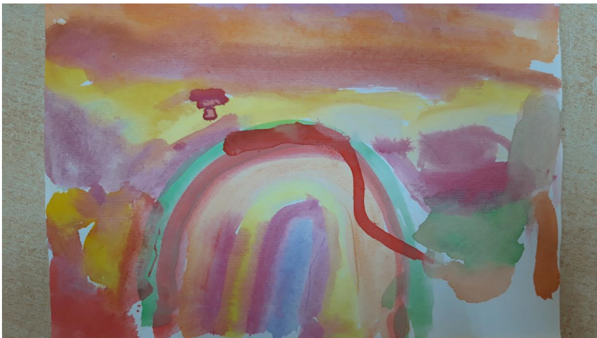
Slika 6., dječji crtež, 6 god.

Rad pripada šestogodišnjoj djevojčici. Djevojčica prikazom šarene duge ukazuje na to da boravi u sretnom i pogodnom okruženju. Dominantnu žutu boju možemo povezati sa srećom, radošću i energijom. Djevojčica nam kroz narančastu i crvenu boju odaje da je odlučna te da ima ohrabrujuće i čvrsto okruženje.