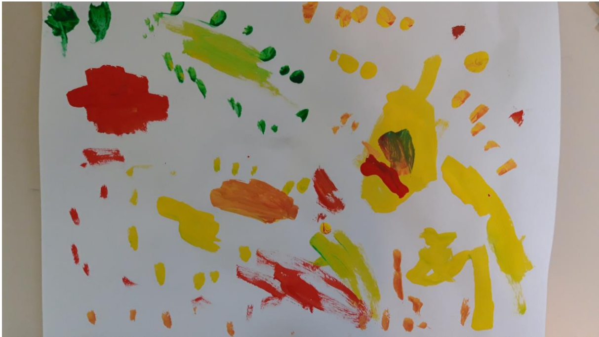
Slika 8., dječji crtež, 3 god.

Rad pripada trogodišnjem djetetu. Različiti ritmovi ravnih, kosih, isprekidanih i oblih oblika ovom uratku daju dinamičnost. Žutom bojom govori nam kako je ovdje riječ o razigranom djetetu, prikazuje sreću, a narančasta boja može nam ukazati i na potrebu za aktivnošću, interakciju. Crvenom želi pokazati dominaciju, a zelenom bojom pokazuje kako voli boraviti u prirodi.