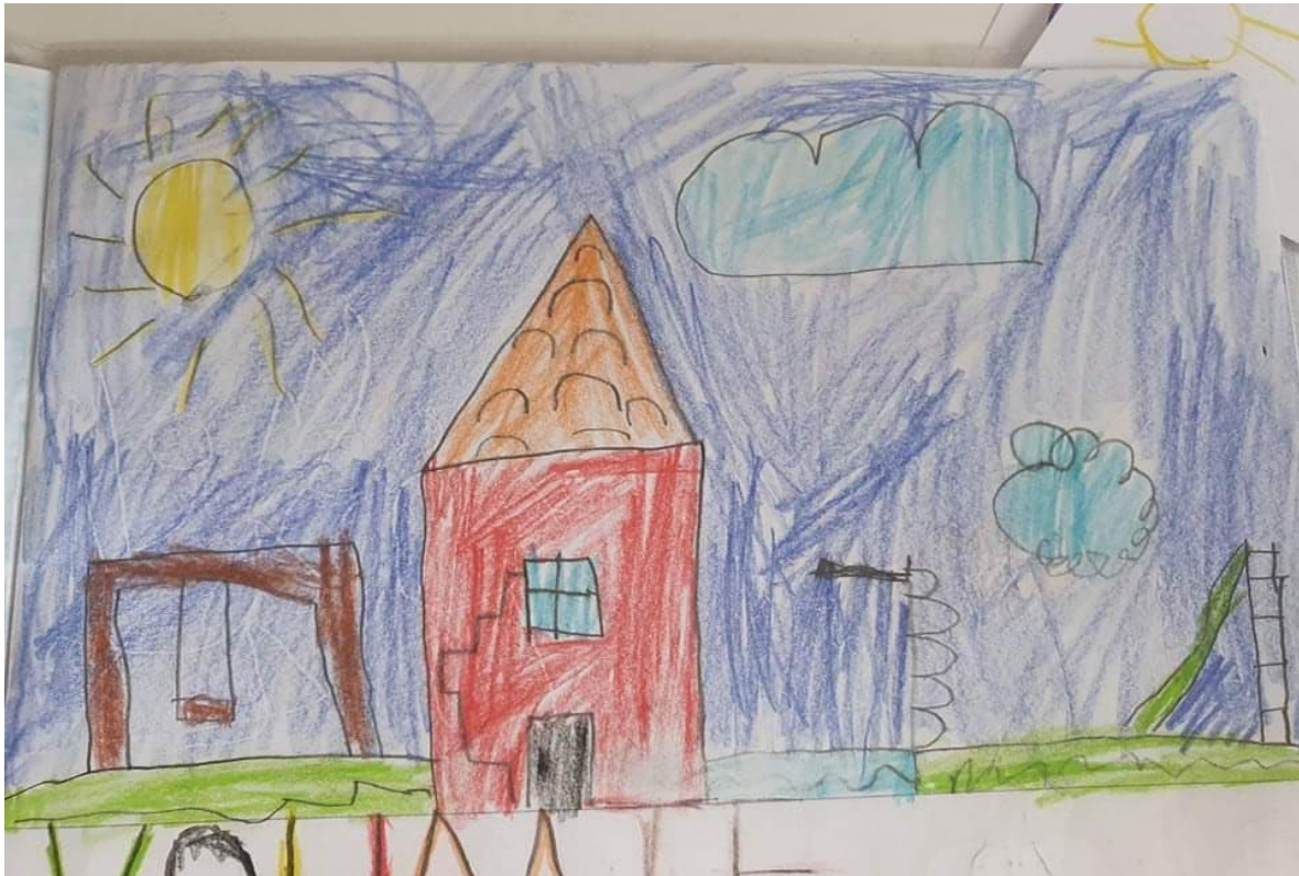
Slika 2., dječji crtež, 7 god.

Crtež pripada 7-godišnjem dječaku. Jasno vidimo uporabu jakih boja i impulsivnog poteza pri bojanju s definicijom kontura. Prevladavaju crvena i plava boja. Značajan je i prikaz jakih linija.