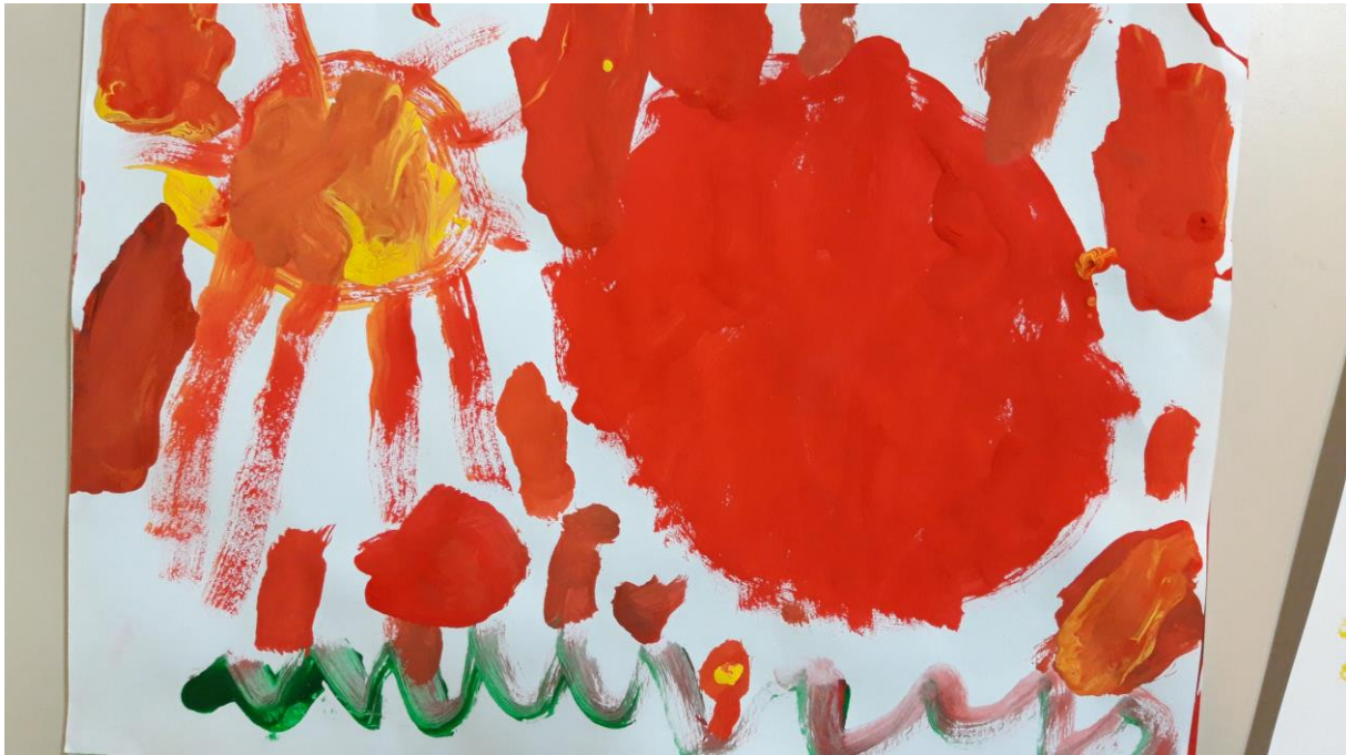
Slika 3., dječji crtež 3 god.

Rad pripada trogodišnjem dječaku. Načinom na koji slika otkriva nam svoj temperament. Širokim potezima i intenzivnom crvenom bojom ukazuje nam da se radi o dječaku koji želi biti dominantan. Također nam govori o svojoj energičnosti.