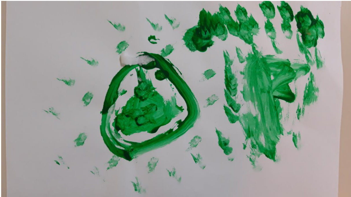
Slika 3., dječji crtež, 3 god.

Rad pripada trogodišnjem djetetu. Zelena boja omiljena je među ljubiteljima prirode, koji vole životinje i igru na otvorenom te je obično koriste djeca koja brzo uče i trebaju slobodu i prostor.