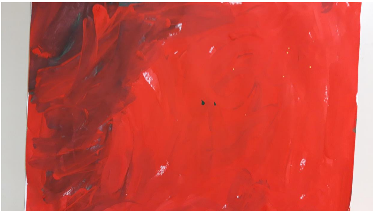
Slika 9., dječji crtež, 4 god.

Crtež pripada četverogodišnjem dječaku. Na dječjim crtežima crvena boja ima snažan utjecaj. Crvena kao boja krvi simbol je entuzijazma i energije. Rad nam sugerira da dijete koje crvenu boju koristi dosljedno, jest dominantan i ekstrovertiran te voli biti u središtu pažnje.