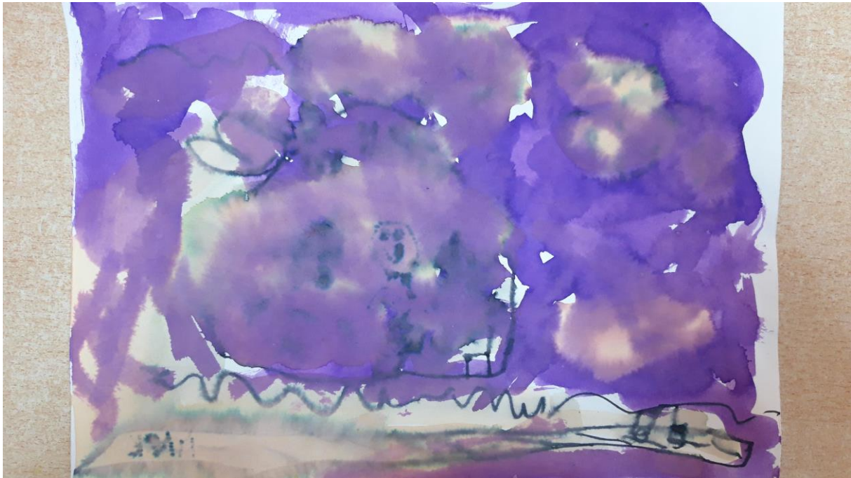
Slika 5., dječji crtež, 5 god.

Rad pripada petogodišnjem dječaku. Prvobitno je htio prikazati svoga prijatelja. Lagani potezi kista i nanosa boje ukazuju nam da se radi o introvertiranom djetetu. Također i prevlast ljubičaste boje ukazuje da je ovaj dječak povučen, a može ukazivati i na anksioznost. Ljubičasta je boja ponekad povezana s izrazom unutarnje nelagode.