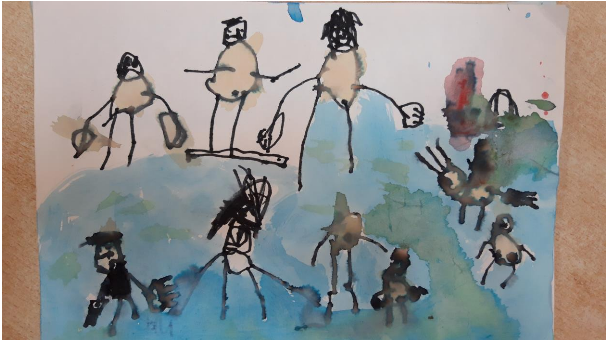
Slika 4., dječji crtež, 5 god.

Prikazan je rad petogodišnjeg dječaka. Prikazao je svoje prijatelje. Ovaj dječak ima vrlo bogat unutarnji svijet, a jake crne linije ukazuju nam kako se radi o hirovitom djetetu. Likovi s dugačkim udovima i prešaranim licima mogu ukazivati da je dijete ljuto.