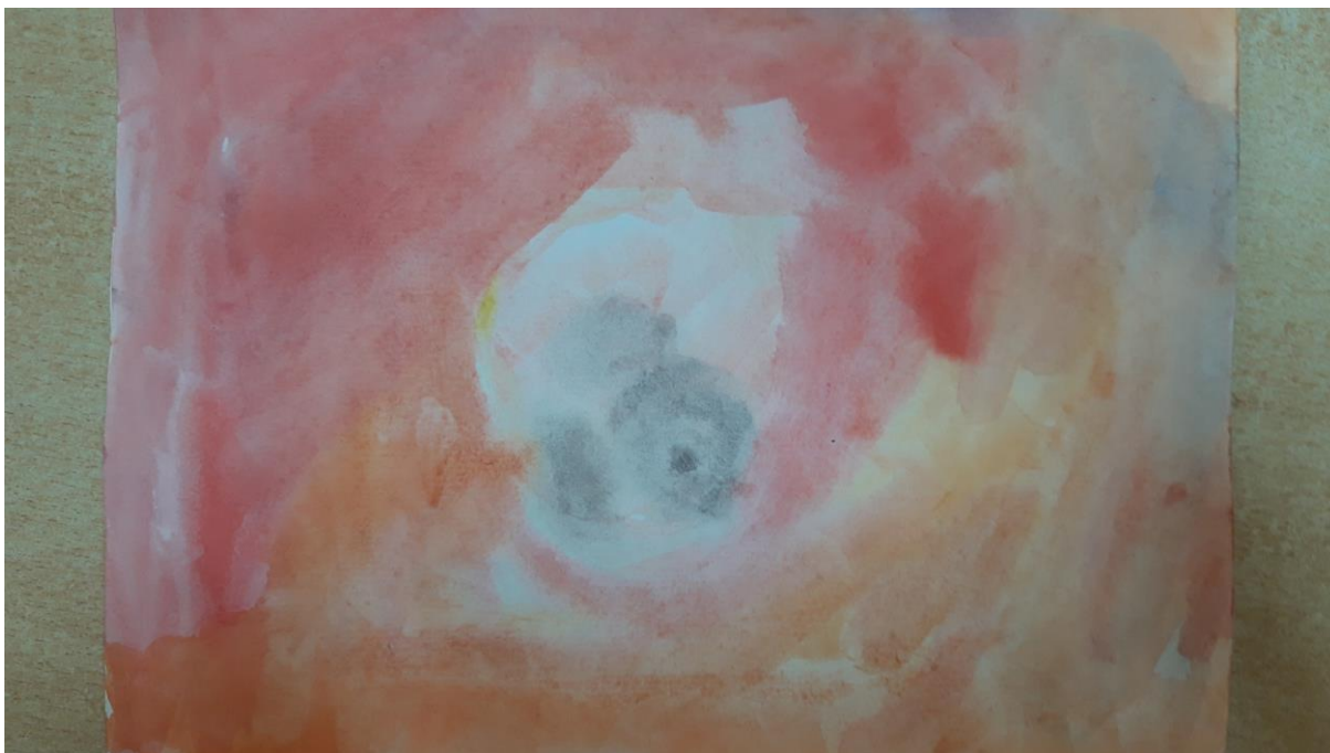
Slika 7., dječji crtež, 4 god.

Rad pripada četverogodišnjoj djevojčici. Prelagan potez kista otkriva bojažljivost, hipersenzibilnost, introvertno te kako je često vrlo suzdržano dijete. To može biti i znak potrebe za pažnjom, odobravanjem i pohvalom.