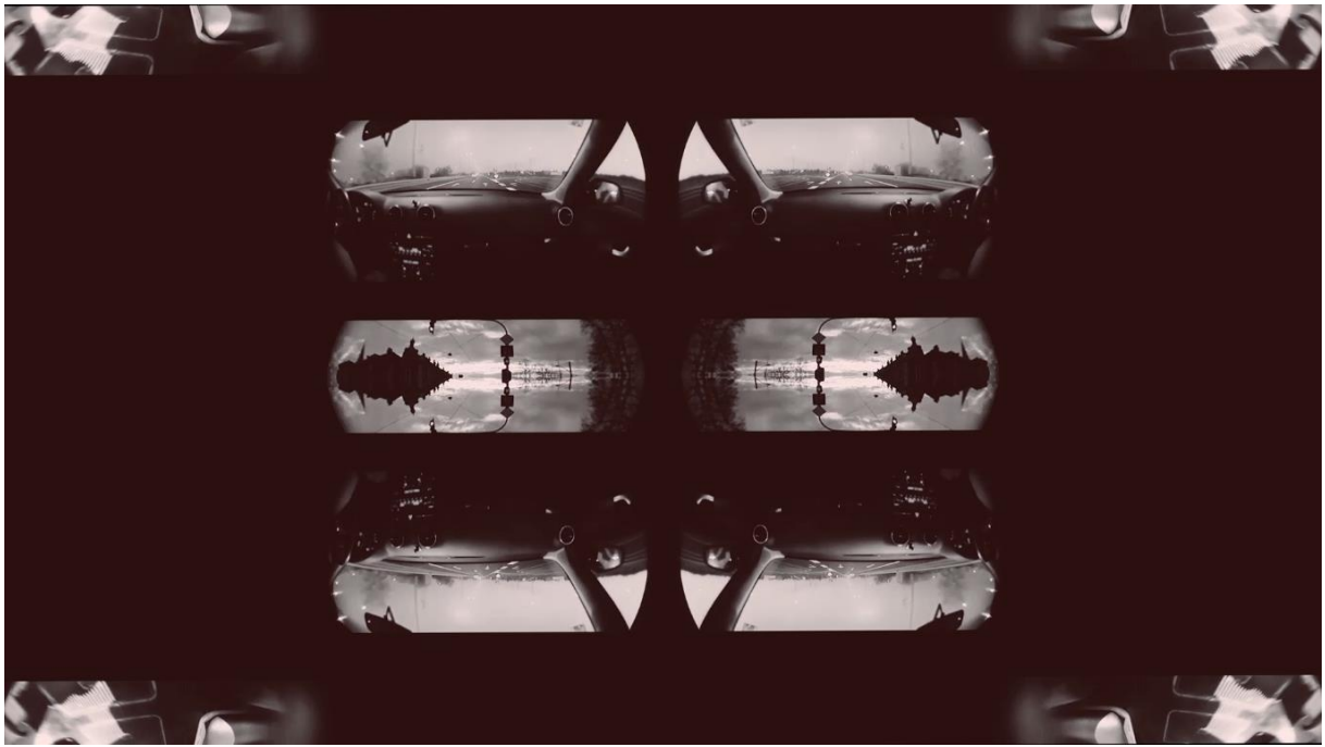
Prilog 3. Doris Ređa, Paralele, Audio-vizualna instalacija, 2021., slika zaslona završne verzije diplomskog rada