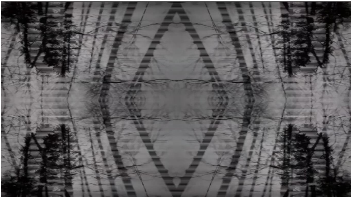
Prilog 2. Doris Ređa, Paralele, Audio-vizualna instalacija, 2021., slika zaslona završne verzije diplomskog rada