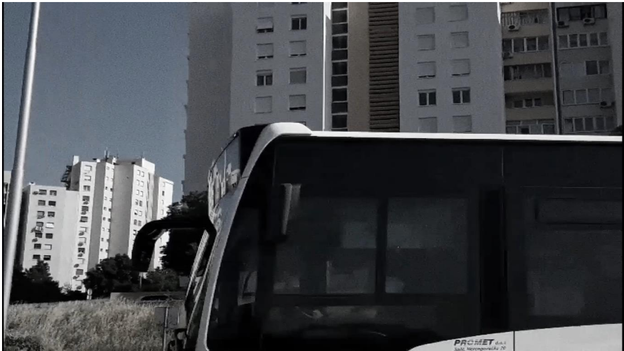
Prilog 5. Doris Ređa, Paralele, Audio-vizualna instalacija, 2021., slika zaslona završne verzije diplomskog rada