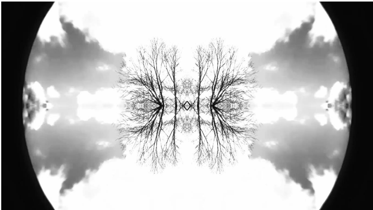
Prilog 1. Doris Ređa, Paralele, Audio-vizualna instalacija, 2021., slika zaslona završne verzije diplomskog rada