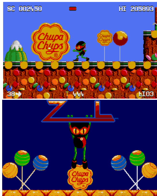
Slika 2. i 3.: Snimke zaslona unutar igre "Zool"