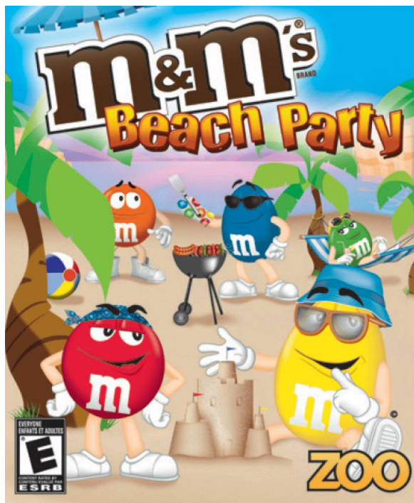
Slika 1.: Naslovna strana pakiranja M&M advegamea

Advergaming način je oglašavanja koji „koristi video igre u svrhu oglašavanja“. (Alcoverro 2021., n.p.) U ovoj se metodi igre ne koriste na već navedene načine gdje se oglasi pojavljuju unutar igre na jedan ili drugi način. Ovdje se radi o video igrama koje su kreirane isključivo kao način promocije što znači da je igru financirao brand ili korporacija samo kako bi se koristila u oglašavanju. Primjer advergaminga je serija video igara M&M (slika 1.) u kojoj se dva čokoladna M&M bombona upuštaju u razne avanture. U primarnom su fokusu brendirani žuti i crveni bombon koji se također koriste u televizijskim reklamama i na društvenim mrežama. Još su neki primjeri advergaminga Lego video igre, "Zool" (slika 2.) koji je kreiran kao promocija Chupa Chupsa i cijela serija video igara za konzolu XBOX pod nazivom "King" koju je kreirao Burger King.