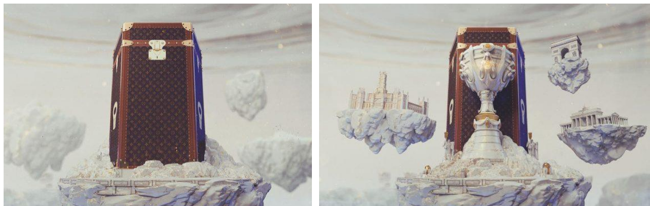
Slika 4. i 5.: Dizajnerski kovčeg trofeja Summoner's Cup za League of Legends Worlds 2019. godine

natjecanja najbolja prilika za oglašavanje. League of Legends Worlds kao jedno od najgledanijih esport natjecanja ikad ima velik broj uglednih sponzora. Zadnje je prvenstvo obilježila suradnja s dizajnerskom kućom Louis Vuitton koja je kreirala poseban putni kovčeg (slika 4. i 5.) za Summoner's Cup što je naziv trofeja koji se dodjeljuje pobjedniku League of Legends Worlds natjecanja.