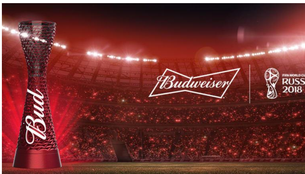
Slika 1. Sponzor Svjetskog prvenstva