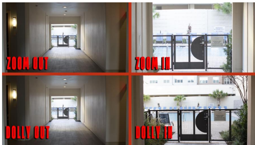
Slika 1: Prikaz Zoom in/ zoom out i Dolly in/ dolly out pokreta kamere

Dolly in/dolly out za razliku od zooma, pretjerano se ne oslanja na mogućnosti kamere već kolica na koja je kamera postavljena. Služi nam kako bismo kameru pomicali naprijed ili natrag.