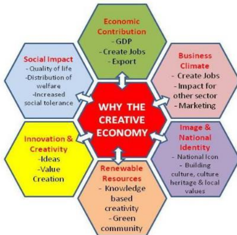
Slika 3: Važnost kreativne ekonomije

„Pojam kreativne ekonomije nastaje i razvija se u tzv. umreženome društvu u kojem su inovacije u informatičkim i komunikacijskim tehnologijama uz procese digitalizacije otvorile niz pitanja vezanih uz shvaćanje novih načina distribucije, potrošnje i proizvodnje kulturnih dobara i usluga.“ (Castells 2002, prema Primorac, 2010)