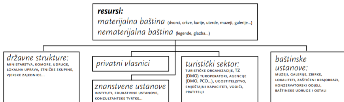
Slika 1: Dionici u kreiranju kulturno-turističke destinacije