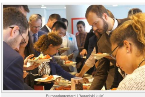
Europarlamentarci i 'baranjski kulini'

Izvorni Baranjski kulen proizvodi se prema vrlo strogim specifikacijama i samo na području Baranje, od najboljih komada svinjskog mesa, začinenog solju, mijevenom paprikom, bijelim lukom i paprom. Njegovo zrenje odvija se tijekom nekoliko mjeseci, nakon čega on dobiva svoj prepoznatljiv izgled i okus.