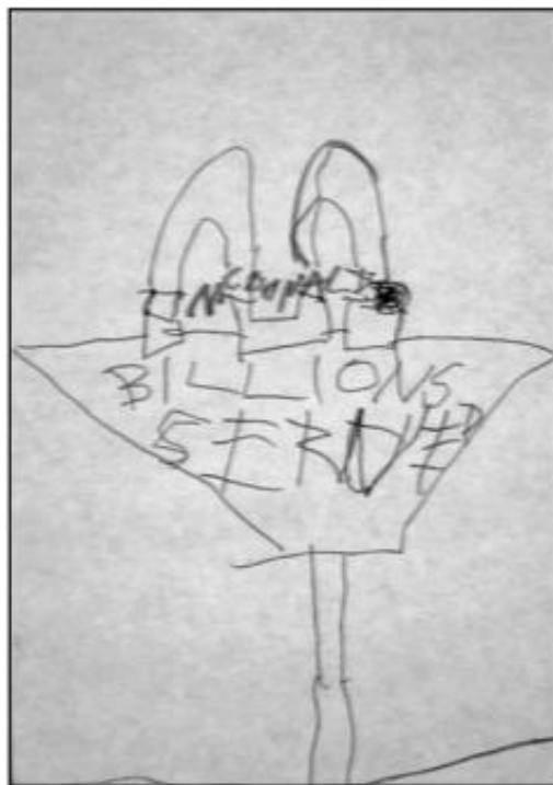
Slika 1. Crtež zgrade McDonald's-a (Emery, 2004.)

Emery (2004.) je u svom radu prikazala i napredak kod spomenutog dječaka u pogledu ponosa zbog svog postignuća koje je uspjela dobiti kod djeteta, a što je vrlo važno u socijalnom učenju odnosa. Nakon što je dječak nacrtao zgradu McDonald's-a, s jasno izraženim znakom i detaljno označenim linijama krova (Slika 1), terapeutkinja ga je upitala kako bi mogao doći do McDonald's-a kako bi jeo omiljenu hranu. Odgovorio je automobilom te da bi ga odvezla majka. Terapeutkinja ga je zamolila da nacrtaj automobil koji ide prema restoranu. Prvo je zabrinuto tražio igračku automobila kako bi ga mogao pogledati i nacrtati, no terapeutkinja ga je ohrabrila da nacrtaj svoj automobil i kako je sigurna da bi bio predivan. Dječak je nacrtao automobil (Slika 2) i majku s rukama na volanu te sebe na stražnjem sjedalu.