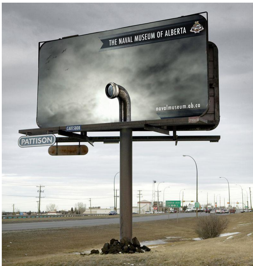
Slika 8 Billboard mornaričkog muzeja Alberta, SAD

U gerila marketingu koriste se brojni mediji za prenošenje željenih informacija (Levinson, 2013 ). Bilboardi na jednostavan način privlače pozornost ljudi na tvrtku te omogućavaju široj masi upoznavanje s proizvodom ili brendom. Ipak, jumbo plakati imaju puno mana. Danas su možda pretjerano korišteni pa samo oni vrhunsko izvedeni i drugačiji od drugih uspijevaju zaokupiti pažnju pojedinaca. Za dobar dizajn i jasnu, zanimljivu poruku mora biti odgovoran marketinški tim. Glavni cilj plakata ne može biti ostvarenje bolje prodaje, no oni mogu podsjetiti ljude na brend, odnosno proizvod. Ukoliko je plakat dobro dizajniran i efektan zasigurno će privući pažnju potrošača.