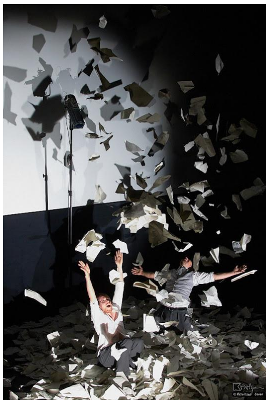
Slika 4: Motiv sreće