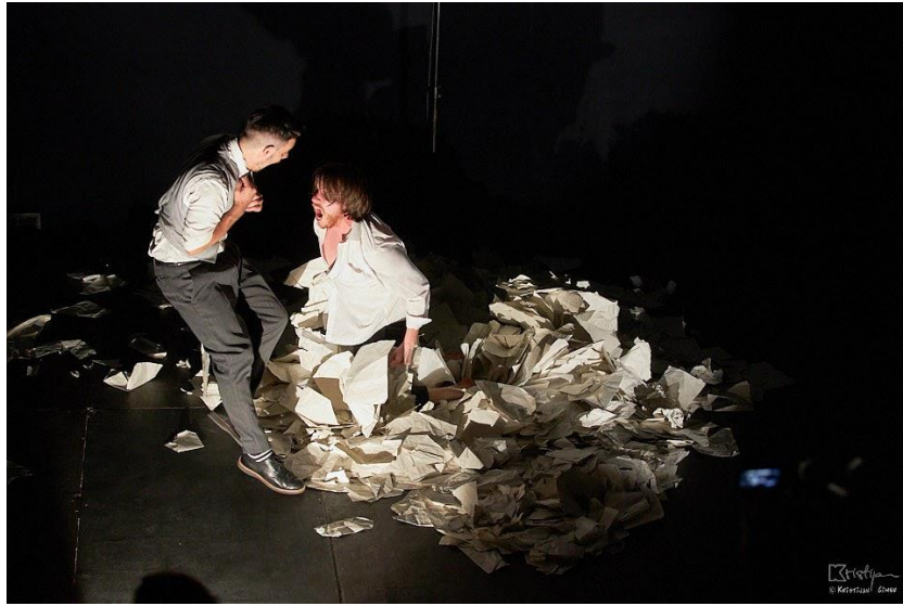
Slika 7: Upoznavanje Zanna i Protagonista

promjenu, preko papira. Kada ga Majka uzme u ruku, tu se sve završava. Tako da, da, nismo uspjeli zaokružiti cjelinu, ali vjerujem da smo bez obzira na to napravili odličan posao.