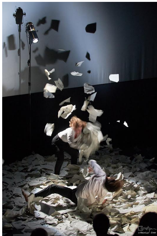
Slika 8: Majčin bijes