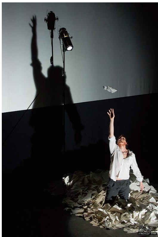
Slika 3: Motiv slobode