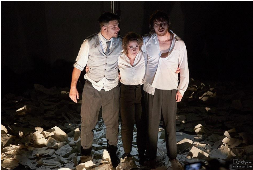
Slika 10: Kostimi

Prvo što smo planirali u vezi s kostimima bilo je nešto apstraktno jer su likovi i prostor takvi, pa bi imalo smisla te bi u takvoj atmosferi bilo sasvim opravdano. No s vremenom smo se udaljili od te ideje kako se proces nastavljao i mijenjao. Također, jedna od ideja bila je da Zann bude u potpunosti ogoljen, majka u odijelu i fraku (zbog početne ideje majke kao dirigenta koja Zanna upravlja mučeći ga) te Protagonist u jednostavnoj, skromnoj odjeći. No na posljetku je zbilja najviše smisla imalo staviti Zanna u crne hlače i bijelu košulju, bosog, budući da se nikada prije nije pomaknuo sa svog mjesta ili pokušao oduprijeti majci. Majka je bila u crnim cipelama i hlačama s bijelom košuljom. Kod nje pretežito prevladava crna boja, kao tamni dio podsvijesti, dok je Protagonist ono između. Crne hlače, bijela košulja te sivi prsluk i kravata. On je kao prijelaz između njih dvoje koji donosi neku vrstu ravnoteže cijeloj slici. Nismo tražili vremenski, već simbolički točne kostime i ja vjerujem da smo u tome uspjeli. Jednostavno, ali opet konkretno.