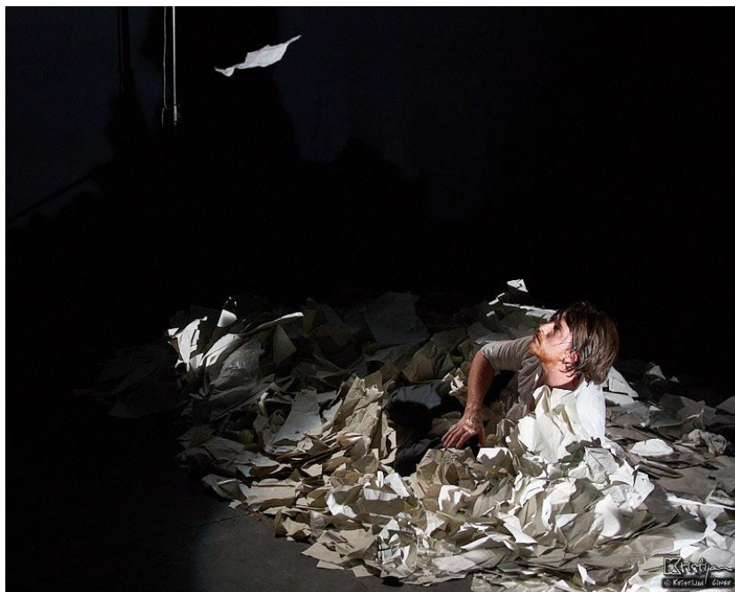
Slika 2: Motiv slobode