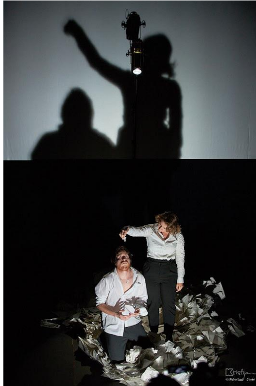
Slika 5: Potpuni izgled scene