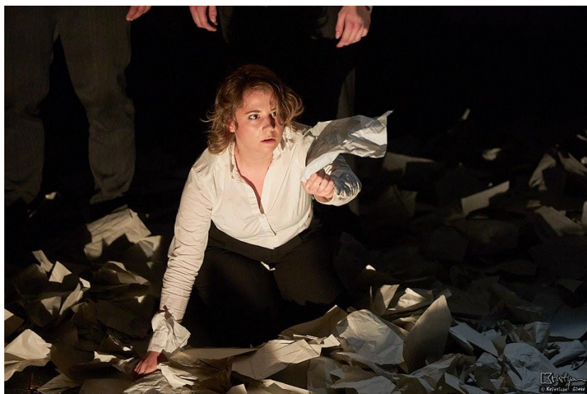
Slika 9: Trenutak vlastite spoznaje