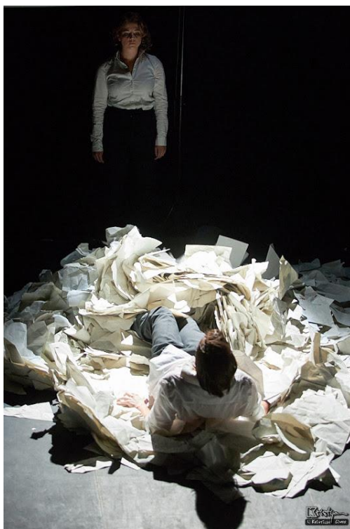
Slika 6: Majka izlazi iz mraka