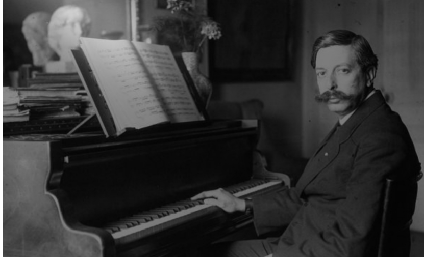
Slika br.1 Enrique Granados