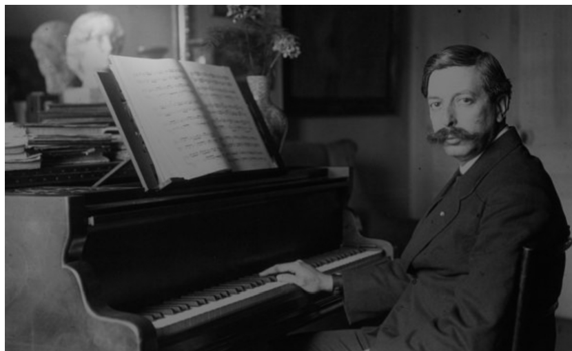
Slika br.1 Enrique Granados