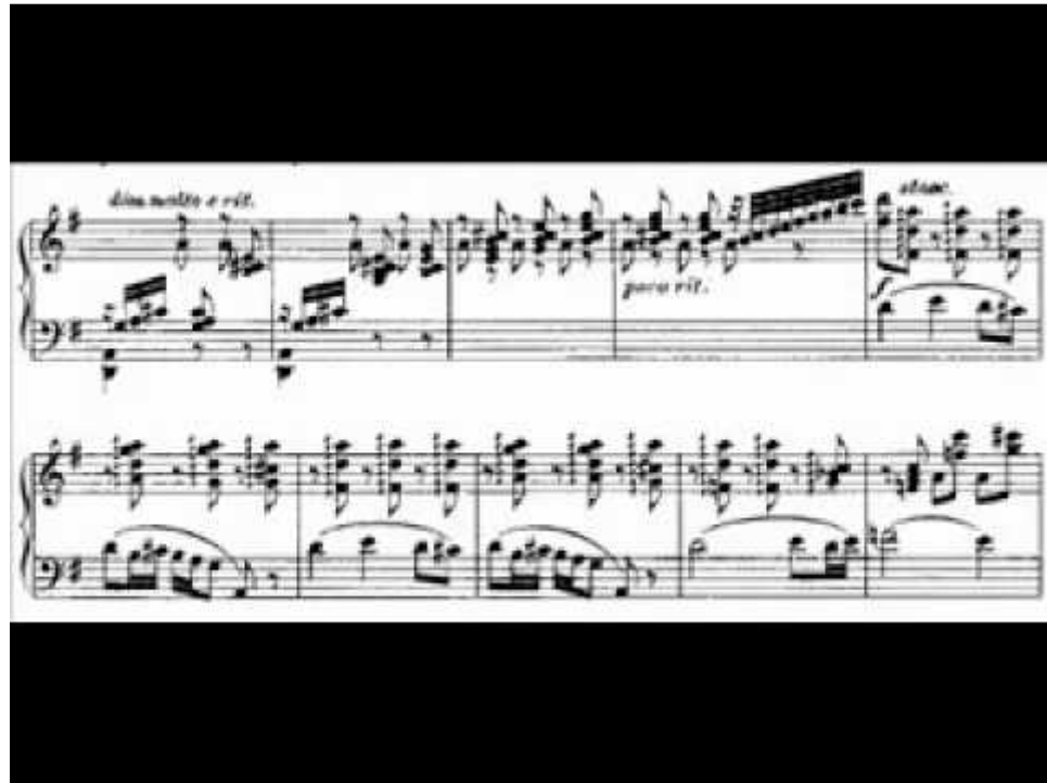
Slika br. 12 Primjer iz sedmog plesa pod nazivom „Valenciana“ (U primjeru se vode spomenuta arpeggia i passagea koja vodi do njih).