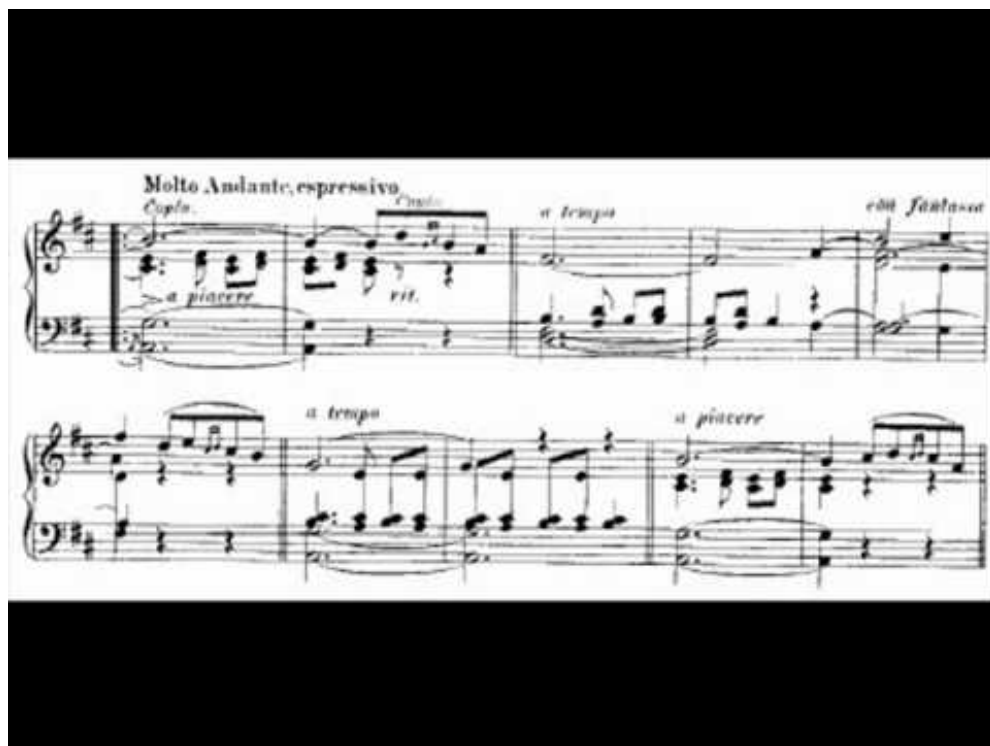
Slika br. 11 Prikaz dijela partiture iz šestog španjolskog plesa „Rondalla aragonesa“ (Izdvojen je posebno ekspresivan dio i detalji koji na trenutak stvaraju prizvuk fantazije.)