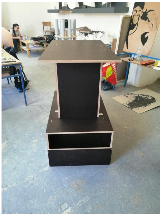
Slika 1. Skelet „Ex machine“, Ivan Kopp, drvo