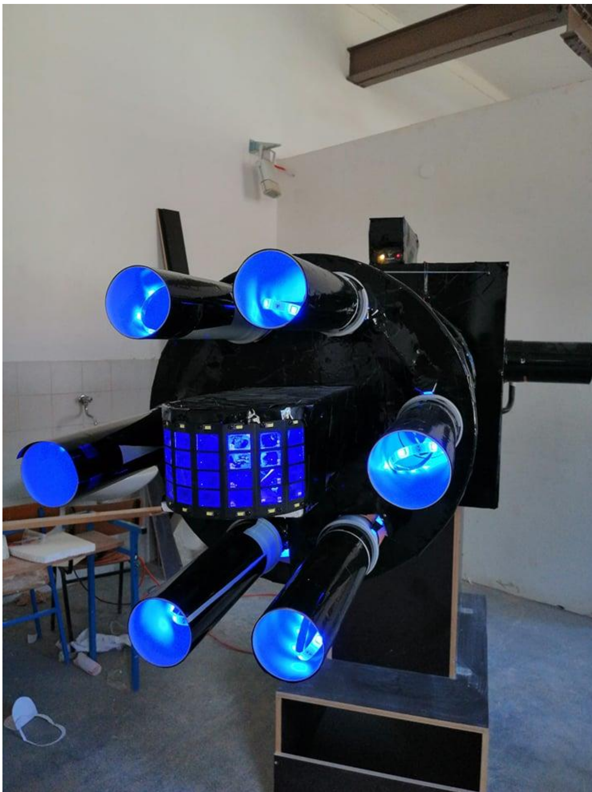
Slika 8. Plavi pogled sprijeda na rad „Ex machina“, Ivan Kopp