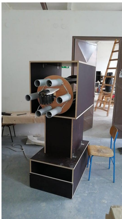
Slika 2. Skelet i top, Ivan Kopp, drvo, plastika, led svjetla, disko kugla