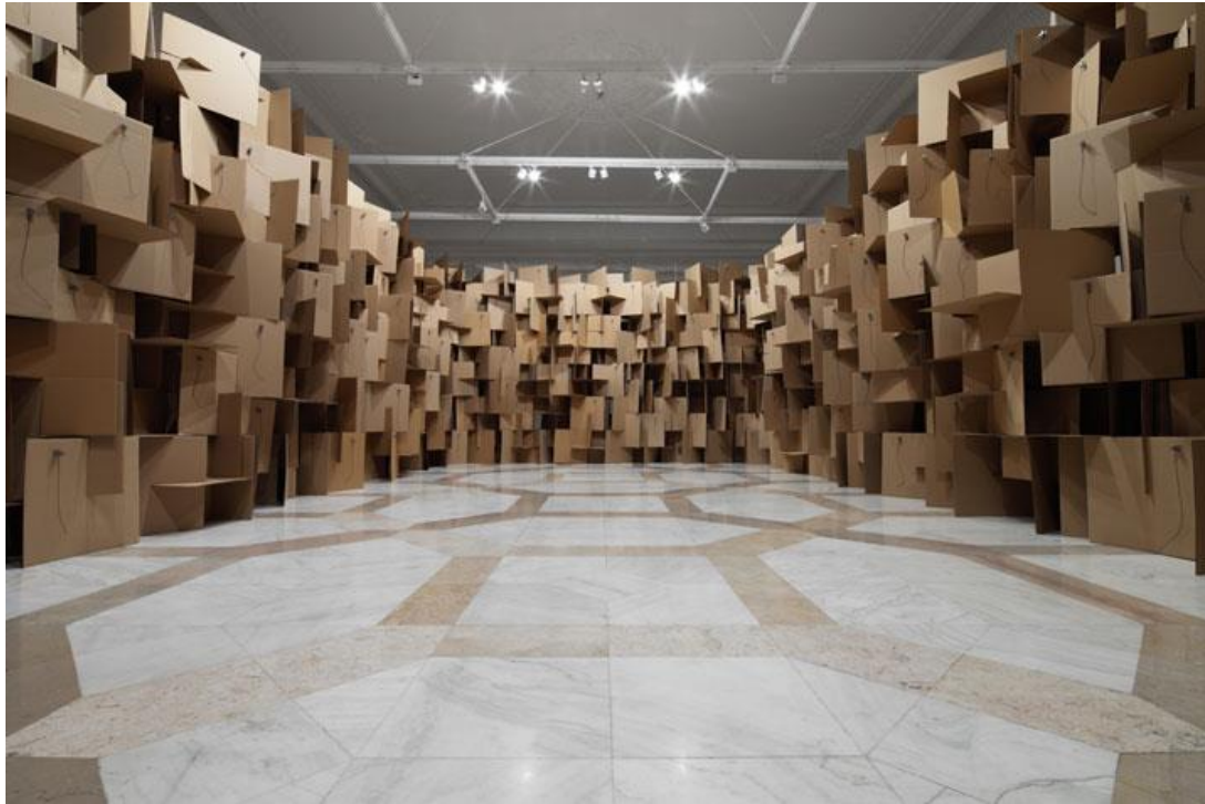
Slika 12. Zimoun, prostorno - zvučna instalacija 1