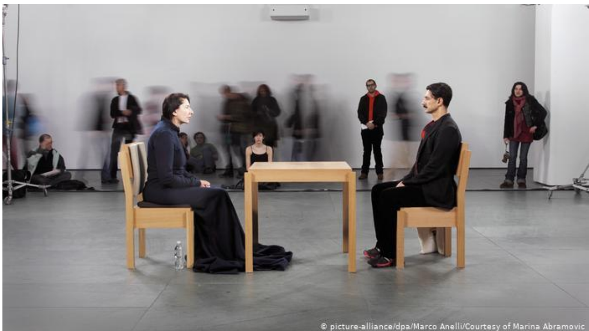
Slika 11. Marina Abramović, performans „Čistač“