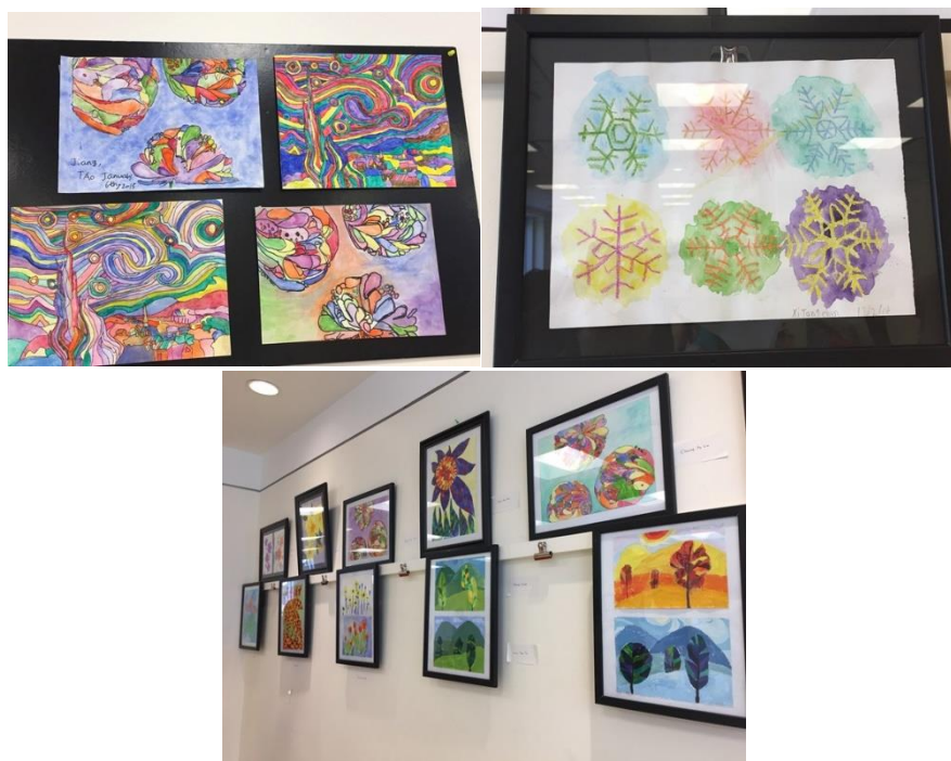
Slika 4. Izloženi radovi djece s teškoćama u razvoju, 2017.