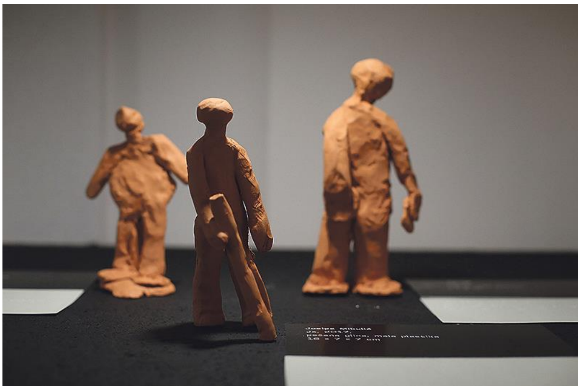
Slika 6. Rad djeteta s teškoćom vida – Luka Matković, glina, 2019.