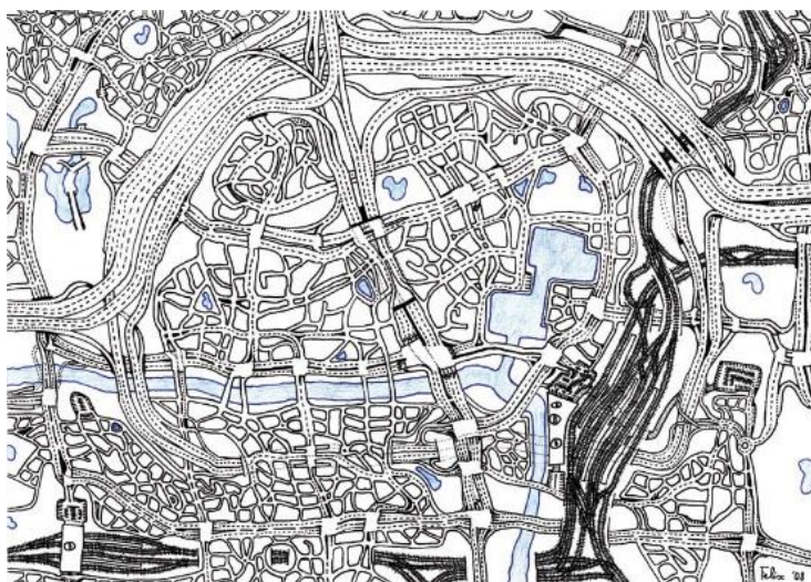
Slika 3. Primjer crteža autističnog djeteta, detaljnost i veliki obzir prema detaljima odraz su ovog crteža

Darovitost je sklop osobina koje omogućuju pojedincu da dosljedno postiže izrazito iznadprosječan uradak u jednoj ili više aktivnosti kojima se bavi, dok djeca s teškoćama u razvoju iznadprosječni uradak prikazuju na svoj način. Autistično dijete ima izrazitu nadarenost i iznadprosječno odrađuje određene zadatke za koje je nadareno. Ono je idealan primjer za art terapiju. Radovi djeteta s autizmom zaista nekada ostavljaju bez daha, komunikacija koja je odrađena uz pomoć boje, linije, crteža, skulpture, neverbalnim načinom izraz su darovitosti toga djeteta (Cvetković Lay i Sekulić Majurec, 2008: 15).