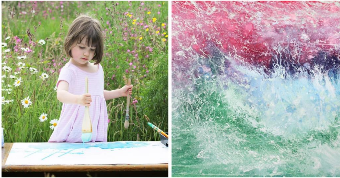
Slika 2. Primjer slike darovite petogodišnje djevojčice, akril