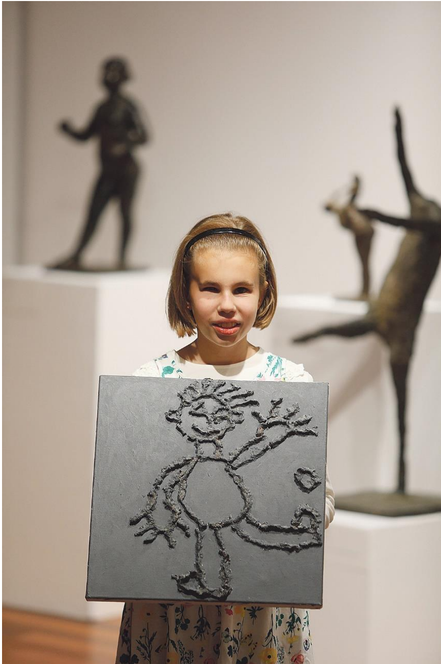
Slika 8. Rad djeteta s teškoćom vida, kombinirana tehnika, 2019.

“Mene to toliko razveseli kad vidim ovakve njihove male, a toliko kreativne i time velike ideje!” kaže Tanja. Čitava izložba prilično je šarena. Djeca dosta koriste boje u svom kreativnom izričaju, ali ne sva. Neki su radovi crno-bijeli, a njih su stvorili mališani s akromatopsijom” (Karmen Miletić, Tanja Parlov “Slijepu djecu pretvaram u male slikare i kipare”, 2019).