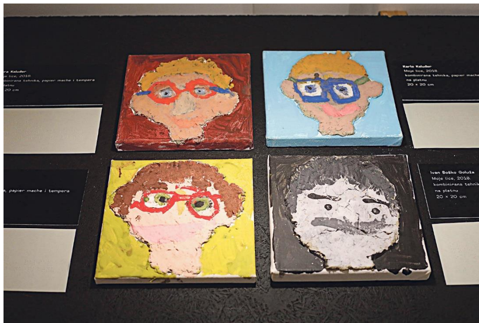
Slika 9. Radovi djece s teškoćom vida, kombinirana tehnika, 2019.

Prema Winneru djeca s darovitim sposobnostima u likovnoj umjetnosti posjeduju sva tri čimbenika darovitosti, prvi čimbenik je razvijanje sposobnosti prije vremena, drugi posjedovanje izrazite želje za svladavanjem, a treći karakteristična samouvjerenost u svemu što čine.