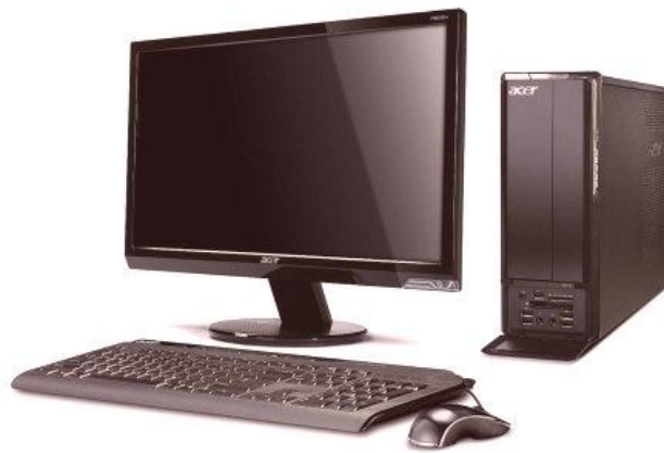
Slika 1. Prikaz stolnog računala i njegovih komponentata 1