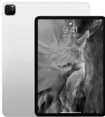
Slika 3. Tablet računalo iPad 3

Prvi moderan tablet kao vrsta računala pojavio se na tržištu 2010. godine. Do tada, rađeni su slični proizvodi koji nisu uspjeli na tržištu, tako da se kao prekretnica smatra predstavljanje Apple-ovog iPada kao modernog tablet osobnog računala koje je korisnicima pružalo sličnu upotrebu kao kod osobnih pametnih telefona. Tablet je vrsta računala koja se može usporediti s kombinacijom laptopa i pametnog telefona. Nije namijenjen za izvedbu složenih operacija kao stolno i prijenosno računalo, ali je idealan za korištenje u edukaciji. Neke škole u Republici Hrvatskoj u nastavni proces uvele su uporabu tableta, pomoću kojih učenici svladavaju nastavno gradivo kroz interaktivne sadržaje kao što su prilagođene igrice, razne alate, multimedijalne sadržaje (Lombar, 2015).