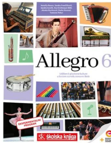
Slika 6. Digitalno izdanje udžbenika za nastavu Glazbene kulture za 6. razred. 6

Kao i većina predmeta tako su i predmeti Glazbene kulture i Glazbene umjetnosti doživjeli svoju digitalizaciju. Za sada u Republici Hrvatskoj u ponudi su digitalni multimedijski udžbenici nekoliko izdavača. Multimedijski udžbenici za Glazbenu kulturu i Glazbenu umjetnost bogati su audio i video sadržajem. Svaki od udžbenika u ponudi posjeduje određene načine za osobnu provjeru znanja kao što su kvizovi, kratki testovi, itd. Za većinu udžbenika internet nije potreban jer u sklopu samog udžbenika se nalaze audio i video sadržaji, međutim u slučaju udžbenika kao što je kod izdavača Profil Klett, potreban je internet jer se sadržaji omogućavaju na poveznici koja vodi na aplikaciju YouTube (Nuli, 2018).