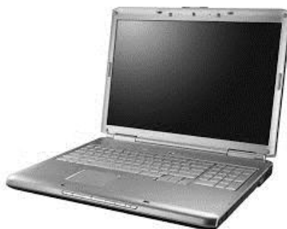
Slika 2. Prikaz prijenosnog računala/ laptopa 2

Prijenosno računalo nastalo je kao produkt potrebe korisnika da u bilo kojem trenutku mogu svoje računalo premjestiti odnosno transportirati na drugu lokaciju. Za razliku od stolnih računala, prijenosna dolaze u puno manjem i jednostavnijem obliku te zbog toga su manje zahtjevna u smislu obujma prostora. Komponente su spojene u jedan uređaj te je iz toga razloga izgled i dizajn vrlo atraktivan. Performanse su inače slabije nego kod stolnih računala upravo zbog veličine i odličan je alat za izvršavanje jednostavnijih operacija te se zbog toga upotrebljava u nastavnim procesima (Galašev i sur., 2019).