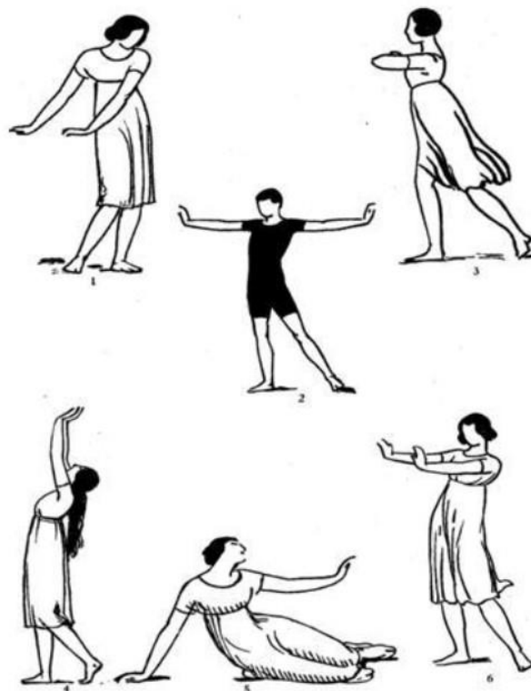
Slika 4 Šest faza Dalcrozeove euritmike

instrumenta, a glazbeno opismenjavanje i učenje ritma i mjere odvija se preciznim pokretima glave, ruku i nogu. Jedinicu mjere predstavlja četvrtinka na kojoj se gradi ritam, a svaki pokret ruku ima drugačiju vrijednost četvrtinke ( 1/4 , 2/4 , 5/4 , 6/4 ). Primjerice, u 2/4 mjeri ruke se na prvoj dobi nalaze u stavu prema dolje, a na drugoj prema gore (iznad glave). U 3/4 mjeri, s obzirom na dobe, položaj ruku jest dolje uz tijelo, bočno s obje strane tijela i na trećoj dobi podignute ruke iznad glave. Još jedan pokret uvodi se u 4/4 mjeri gdje se s obzirom na broj dobe ruke redom nalaze u stavu spuštene uz tijelo, na drugoj dobi ispred tijela; zatim sa svake strane tijela i posljednje iznad glave pojedinca (Novak, 2019).