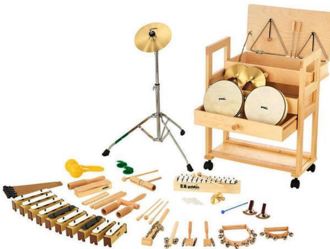
Slika 1 Orffov instrumentarij

Još jedna, od mnogih prednosti grupnog sviranja za djecu, pogodnost je instrumentarija za improvizaciju. Po Orffovom Schulwerku, učitelj iznese glazbeni problem i očekuje od učenika da korištenjem mašte improvizira svoja rješenja, kroz tehniku pitanje – odgovor. Sviranje može biti istraženo i kroz igre. Jedna od mogućih igara koja može biti uključena u Orffovu učionicu je igra s vrećom graška. U toj igri učitelj svira ksilofon, a učenici se dobacuju s vrećom graška, u ritmu učiteljevog sviranja. Onaj tko ostane s vrećom u ruci kada učitelj prestane svirati, mora smisliti i improvizirati primjer na ksilofonu. Postava Orffove učionice potiče djecu da budu neovisni istražitelji i aktivni sudionici grupe. Svaka individua uči surađivati i pridonositi ansamblu s pouzdanjem u svoje mogućnosti i poštivanjem tuđih. Dakle, Orffov Schulwerk osigurava individualni razvoj i glazbeni rast za svako dijete. Poboljšava smisao za ritam i sluh, kinesteziju, govornu i pjevačku artikulaciju i ukupni kapacitet za stvaranje glazbe (1964, Nash prema Novak, 2019).