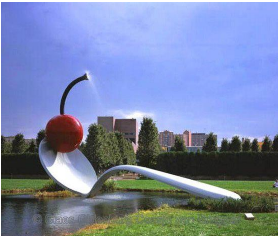
Claes Oldenburg: „Žlica i trešnja“ 1988. Minneapolis, SAD

Claes Oldenburg (rođen 28. siječnja 1929., Švedska) pop-art kipar poznat po svojim predimenzioniranim skulpturama svakidašnjih objekata. Oduvijek ga je interesirao „ street life “ odnosno sve što možemo vidjeti u velegradskim ulicama, izlozi, grafiti, plakati, reklame, pa čak i smeće. Njegovi radovi pripadaju neodadaističkom smjeru pop-arta, radi asemblaže,instalacije i hepeninge u kojima na humorističan način provocira tipične predodžbe,simbole i proizvode američke potrošačke kulture. Sam umjetnik kaže da je humor veoma bitan element u njegovim skulpturama.