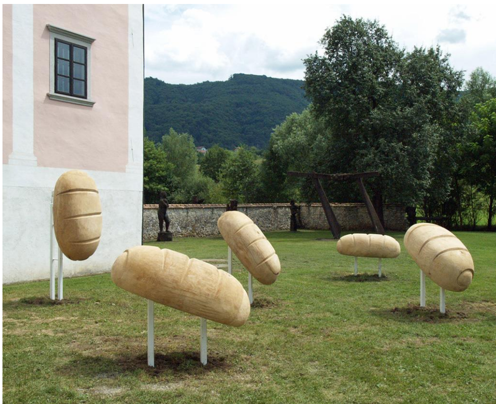
Denis Kraškovič: „Dobrota“ 2012., Kostanjevica, Slovenija

Denis Kraškovič (23.ožujak 1972.) hrvatski je suvremeni kipar koji je diplomirao na Akademiji likovnih umjetnosti u Zagrebu 1994. Poznat je po svojim predimenzioniranim skulpturama gdje vrsno pokazuje poznavanje kiparskog zanata. Što još možemo isčitati u njegovoj umjetnosti jest ljubav prema prirodi te sklad s njom samom. Izrađuje skulpture životinja, također slike i crteže. Prvi značajni radovi bili su skulpture pingvina, krokodila i tuljana te naravno kit koji se nalazi u Zagrebu ispred Aquarius kluba u Zagrebu. Sam umjetnik kaže da gleda na pozitivne aspekte života te to želi primijeniti na svoju umjetnost, također i dozu humora. Njegove skulpture su veoma jednostavne forme, a crteži su plošni. Od primjera navela bih njegovu javnu skulpturu imenom „Dobrota“ koja se nalazi u Sloveniji, te javnu skulpturu kita u Zagrebu.