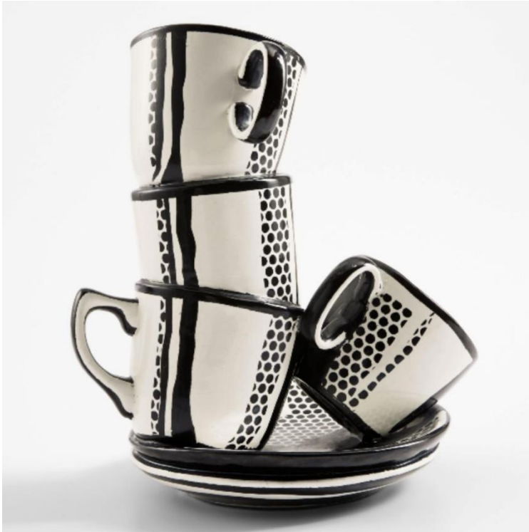
Roy Lichtenstein, keramičke šalice #7, bojana keramika, 1965.