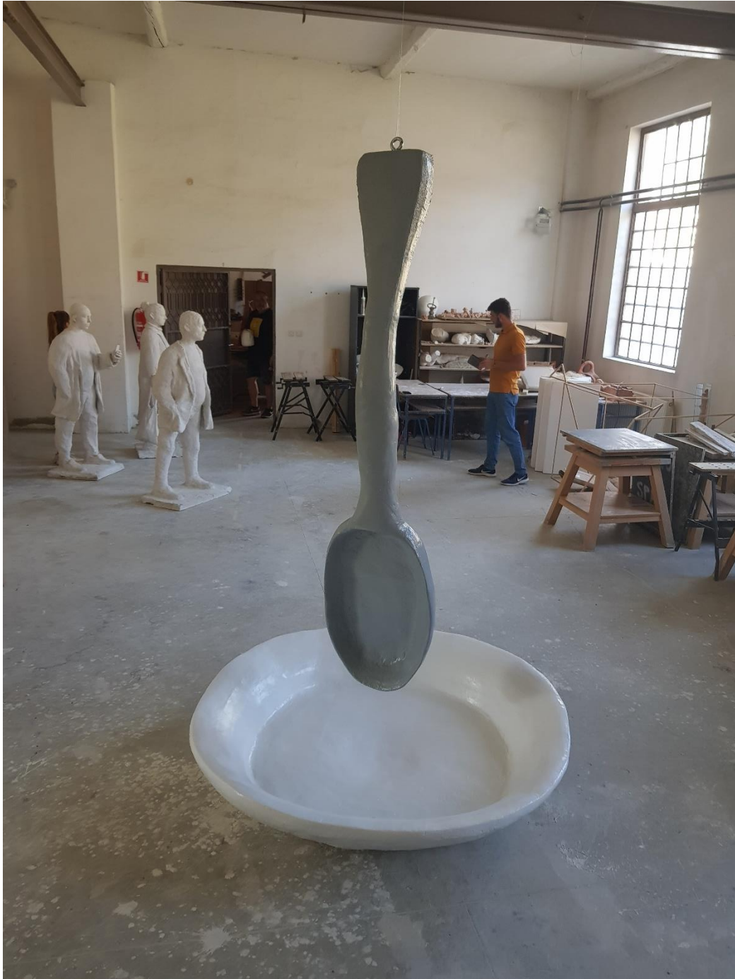
Proces 4. (gotov rad)