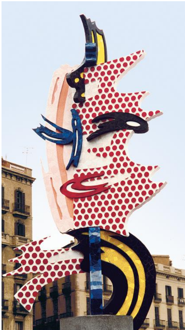
Roy Lichtenstein: Barcelona head, 1992.

Slično je djelovao Roy Lichenstein koji je slikao i uvećavao isječke stripova, također je radio i skulpture. Od primjera bih navela njegovu skulpturu koju je radio za Ljetne olimpijske igre održane u Barceloni 1992., te keramičke šalice. Skulptura prikazuje apstraktno lice u njegovom stilu, izrađeno od betona i keramičkih pločica, te točkastom strukturom imitira rastere novinske fotografije.