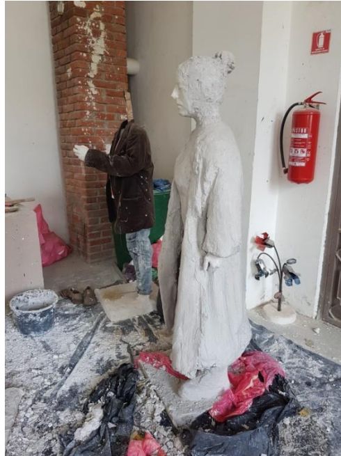
Slika 10. Druga faza izrade