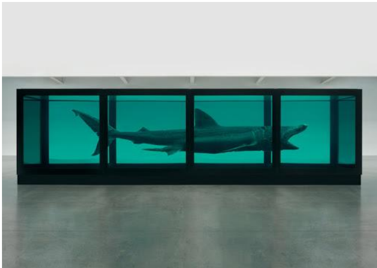
Slika 3. Damien Hirst, Fizička nemogućnost smrti u umu nekoga živog , 1992.

Na primjer, suvremeni umjetnik Damien Hirst u svojim radovima upotrebljava uginule životinje. Ima cijelu seriju radova u kojima su mrtve životinje smještene u formalinsku otopinu unutar velikih metalno-staklenih konstrukcija. U njegovu najpoznatijem radu Fizička nemogućnost smrti u umu nekog živog stavlja uginulog morskog psa u akvarij. Ovaj se rad, koji u sebi ima uginulu životinju, danas smatra jednim od najutjecajnijih radova suvremene umjetnosti. Za Hirstove ready-made mrtve prirode postavlja se pitanje gdje se nalazi granica morala. Umjetnik se inače bavi temom smrti te ljudskim shvaćanjem ili neshvaćanjem te pojave, kao i vlastitim poimanjem i prihvaćanjem smrti.