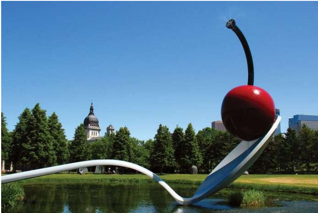
Slika 6. Claes Oldenburg i Coosje van Bruggen, Spoonbridge and Cherry , 1985. - 1988; Vrt skulptura Walker Art Centra u Minneapolis, Minneapolis, Minnesota

Kada govorimo o monumentalnosti neizostavan je američki pop-art kipar Claes Oldenburg najpoznatiji po svojim divovskim skulpturama svakodnevnih predmeta. Godine 1962. izložio je inačicu svoje trgovine u kojoj se nalaze goleme skulpture (kornet za sladoled, hamburger i kriška torte). Rad Spoonbridge and Cherry (1985. – 1988.) predstavio je kao predimenzioniranu skulpturu predmeta iz svakodnevne upotrebe specijalno za retrospektivu njegova rada 1995. godine u Guggenheim muzeju u New Yorku.