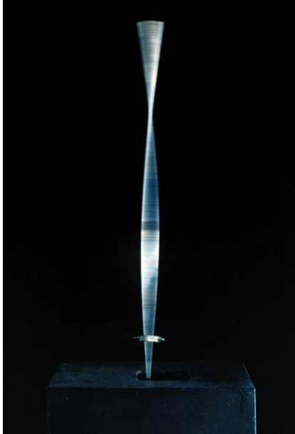
Slika 7. Naum Gabo, Kineticka konstrukcija 1919-1920