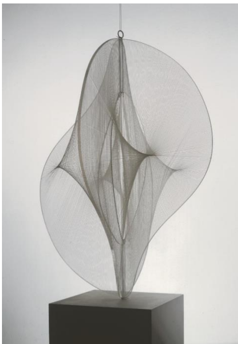
Slika 8. Naum Gabo, Linearna konstrukcija br.1 1970-1

Konstruktivizam je čisto tehničko majstorstvo i organizacija materijala. Objekt treba biti promatran u cijelosti i stoga neće biti uočljiv u stilu, već samo kao