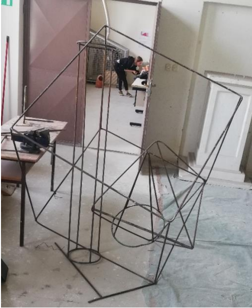
Slika 14. Proces rada