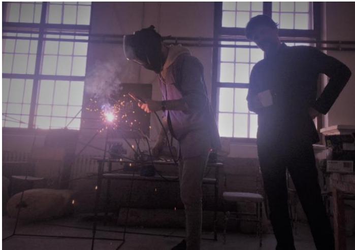
Slika 16. Mentor i ja prilikom izrade završnog rada