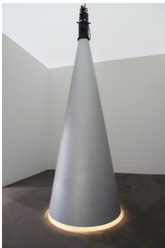
Slika 4. Goran Petercol, Inter(aktiv) 2009

Također možemo spomenuti i hrvatskog velikana kiparstva i slikarstva umjetnika Gorana Petercola, rođen je 1949. godine u Puli. Kao i u mojem slučaju umjetnost Petercola bazira se na svjetlošću i njenom nedostatku. Na njegovoj izložbi skulpture naziva „spotlights“ upravo zbog toga što u sebi imaju reflektor koji reproducira svjetlost ili je instalacija prošupljena pa kroz nju prolazi (prirodna, umjetna) svjetlost. Petercol izlaže svjetlost (svjetlosni snop zaustavljen plohom u prostoru), a izvor svjetlosti je samo medij, oruđe. Naime Petercolove instalacije u većini slučajeva zahtijevaju odsustvo dnevne svjetlosti, stoga se izložbe Petercola mogu percipirati tek po sunčevom zalasku. Instalacije korespondiraju sa vanjskim svijetom. Također i vremenske neprilike (kiša, snijeg) utječu na teksturu metalnih ploha same svjetlosne instalacije. U zavisnosti od odabira materijala koji uvjetuju ponašanje svjetla umjetnik „kroji“ plohe koje su nastale prožimanjem površina u obasjanosti i tame. Svjetlost je prvi oblik koji modificira prostornu percepciju. Jedan od preduvjeta za sjenu je svjetlo i nekakva prepreka preko istog, to može biti prostorni element ili sam posjetitelj izložbe. U retrospekciji Petercolovih „Light-art“ skulptura prepoznata je i kao analitička povijest. Također umjetnik je sklon redukciji artistskih intervencija i sredstava u kojem estetski učinak umjetniku nije u prvom planu.