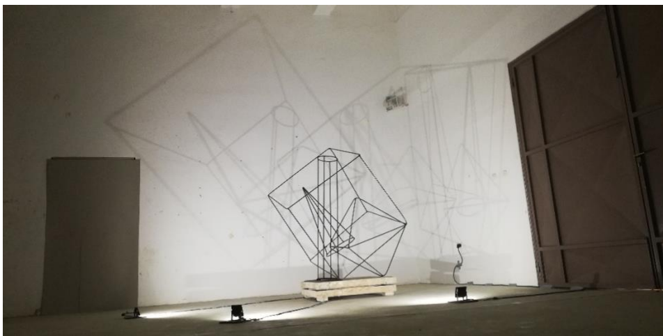
Slika 18. Izloženi rad