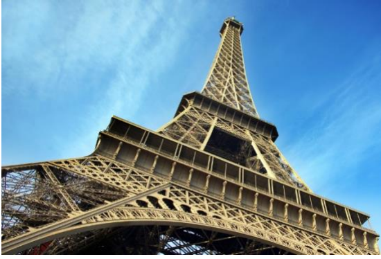
Slika 10. Eiffelov toranj, Gustave Eiffel

Metalna konstrukcija Eiffelovog tornja ima masu 7 300 tona, a ukupna masa je 10 100 tona. Pri takvoj težini i visini nije bilo mjesta za pogreške, a upravo je to najvažniji dio izrade kod umjetničkih djela- razmišljanje i skiciranje u svim uvjetima.