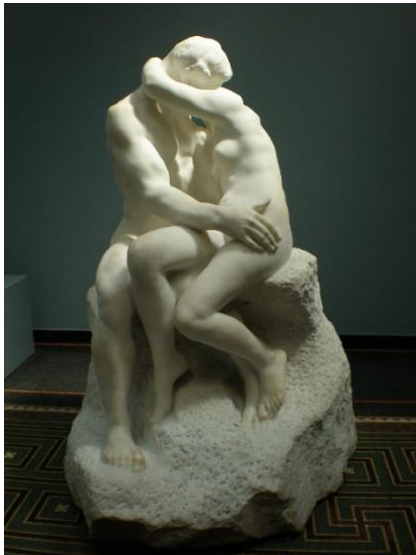
Slika 3. Auguste Rodin, Poljubac 1882.

danas. Skulptura predstavlja nagog muškarca koji zamišljen sjedi s rukom na bradi i često se koristi za predstavljanje filozofije. Rodin je dobio narudžbu od Muzeja dekorativnih umjetnosti u Parizu da izradi monumentalni ulaz u muzej. Poznata pod nazivom Vrata pakla predstavljaju jedno od najpoznatijih Rodinovih djela. Vrata pakla nadahnuta su Danteovim Paklom. Rodin nikada nije završio Vrata pakla ali su mu ona poslužila kao ishodište za veliki broj manjih komada od kojih je napravio samostalna djela, među najpoznatijim su Mislilac i Poljubac. „Skulptura, u užem smislu, trodimenzionalni objekt koji ima likovna svojstva (likovno obrađena površina, volumen, masa, materija, stvarni i virtualni prostor). U širem smislu, skulptura je objekt, skup objekata, prostorna instalacija objekata ili bilo koji fenomen nastao evolucijom ili revolucijom tradicije i discipline skulpture, odnosno odlukom umjetnika da ga tretira kao skulpturu. Umjetnost skulpture je diskurs, a to znači povijest, sistem i praksa umijeća stvaranja trodimenzionalnih objekata.“ 1 Prošupljena masa skulpture nastaje potpunim prolaskom prostora kroz masu skulpture. Prostor tada slobodno struji, a volumen ga okružuje i obavija. Interakcija prostora i mase je intenzivna; prostor koji prolazi kroz masu jednako je važan kao i sama masa te je prostor sastavni dio skulpture.