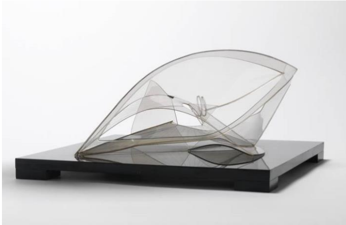
Slika 9. Naum Gabo, Spiralna tema 1941

proizvod industrijske narudžbe. Naum Gabo i njegov brat Antonie Pevsner su imali sklonost i najveći utjecaj ka modernoj skulpturi.