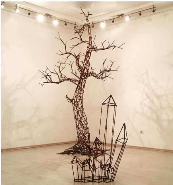
Slika 1.Nikola Vudrag, Drvo i kristali

Ideja moga završnog rada je napraviti prostornu skulpturu pomoću metalne konstrukcije i umjetnog svjetla. Također bih spomenuo jednog suvremenog umjetnika i kipara od kojega sam dobio inspiraciju, a on je mladi hrvatski kipar Nikola Vudrag. U jako kratkom vremenu je zbog svoje kiparske kreativnosti zadobio pažnju cijeloga svijeta. Svoje skulpture radi od metalnih šipki, odnosno metalnih ploča te u nekim skulpturama koristi se i integriranim svjetlom. Također sam u pisani dio rada uvrstio poneke umjetnike kako bih mogao preciznije pojasniti povezanosti svjetla i sjene u umjetnosti točnije u skulpturi. Također sam se osvrnuo i ka arhitekturi u kojoj se koriste metalne konstrukcije, te takva građevina izgleda kao prostorni crtež što je i prvobitna ideja moga rada.