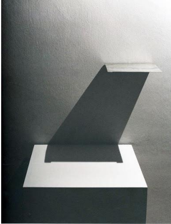
Slika 5. Goran Petercol, Sjene 2002