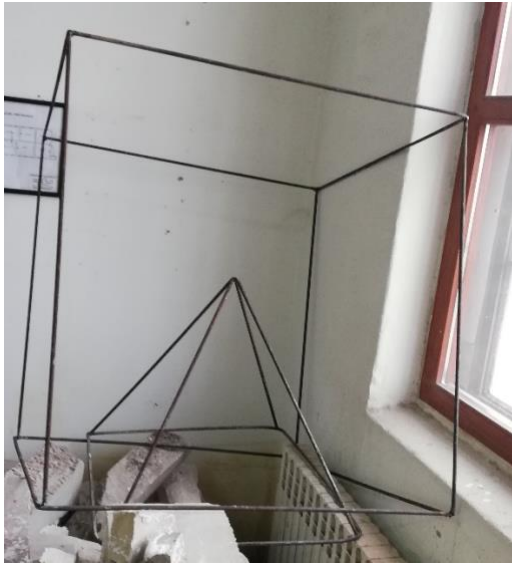
Slika 12. Kocka i piramida