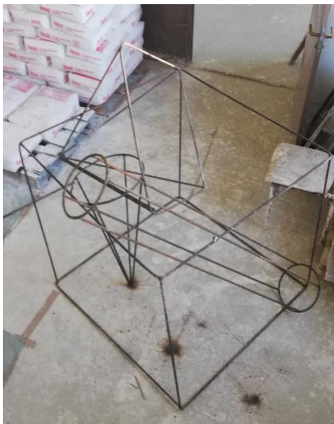
Slika 13. Spojeni svi željeni oblici