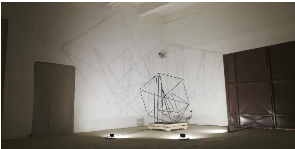
Slika 17. Izloženi rad

rada i samog prostora u kojem je izložena. Išao sam na inter-medijalnost rada, odnosno rad koji se sastoji od više različitih medija, a tu su uključeni metal, galerijski prostor i samo svjetlo. Sama skulptura se sastoji od metalnih šipki (armature), a prateća skulpture su 3 reflektora bez kojih bi skulptura bila nepotpuna. Strast prema skulpturi od metala mi je došla u prvom semestru 3. godine fakulteta na kolegiju „obrada metala“ koju mi je predavao doc. art. Dejan Duraković. Ideja mog rada je da to nije samo jedna statična kompozicija iz jedne točke gledišta, već kako se skulptura obilazi tako se i kompozicija rada mijenja. Također ovaj rad je tek prvi u nizu serija koje planiram kroz budućnost napraviti.