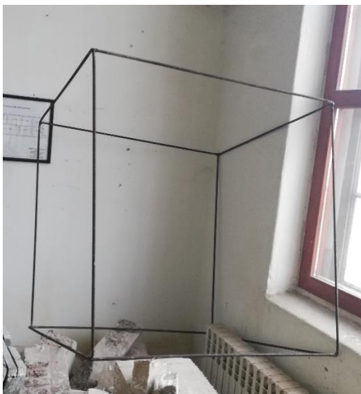
Slika 11. Početak izrade završnog rada

Nakon istraživanja, skica i promišljanja dolazim na ideju da bih za medij, u realizaciji završnog rada, mogao koristiti metal. Nakon nabave metalnih šipki promjera od jednog centimetra sa istih sam prvobitno skinuo sloj koji je oksidirao (zahrđao) kako bih spriječio ostatak oksidacije. Šipke sam izbrusio brusnim papirom. Nakon brušenja, metalne šipke mjerim metrom na određene dimenzije te ih režem, a po potrebi ih i savijam u oblik kružnice. Svako geometrijsko tijelo (kocka, piramida, valjak, stožac) prvo sam zasebno sastavio varenjem pomoću aparata za zavarivanje. Nakon što sam bio zadovoljan izgledom geometrijskih tijela počeo sam ih slagati u jednu cjelinu za početak povezivati ih pomoću metalne žice kako bih dobio realizirani privid zamišljene skulpture u prostoru. Slijedeći korak je bio zavariti svaki spoj gdje se šipke dodiruju i time omogućiti stabilnost, monumentalnost i čvrstoću rada. Rotiranjem rada smanjio sam broj dodirnih točki sa tлом te sam zavario dodatne dvije šipke kako bi rad bio stabilan. Brusilicom sam izgladio sve zavarene spojeve. Crnim sprejom nanio sam 2 sloja boje tako da rad može stajati i izvan prostorije, a da vremenski uvjeti nemaju utjecaj na skulpturu. Boju nisam nanio samo zbog vremenskih uvjeta već i zbog samog koncepta svjetla i sjene. Na reflektore sam ugradio kabel električne instalacije kako bi se svijetla mogla spojiti na utičnicu od 220 volti te time proizvoditi jedini izvor svjetlosti u prostoru uperen u skulpturu.