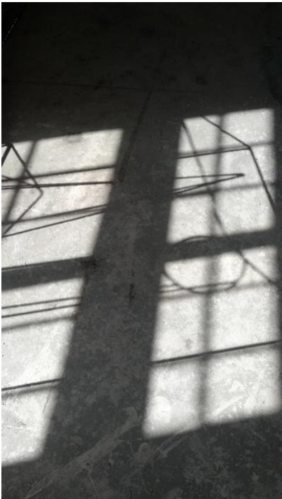
Slika 15. Sjena skulpture