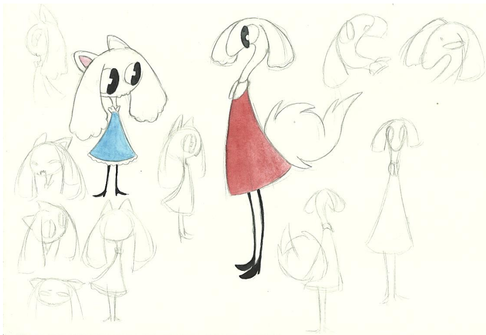
Slika 4 Skica XI

Osim karaktera samog lika one određuju i ton priče, prate razvoj likova te ilustriraju njegov odnos s drugim likovima. Možemo reći da su one simboli kroz koje karakteriziram likove i njihove odnose.