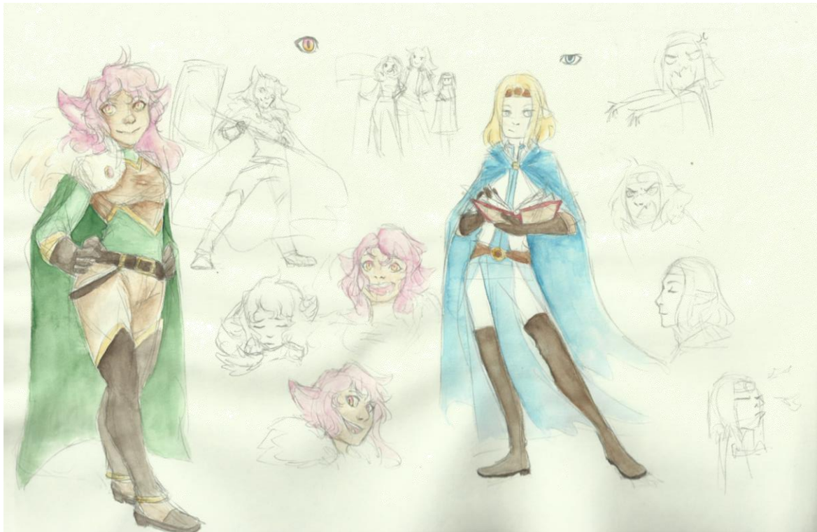
Slika 9 Skica X