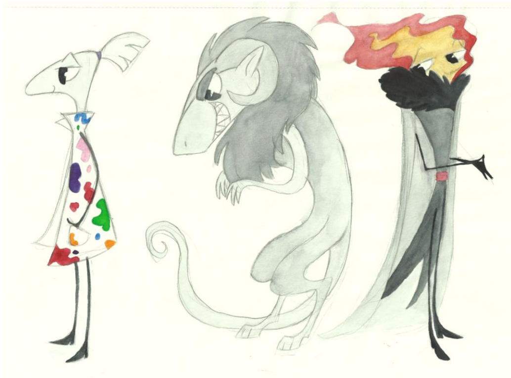
Slika 1 Skica XIII

Takav način izgradnje likova možemo primijetiti i na likovima iz zbirke skica koje čine ovaj završni rad (Slika 1). U svakom liku prepoznamo nekoliko geometrijskih i slobodnih oblika od kojih su građeni, te su na njih inkorporirani detalji kako bi se definirali i poprimili jasan vizualni izgled.