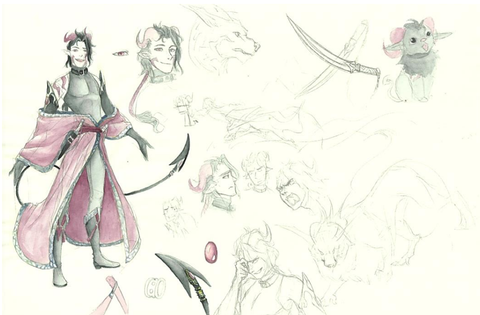
Slika 6 Skica II

Na slikama 5 i 6 vidimo dva lika: ženski i muški. Ženski lik obiluje bijelom bojom s plavim detaljima dok u dizajnu muškog lika dominira crna boja s bordo crvenim detaljima. U ovom