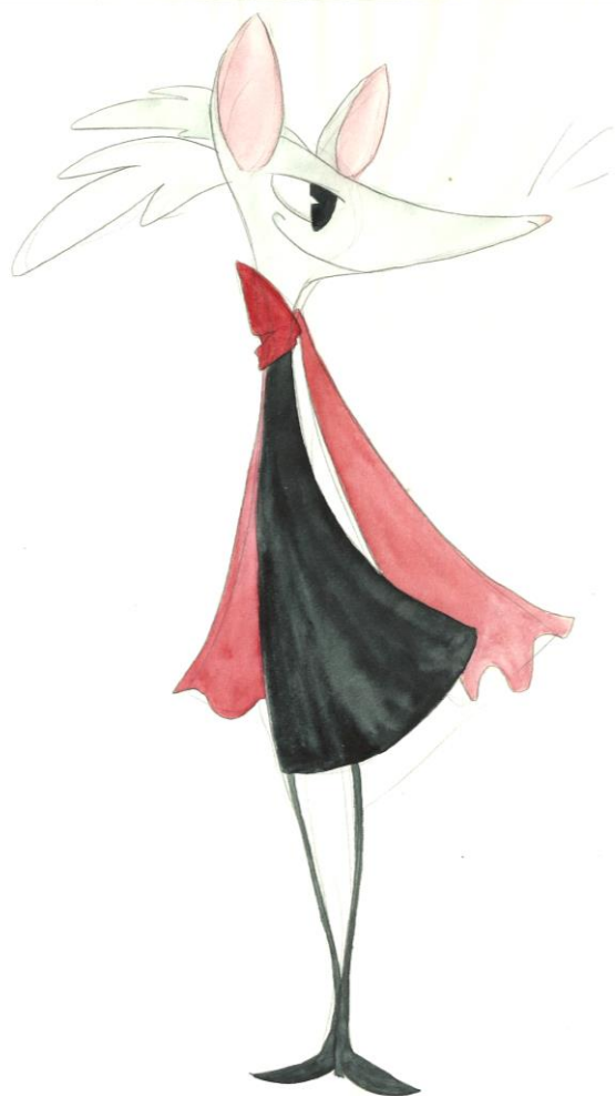
Slika 10 Skica XVIII