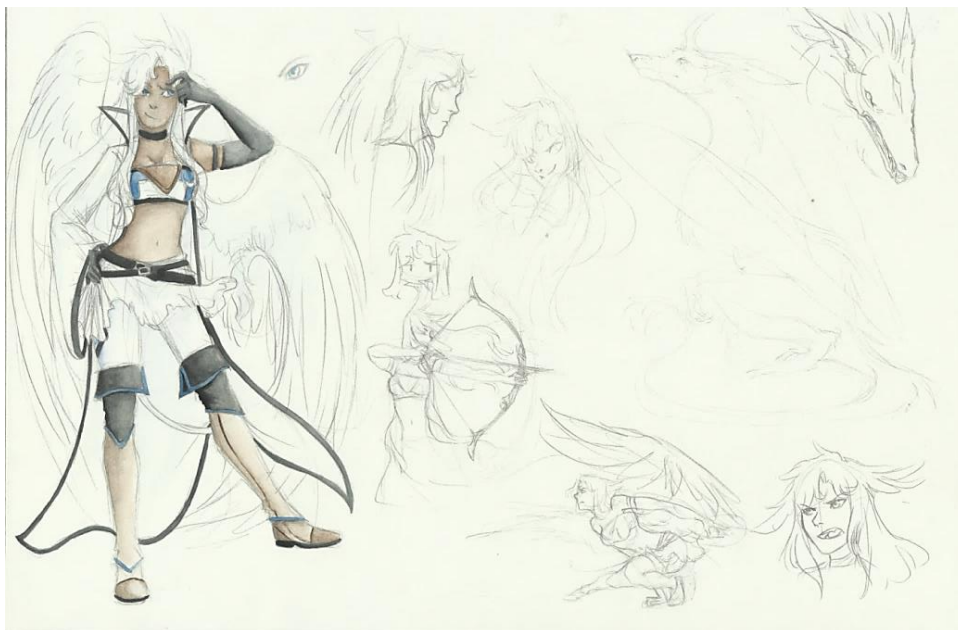
Slika 5 Skica I

suprotnosti u njihovim osobnostima, ali prisustvo crnih detalja te sličnih oblika u njihovom dizajnu sugerira određenu dozu bliskosti. Ove pojedinosti stvaraju vezu koja sugerira da likovi pripadaju istom djelu te da u tom djelu pripadaju istoj skupini; u ovom slučaju se radi o skupini glavnih likova. Ovi likovi imaju mnogo zajedničkih interesa, no razlikuju se po svojoj zrelosti i pogledu na svijet što se odražava i u njihovom vizualnom dizajnu.