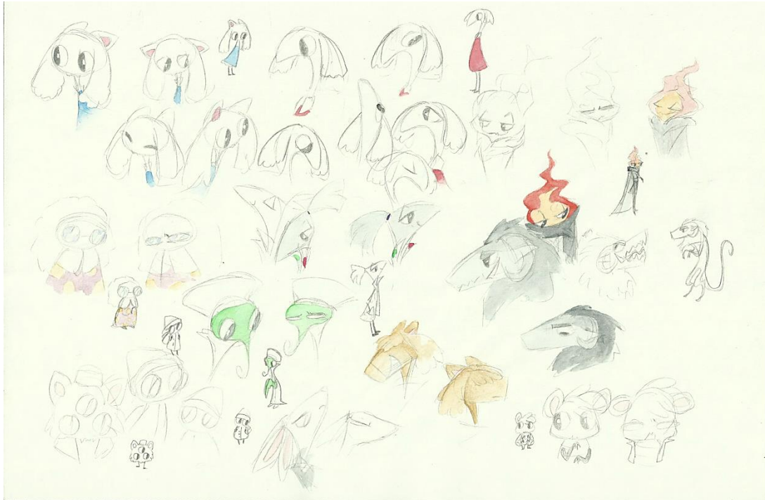
Slika 2 Skica XIV

se te promjene pojavljuju. Ovakva studija lika pomaže nam definirati o kakvoj se točno osobnosti radi; je li lik povučena osoba čiji se osjećaji odražavaju u blagoj promjeni ekspresije ili se radi o liku koji će nam vrlo glasno predočiti svoje psihičko stanje?