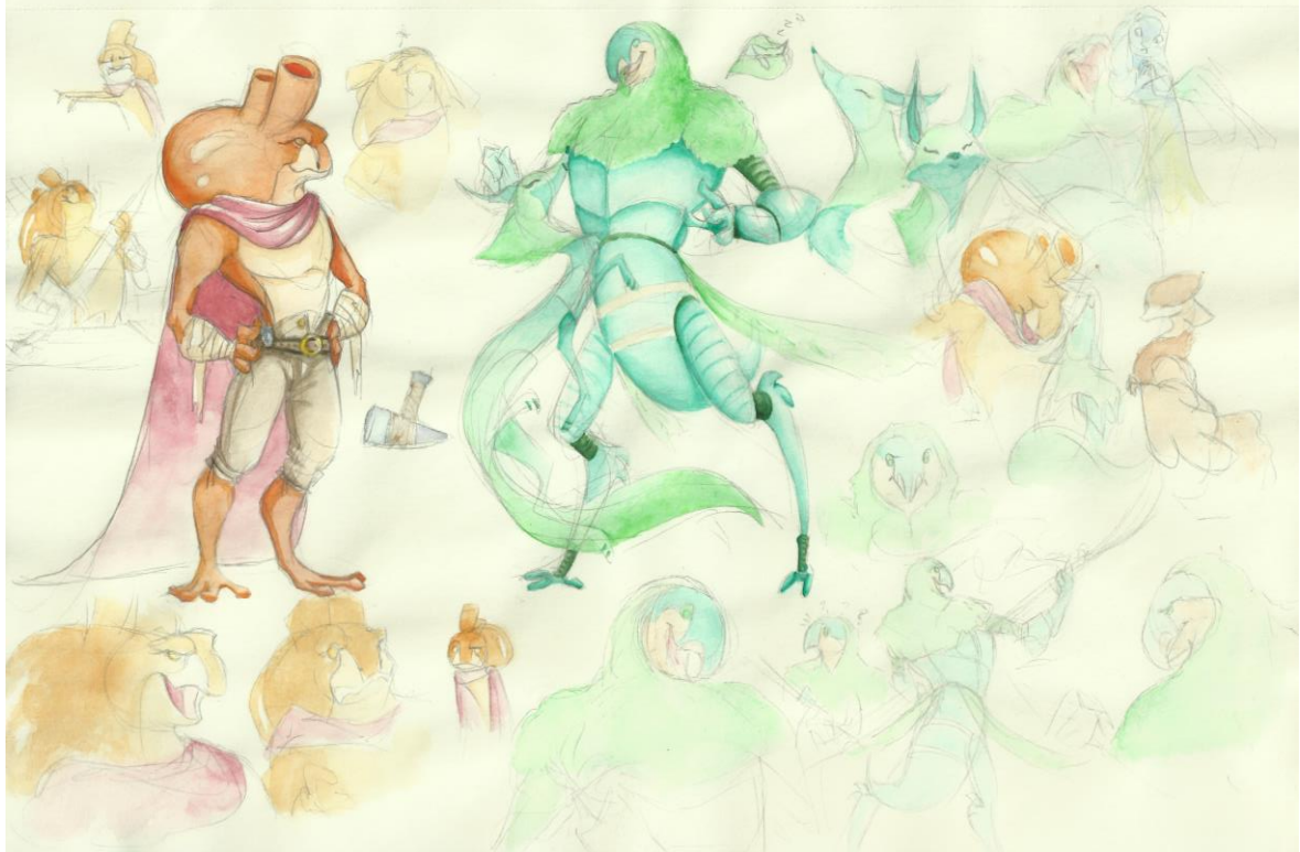
Slika 8 Skica XXI