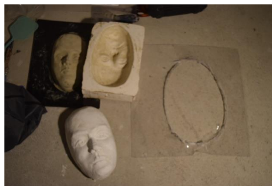
Fotografija 4,5,6,7 – proces izrade portreta