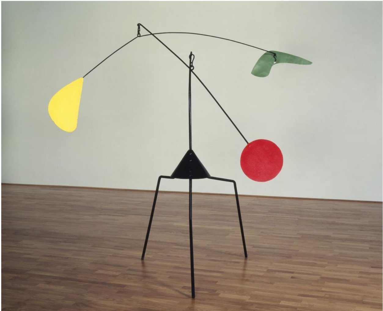
Fotografija 3, Mobil A. Caldera

Mobili, naziv za apstraktne objekte i konstrukcije (najčešće od metalnih dijelova i žice), sastavljene od uravnoteženo ovješanih pomičnih dijelova koji stvaraju promjenljive prostorne odnose i stalno se njišu pod utjecajem strujanja zraka, proizvodeći često zvukove. Pojam mobil uveo je M. Duchamp, opisujući apstraktna pokretna djela koja je u Parizu 1932. godine izložio američki kipar A. Calder. Izradba mobila učestalija je u SAD-u nego u Europi. U Hrvatskoj su kipari V. Bakić, I. Kožarić i Z. Lončarić izrađivali plastiku s elementima mobilne skulpture.