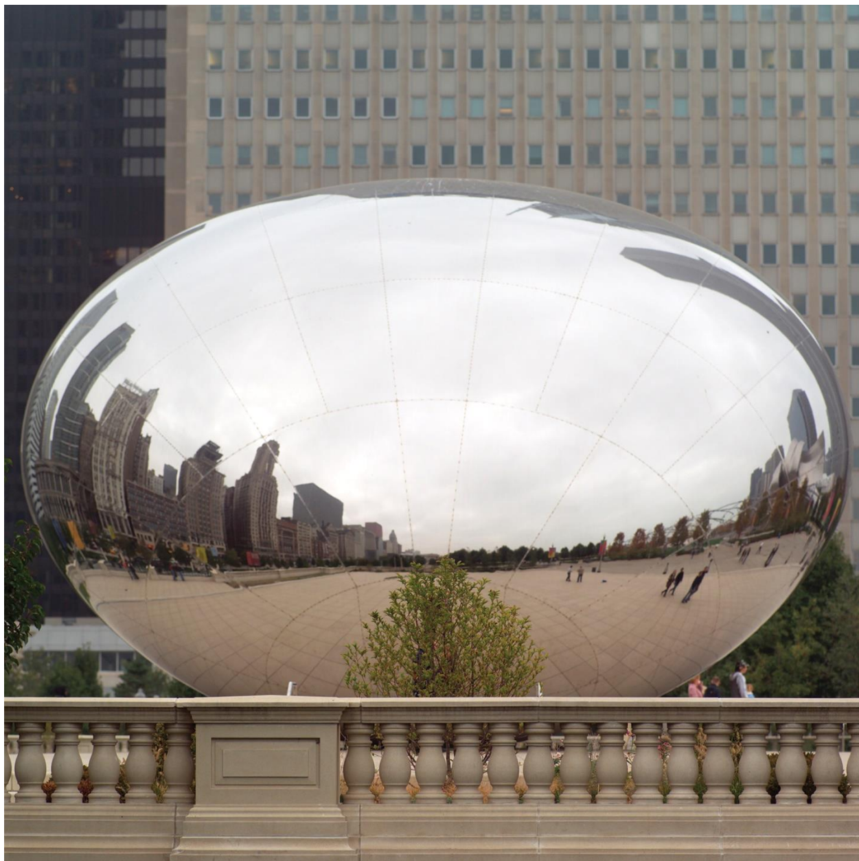
Fotografija 2, Vrata oblaka Anish Kapoor, 2006. smještena u Chicagu, IL