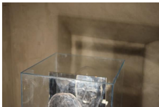
Fotografija 8,9,10,11 – prikaz gotovog rada