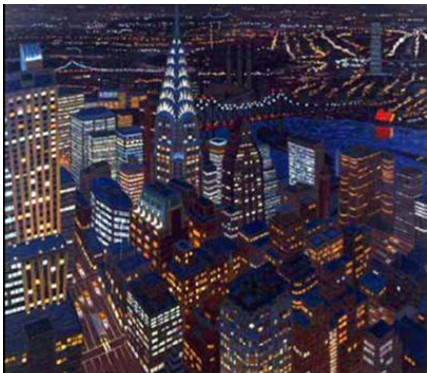
Slika 3. „Chryslerova zgrada u sumrak“, 1987., Yvonne Jacquette