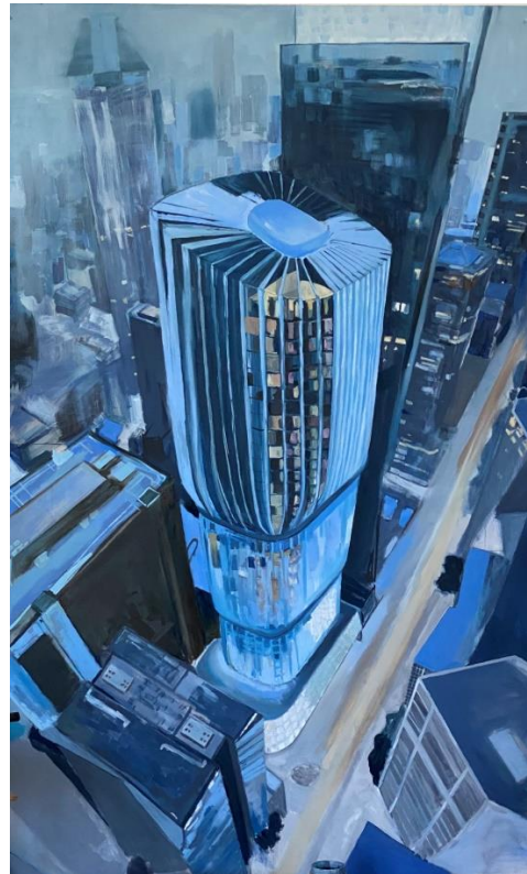
Slika 8. „proces izrade završnog rada 4/8“