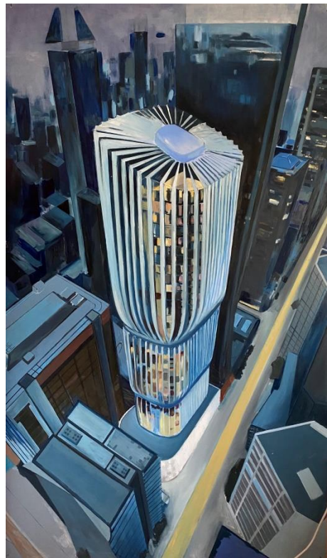
Slika 10. „proces izrade završnog rada 6/8“