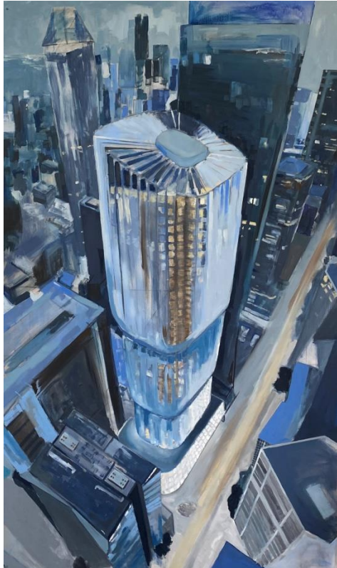
Slika 7. „proces izrade završnog rada 3/8“