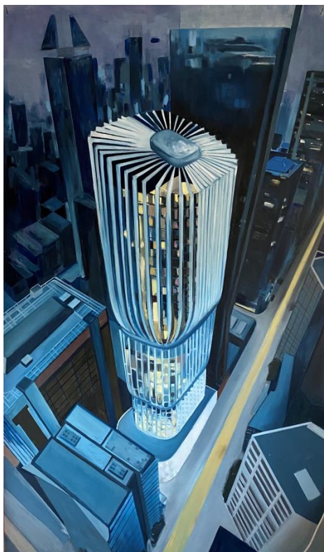
Slika 11. „proces izrade završnog rada 7/8“