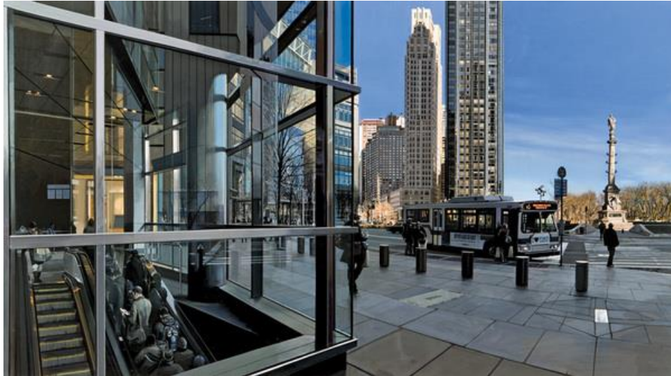
Slika 2. „Pobjeći u život“, 1993., Richard Estes