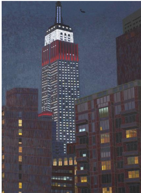
Slika 4. „Zgrada carstva II“, 2009., Yvonne Jacquette