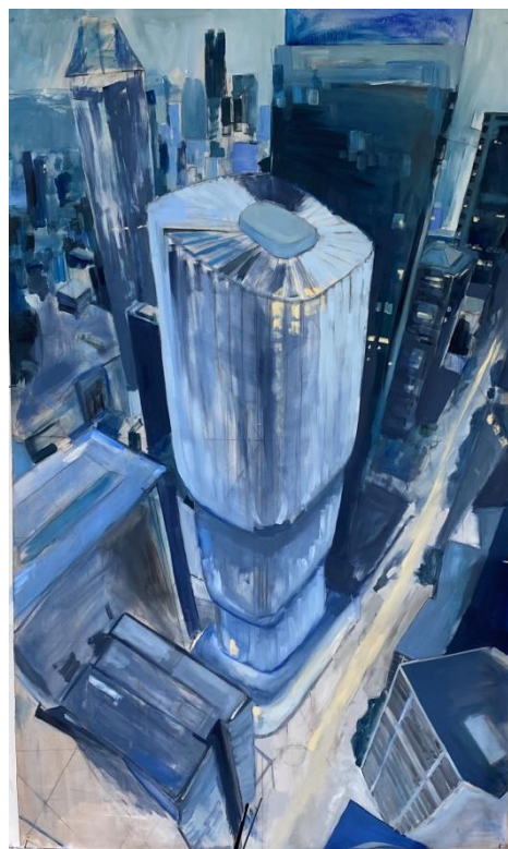
Slika 6. „proces izrade završnog rada 2/8“