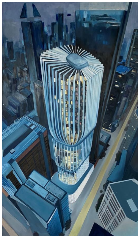
Slika 12. „završni rad 8/8“