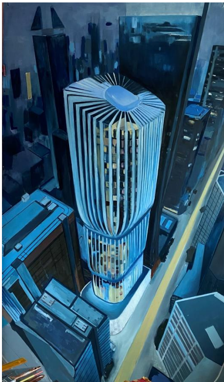
Slika 9. „proces izrade završnog rada 5/8“