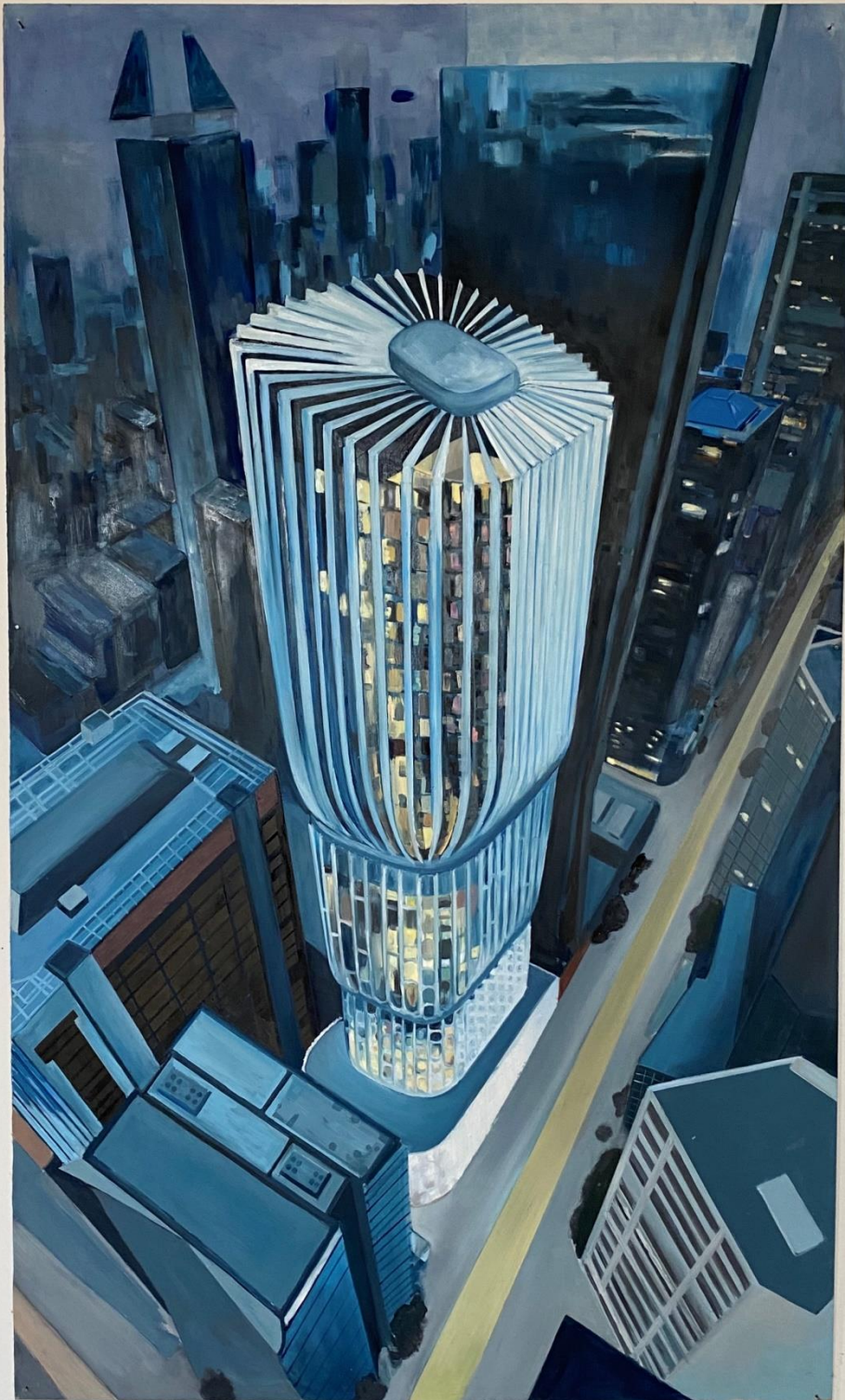
Slika 13. „Vertikale grada“ 2020.