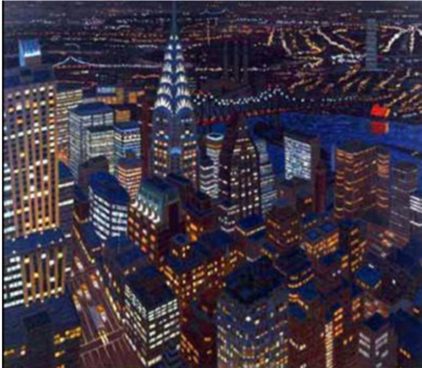
Slika 3. „Chryslerova zgrada u sumrak“, 1987., Yvonne Jacquette