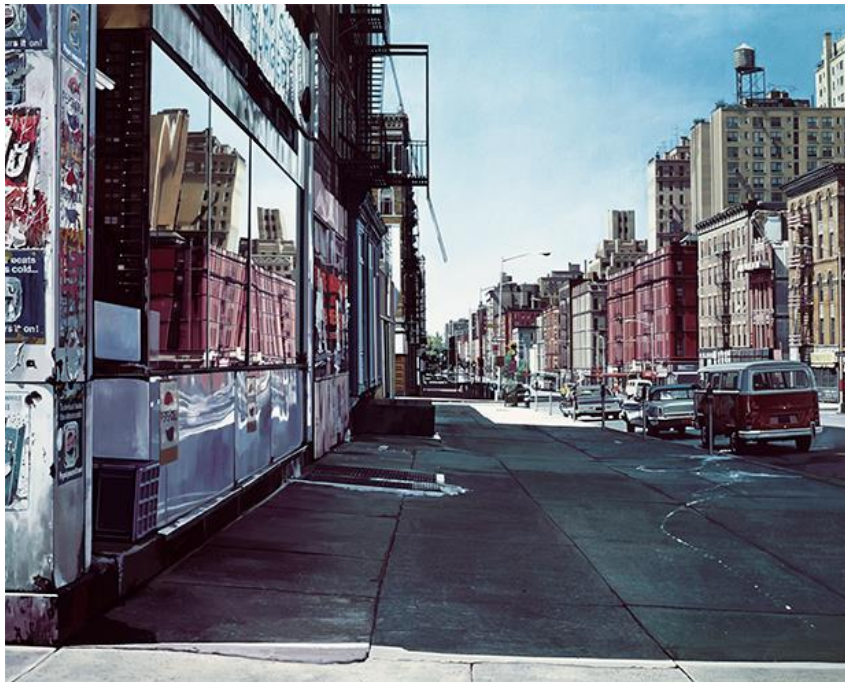
Slika 1. „Avenija Columbus u ulici 90“, 1974., Richard Estes

Richard Estes je američki umjetnik poznat po svojim fotorealističnim slikama. Njegove slike prikazuju gradske pejzaže. Prepoznatljiv je po svjetlucavim površinama nehrđajućega čelika, telefonskih govornica i izloga. Poput Chucka Closea, Audrey Flack i Vije Celmis, Estes stvara slike dobivene s fotografija preciznim i gotovo nevidljivim potezima kista. 1968. godine galerija Allan priredila je Estesu prvu samostalnu izložbu poslije koje se mogao usredotočiti na samostalni rad. Estes se u novije vrijeme koristi digitalnim softverom za manipulaciju i kombiniranje više fotografija za svoj izvorni materijal. Njegovi radovi se čuvaju u zbirkama Muzeja moderne umjetnosti u New Yorku, Nacionalne umjetničke galerije u Washingtonu, Umjetničkom institutu u Chicagu i Visokom muzeju umjetnosti u Atlanti.