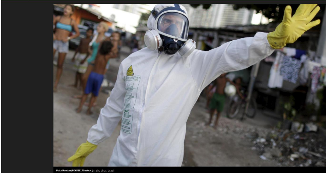
Zika virus, Brazil