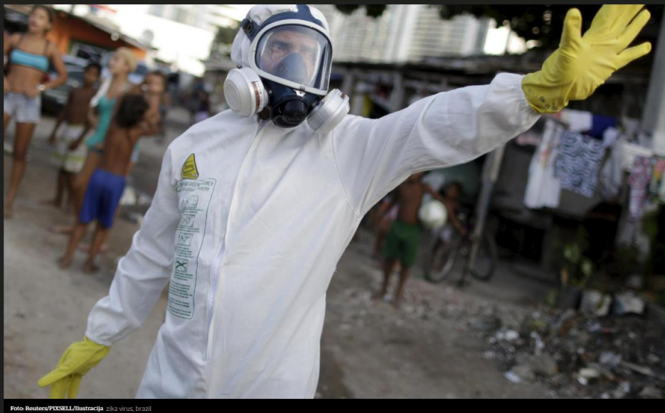
Zika virus, Brazil