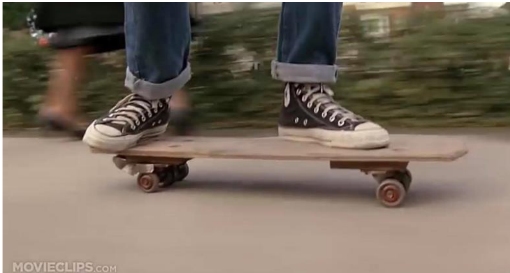
Slika 2: Converse tenisice na glavnom liku u filmu Povratak u budućnost (snimka zaslona) 10

U nekoliko navrata u filmu, dok se Marty vozi na svom skateboard-u, u krupnom planu 9 prikazana su njegova stopala gdje se jasno razaznaju tenisice marke Converse te. na početku i kraju filma, tenisice marke Nike .