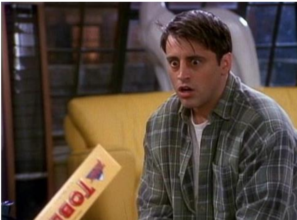
Slika 8: Toblerone čokolada u seriji Prijatelji 18

Kasnije, kada se Ross vraća na aerodrom, Joey ga zatraži da mu pri povratku kupi Toblerone čokoladu. Ovdje se spominje ime proizvoda, dakle, plasiran je audio putem kroz razgovor likova. Kasnije istog dana, kada se Emily vrati u Ameriku, ona dolazi do Monicinog stana, a sa sobom ponovno nosi veliko pakiranje Toblerone čokolade te je u kadru još jednom vidljiva čokolada. Prikazivanje čokolade ne pridodaje veliki značaj priči, ali pomaže u ostvarivanju humorističnih trenutaka kao što je onaj kada Joey ugleda čokoladu u Emilynoj torbi zbog ekspresije njegova lica u tom trenutku.