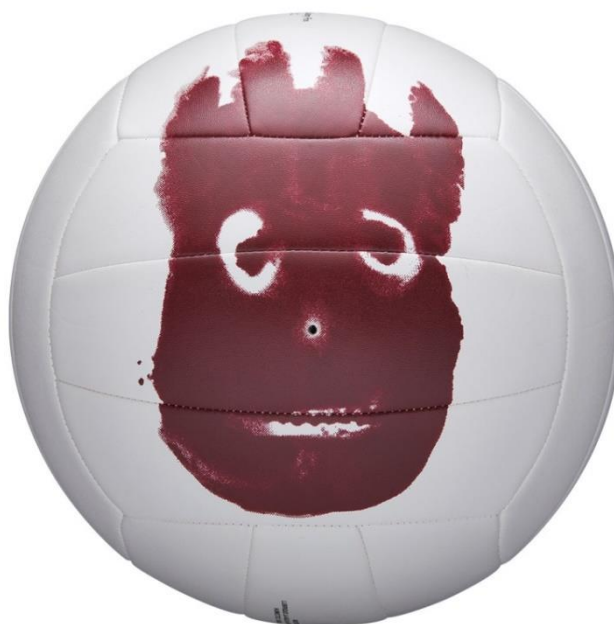
Slika 3: Wilson Sporting Goods lopta napravljena po uzoru na loptu iz filma Brodolom života dostupna u prodaji na službenoj stranici tvrtke. 11

Maynard i Scala (2006: 627-630) izračunali su koliko bi novca tvrtka platila da je plasman proizvoda u film bio dogovoren i naplaćen. Uz prvu pretpostavku da je vrijednost vremenskog prikaza lopte usporediva s prosječnom televizijskom reklamom koja traje 30 sekundi, izračunato je koliko je ukupno sekundi lopta u kadru te ja taj broj podijeljen s 30. Dobiveni rezultat jednak je 21 prikazanoj reklami. Ustanovljeno prijašnjim istraživanjima da korištenje audiovizualnih tehnika poboljšava prepoznavanje brenda, druga je pretpostavka da imenovanje samog brenda u filmu osnažuje komercijalnu poruku. Ime brenda u filmu spominje se 37 puta što pridonosi boljem pamćenju imena brenda, a diže cijenu plasmana proizvoda. Treća pretpostavka uzeta u obzir je ta da je publika ovog filma usporediva s publikom određenih televizijskih emisija. Ciljana demografska skupina većine oglašivača je populacija od 18 od 45 godina starosti, i to zbog njihove potrošnje. Za istu je tu skupinu najvjerojatnije da će kupovati sportsku opremu. Mlađi dio te iste demografske skupine najčešće su posjetitelji kina i filmskih projekcija. Takva se publika, prema Maynardu i Scali,