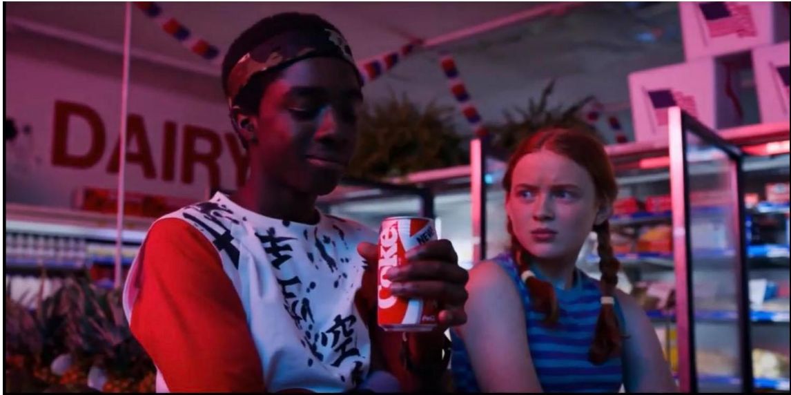
Slika 4: Prikazivanje nove Coca Cola u seriji Stranger Things (snimka zaslona) 12

Ostvarivanje uspješne reklame proizvoda ili tvrtke putem serije Stranger Things moguće je zbog velikog doseg koji je serija imala, posebno u trećoj sezoni. Kako je izvijestila platforma Netflix , premijeru treće sezone serije pratilo je preko 40 milijuna korisnika. Prema web stranici Concave Brand Tracking u trećoj sezoni serije Stranger Things zabilježeno je preko 100 različiti marki u osam epizoda treće sezone. Brendovi se pojavljuju u obliku 45 različitih proizvoda od koji su pet najčešćih bili automobili, pića, obuća, trgovine i hrana. Slika 5 prikazuje koje su se marke najviše spominjale u svakoj epizodi treće sezone serije, dok slika 6 u postotcima prikazuje zastupljenost određenih vrsta proizvoda te imena marki tih proizvoda.