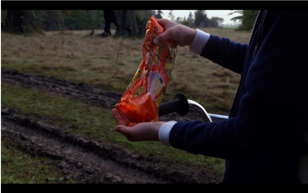
Slika 1: Reese's Pieces bomboni u filmu E.T. 7

jedanaest godina kasnije smatrao se najuspješnijim filmom u povijesti filmske umjetnosti. (Gardiner, 2015.)