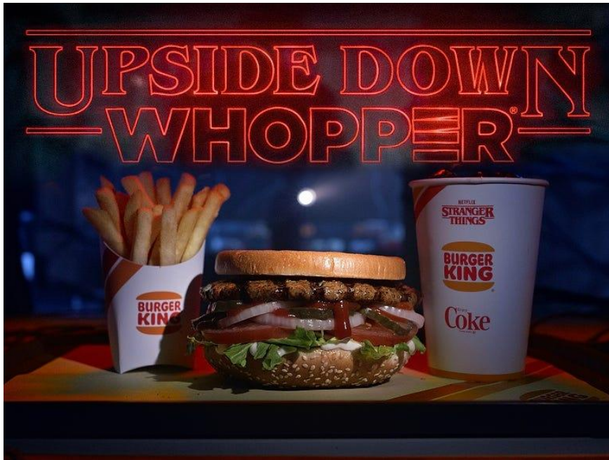
Slika 7: Upside Down Whopper Burger King meni 17

slastičarnicu u seriji Stranger Things u kojoj rade dva lika iz serije i u kojoj se odigrava dio radnje treće sezone ove serije. (Cerullo, 2019.).